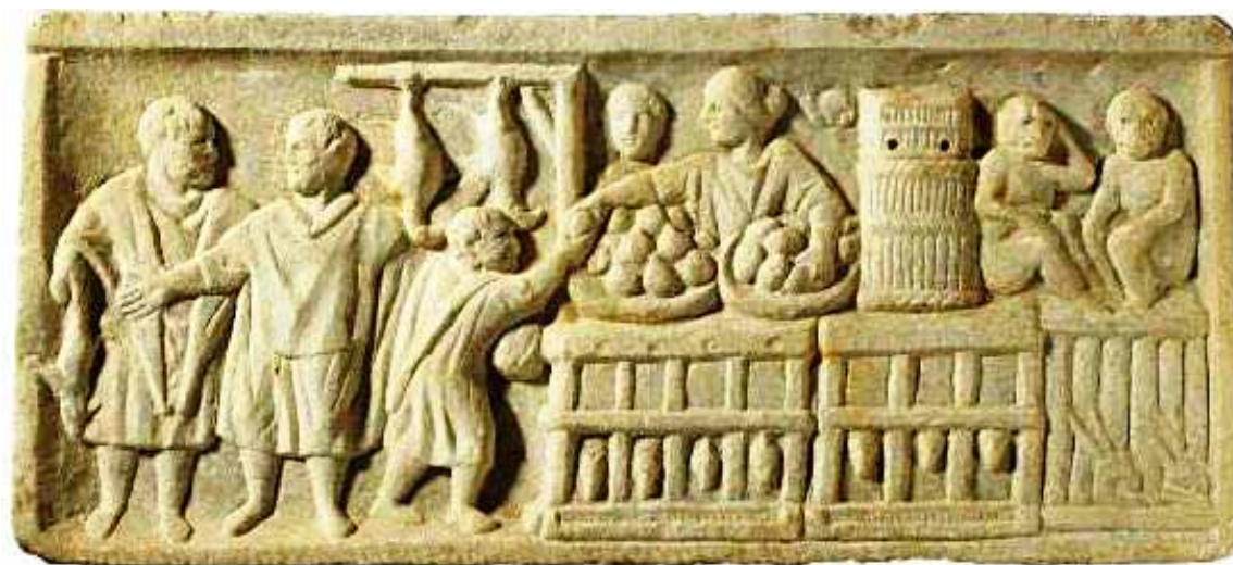
Vendita di generi alimentari al dettaglio, bassorilievo in marmo della prima metà del III secolo d.C. (Antiquarium Ostiense)

Va però subito detto che i prezzi imposti dai suddetti giudici non sempre erano i medesimi in tutto il territorio del ducato, tanto che Modena, nel vano tentativo di unificarli, il 27 febbraio