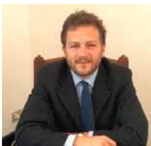
Il Presidente Nicola Poli

Sono stati implementati i servizi dell'Ufficio del Giudice di Pace, dello Sportello Unico per le Attività Produttive (SUAP), del Servizio di