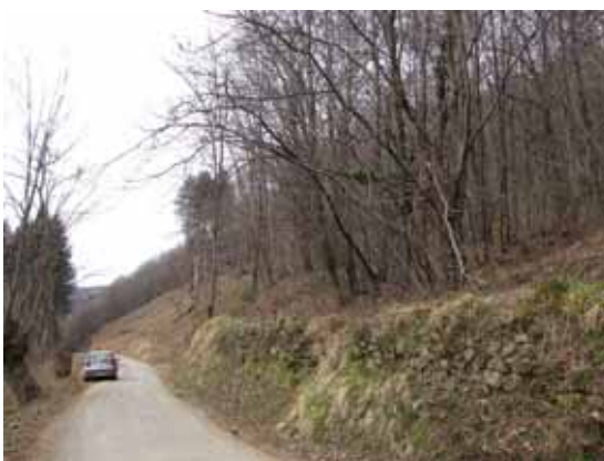
Muri di sostegno ad un'antica mulattiera in Meschiana

non vi è mai stato. Il figlio non riconosceva più la madre. Sulla base della localizzazione dei frammenti ceramici medievali rinvenuti nell'area si può dire che Meschiana fosse un villaggio aperto e disperso sul pendio a monte di San Romano, anche per il fatto che né una chiesa, né un castello avevano guidato un accentrimento del villaggio, e neppure le condizioni morfologiche avevano permesso il fondare 'casa accanto casa'; caso mai era stata una sorgente, captata da una cisterna, sventrata ma ancora esistente,