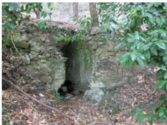
La vecchia cisterna dell'acqua in Meschiana