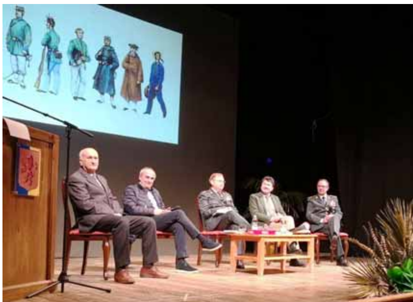
Teatro Alfieri, un momento della presentazione

“La Guardia di Finanza in Garfagnana presidio di legalità tra passato e attualità” è stato il tema dell'importante giornata che mercoledì 31 gennaio si è svolta al Teatro Alfieri, in una sala gremita di studenti delle classi 4 e 5 degli Istituti Superiori del capoluogo e di un attento pubblico. L'occasione è stata la presentazione del libro “Fiamme Gialle in Garfagnana”, scritto dal direttore del Museo storico della Guardia di Finanza, magg. Gerardo Severino, la cui edizione è stata curata dalla Banca Identità e Memoria dell'Unione Comuni Garfagnana; all'incontro ha partecipato il gen. div. Michele Carbone comandante regionale del Corpo della GdF, che ha colto l'occasione per allargare la riflessione dal contesto storico a quello dell'educazione alla legalità. Dopo i saluti del sindaco Tagliasacchi e del direttore dell'Unione Comuni Francesco Pinagli, il gen. Carbone ha sottolineato il ruolo