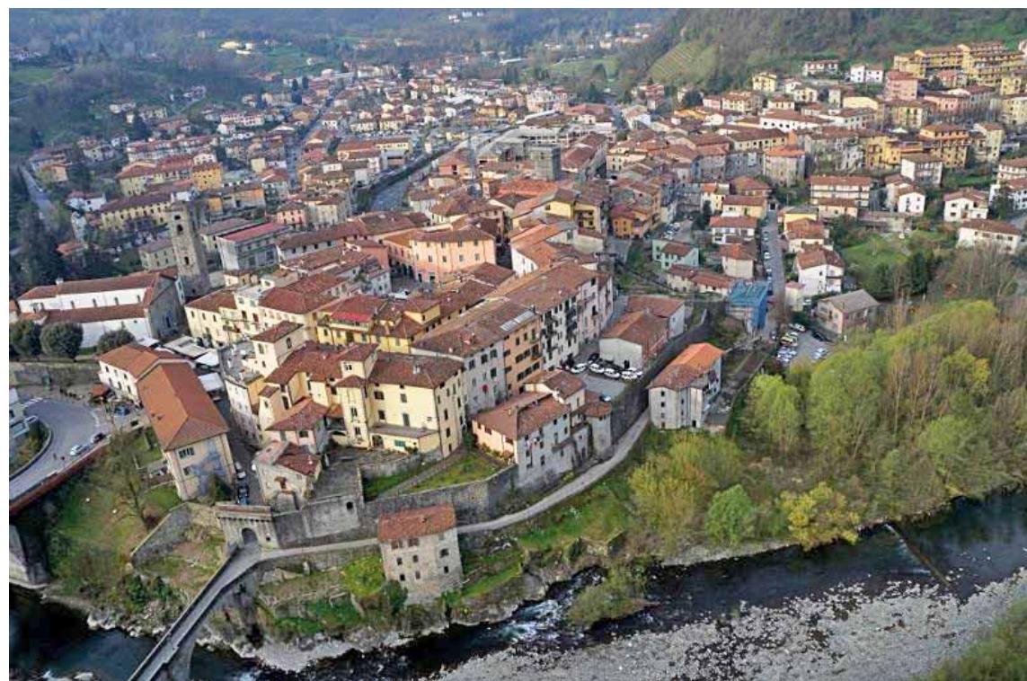
Il centro storico di Castelnuovo dall'alto