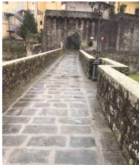
Ponte Castruccio a Castelnuovo

A Castelnuovo sono terminati lavori di Gaia per l'allacciamento della tubazione fognaria alla rete principale e al depuratore centralizzato che hanno