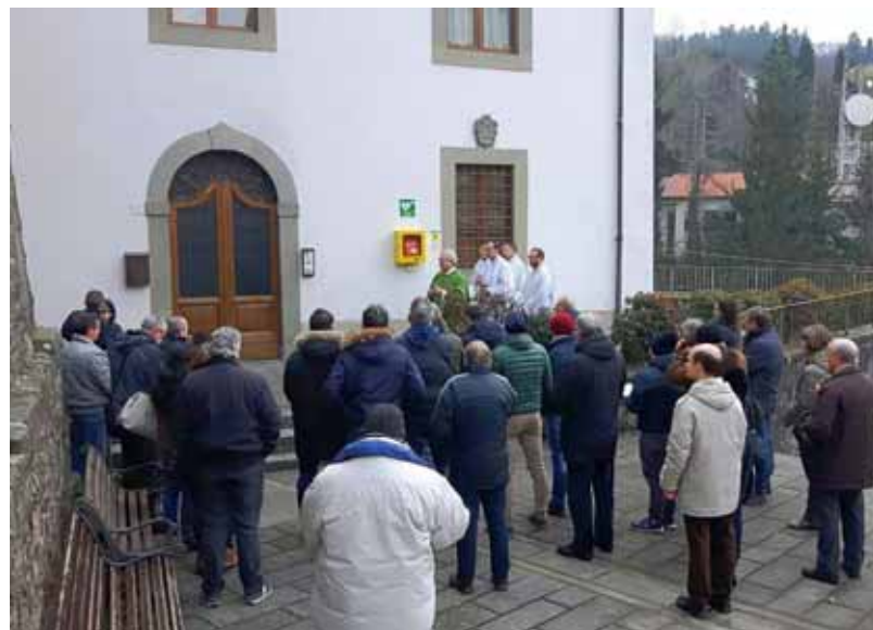
Benedizione del defibrillatore davanti alla Canonica di Castelnuovo