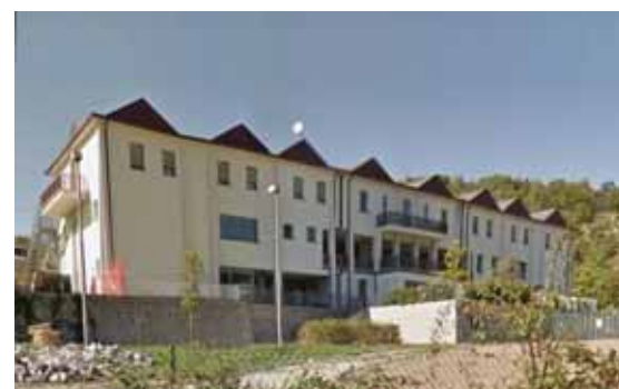
R.S.A. di Magliano