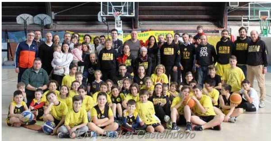
La grande famiglia del Cefa