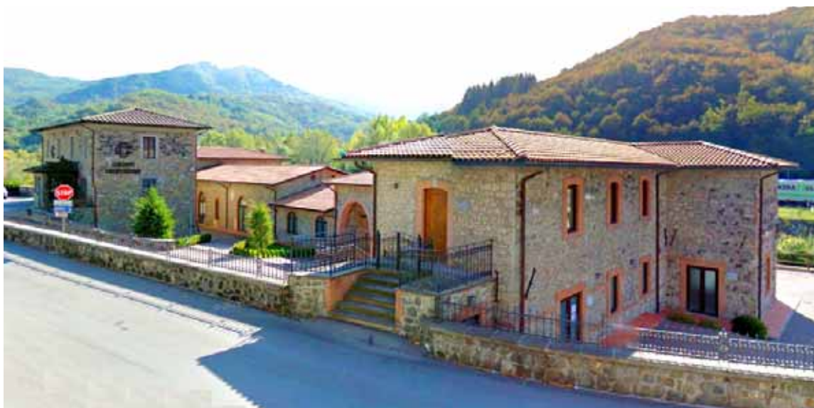
Sede di Gramolazzo della Banca BVLG

Ultimamente sentiamo spesso parlare di banche, soprattutto in toni apprensivi per paventati crack, o comunque in toni critici per scelte difficilmente comprensibili e sempre meno vicine agli interessi dei piccoli risparmiatori. In questo articolo cerchiamo di andare controcorrente, provando ad analizzare una realtà diversa, quella delle banche di credito cooperativo, rappresentate nel nostro territorio dalla Banca della Versilia Lunigiana e Garfagnana. Per fare il nostro excursus abbiamo