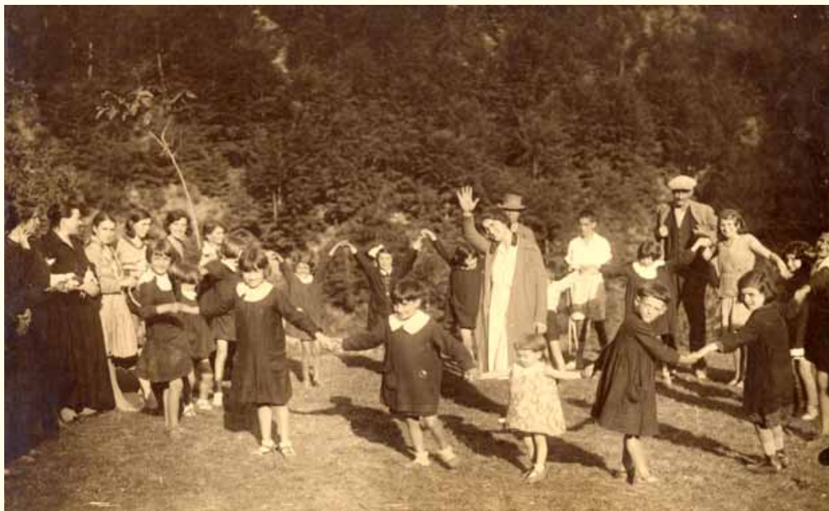
Settembre 1930, anno VIII Era Fascista.

I bimbi di Castelnuovo di Garfagnana giocano nella colonia montana del capoluogo.