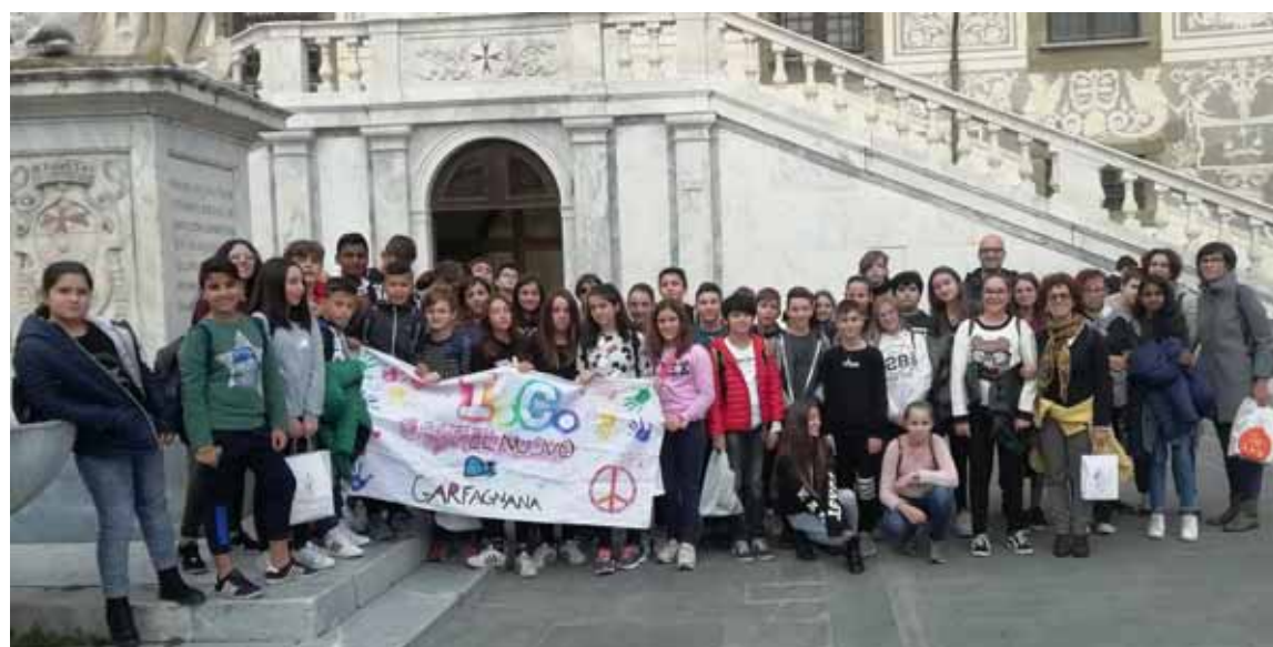
Gli alunni di Castelnuovo davanti alla Normale a Pisa