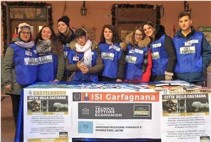
Gruppo di alunni della Quarta RIM

e di altri enti, hanno effettuato due esperienze pratiche come accompagnatori turistici alla scoperta del capoluogo garfagnino durante le giornate di "Garfagnana Terra Unica" e di "Castelnuovo città della castagna". Una iniziativa pienamente riuscita e una occasione per presentare ai visitatori percorsi tematici in italiano, inglese e francese per promuovere e valorizzare il patrimonio culturale, artistico, paesaggistico del territorio della Garfagnana.