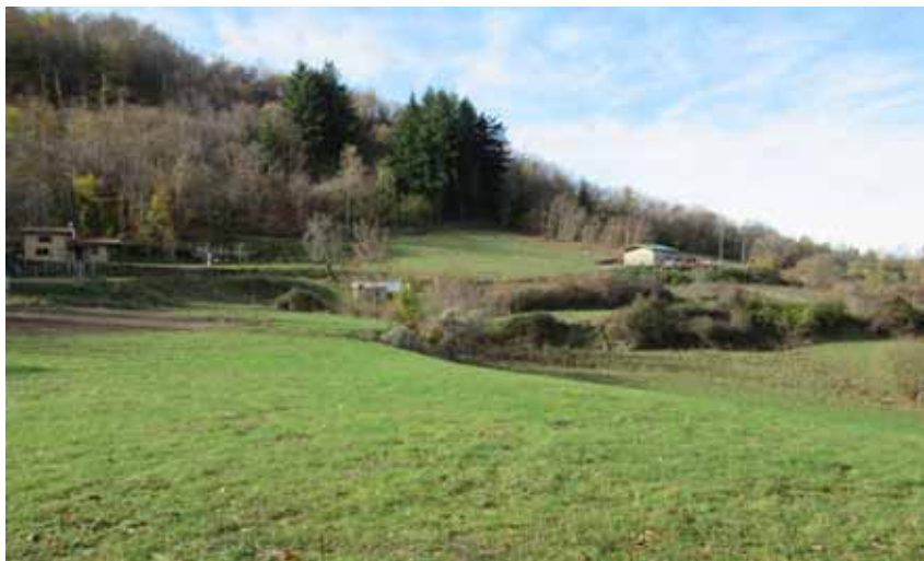
Località Vibbio nel territorio di Casciana

sul bordo stradale, come pure alla morfologia, ossia a quei colli naturali basaltici, da cui i toponimi tipo Verrucole di San Romano e sulla nostra strada Verrucorella di Casatico e Verrucollette, che costituivano rilievi ben visibili e facilmente individuabili nel paesaggio antico. A parte questa non breve digressione, il metato di Quarfino è il nostro punto di riferimento per segnalare che a monte vi è Corticola, a lato di questa Vibbio e a monte di Corticola e Vibbio vi è Vibbiodinato ed ancora sopra il Monte Vibbio. L'oronimo, in ogni modo, come l'esperienza ci insegna, è frutto della esigenza cartografica di dare un nome ad un colle senza nome. Sintetizzando, un uso improprio dei toponimi, come trascrizioni errate, deformazioni dialettali, travisamenti e spostamenti del nome, anche a causa di toponimi di neoformazione che hanno marginalizzato quelli vecchi, ci avvisano che un nome va sempre analizzato con cautela, ma ragioni storiche e morfologiche ci possono aiutare nella sua decodificazione. Ripartiamo pertanto da Quarfino, che come avevo già scritto qualche anno fa (Corriere di Garfagnana, n.1 del 2008), deriva dal termine latino quadrifinium (da cui anche Corfino ed altri nomi di luogo) avente il significato di confine di quattro proprietà; oggi ancora breve tratto del confine fra il Comune di Camporgiano e quello di Piazza al Serchio. Dato il significato del toponimo dopo i vicini Pugiana e Fabiano (nel Comune di Piazza