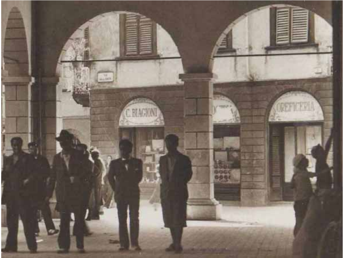
Scorcio di casa Bertagni visto dal Loggiato Porta

Purtroppo si trattò di episodi quasi sempre sfa-