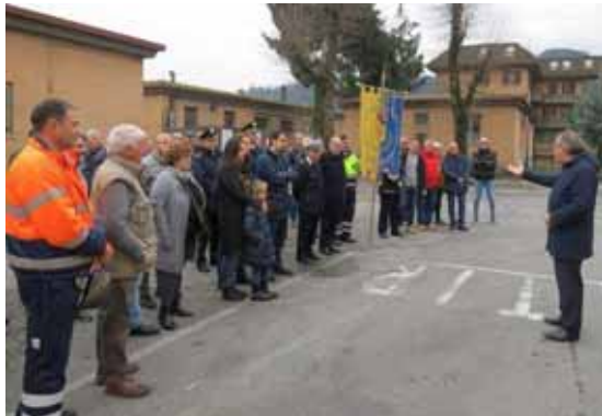
Un momento della cerimonia in cartiera

Tel. 0585 93218 - Cell. 347 5226337 begmarmi@libero.it