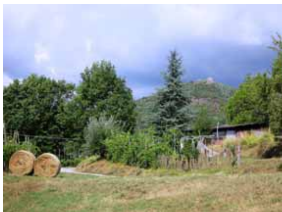
Località Tróco a valle del paese di San Romano

vistare un novantenne o un settantenne. Infine si rammenta la voce trogolo, nello stesso senso di trogo ma di uso raro che per lo più la voce è usata in senso figurato, estesa, come in italiano, a chi da maiale si comporta.