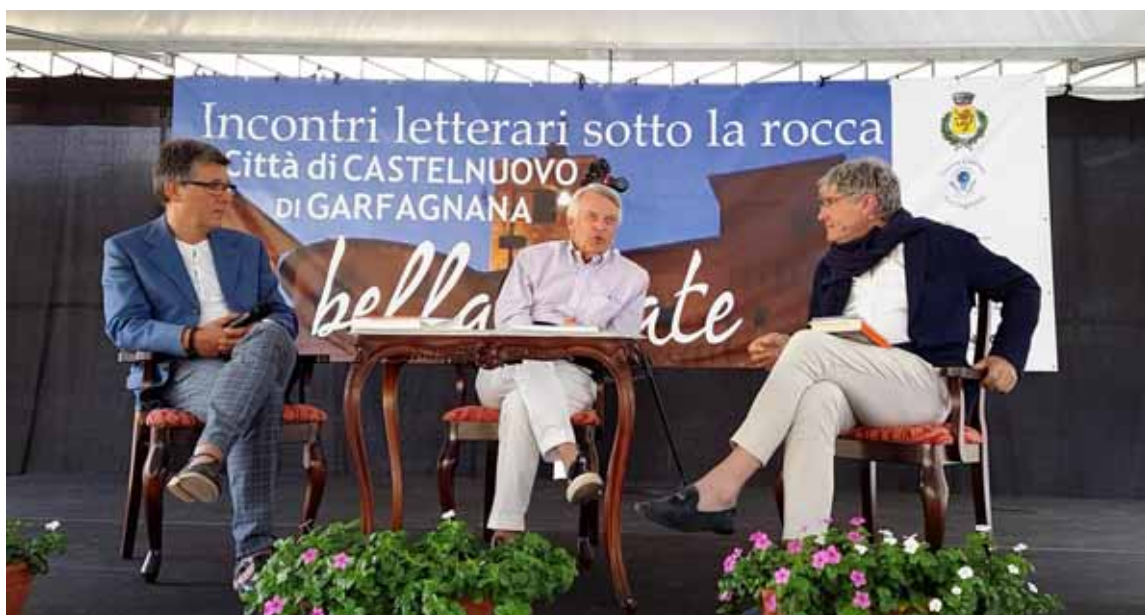
Ferruccio De Bortoli presenta il suo libro "Poteri Forti", intervistato da Fabrizio Diolaiuti e Paolo Del Debbio

L'affermazione, oltre che non condivisibile, per le ragioni che spiegheremo, presentava una aspetto antistorico da rimarcare. Infatti, se poniamo mente alla storia dell'umanità, dalle fasi più antiche a quelle moderne, tutti gli studiosi, a cominciare dai filosofi, hanno dedicato attenzioni profonde all'aspetto culturale, inteso come necessità imprescindibile, di nutrire lo spirito che alberga in ciascuno di noi. Ma non solo: la ricerca di contatti per scambiarsi idee ed esperienze ha