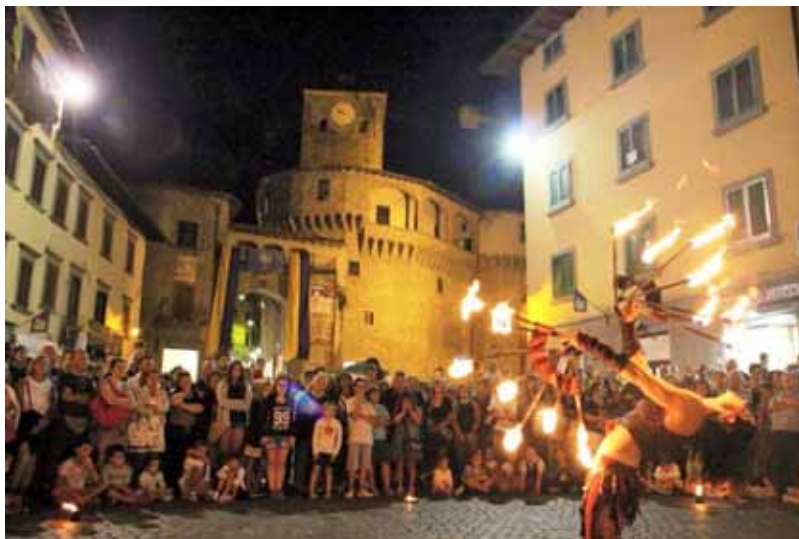
La serata rinascimentale

Fra gli eventi più importanti l'inaugurazione di giovedì 10 agosto alle 21,30: sul palco di piazza Umberto spettacolo Circo Monello a cura di