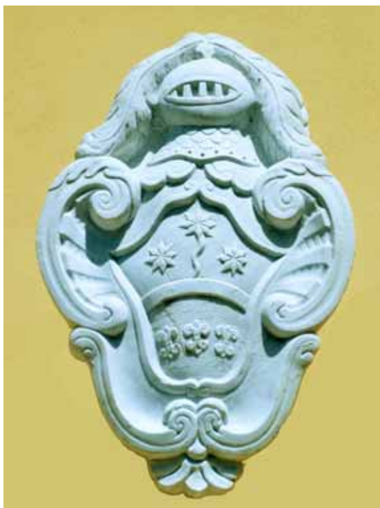
Stemma in marmo della famiglia Bertagni, attualmente proprietà dei signori Moshik

Come consultore di governo, la carriera di Bertagni ebbe inizio nel periodo in cui era governatore Don Galasso Pio di Savoia, ma essendo questi un uomo mite e poco avvezzo al comando, Pier Paolo (come solitamente veniva chiamato