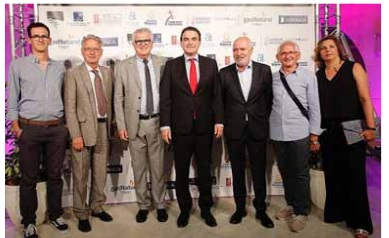
La delegazione lucchese con le autorità di Alicante