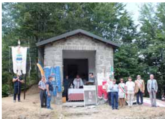
Particolare della celebrazione

Via F. Azzi, 7/D - 55032 CASTELNUOVO di GARF. (Lu) Tel. + 39 0583.62169 - Cell: +39 328 9834311- E-mail: orsettibrunello@tin.it www.ilparcoimmobiliare.it www.houseingarfagnana.com