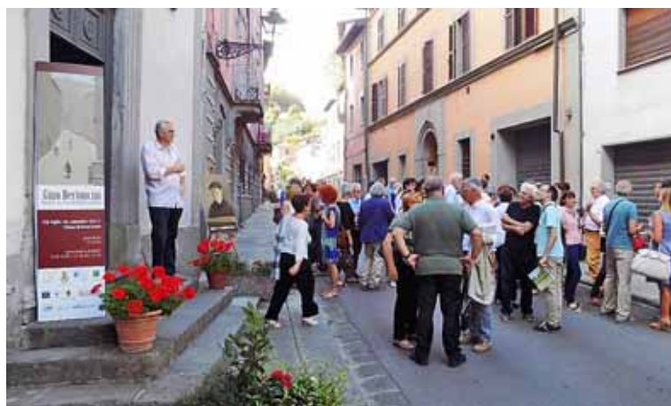
Folto pubblico all'apertura della mostra di Gino Bertoncini

Fazzi con contributi critici di Umberto Sereni, Cristoforo Feliciano Ravera e Sergio Suffredini. La mostra è stata coordinata da Iacopo Regoli con il direttivo dell'associazione presieduta da Sergio Suffredini. La fiumana di persone all'inaugurazione, ha fatto pensare di dover aprire il teatro. Per l'occasione, scoperta una targa commemorativa all'esterno della casa di famiglia di Bertoncini, al civico 24 di via XX Settembre.