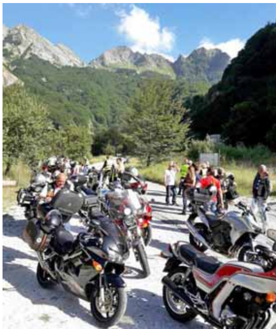
Un gruppo di motociclisti in sosta

L'undicesimo motoraduno nazionale dei laghi della Garfagnana, tenutosi a Gramolazzo dal 28 al 30 luglio, si è ulteriormente qualificato quest'anno per più di un motivo che l'hanno caratterizzato, tra cui la scelta del moto club nazionale dei Vigili del Fuoco di voler celebrare il loro