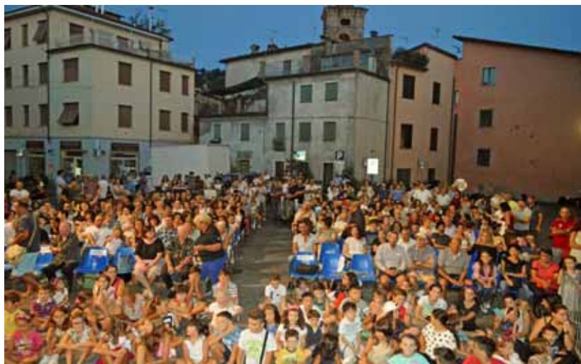
Il pubblico di MagiX in attesa dell'inizio dello spettacolo