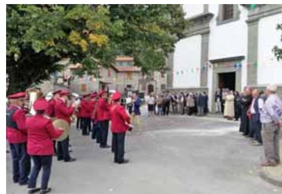
La cerimonia