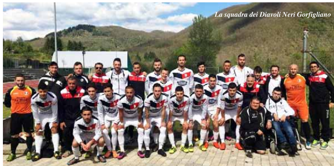
La squadra dei Diavoli Neri Gorfogliano