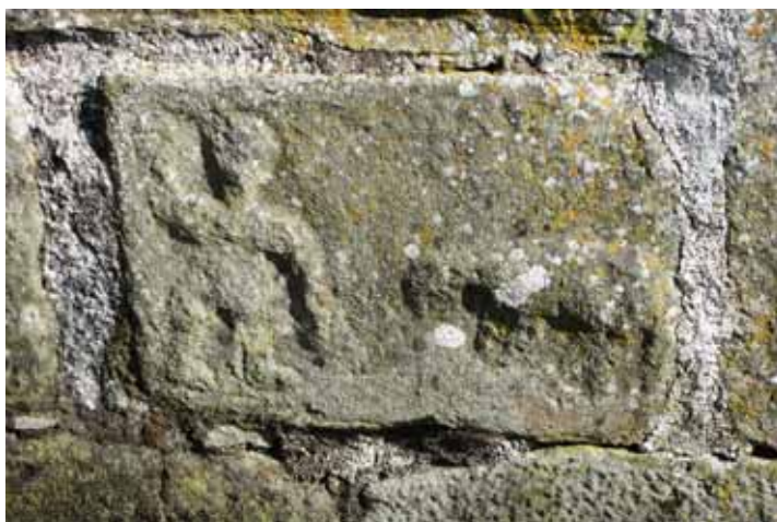
Concio con uomo e animale a bassorilievo

un uomo con il braccio destro alzato e l'altro abbassato forse a tenere una corda cui è legato un animale; in questo mi pare di riconoscere una pecora e non l'orso che viene portato a Modena, come vuole la tradizione orale. L'altra pietra è ormai illeggibile, ma doveva riportare una sirena bicaudata, che a sole radente una coda delle due era ancora visibile qualche anno fa, mentre ora un'asta in ferro l'ha definitivamente nascosta alla vista. Più interessante sono altre due pietre, una, sebbene spezzata, è decorata da un motivo a intreccio che potrebbe essere testimonianza di un precedente edificio venuto in luce nel disfacimento dell'abside o nell'ampliamento della chiesa; una volta rinvenuta è stata inserita nella parte in opera. Doveva essere interna in quanto conserva residui di una imbiancatura a calce, come i vicini cantonali di recupero. Più misteriosa è la seconda pietra rimurata sul lato settentrionale della chiesa e