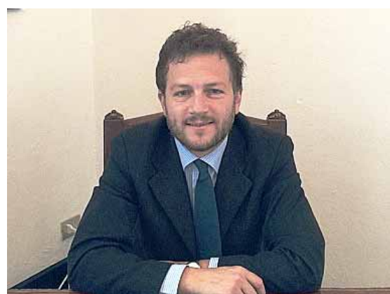
Il Presidente Nicola Poli

Progettazione e programmazione territoriale, cura dell'assetto del territorio ed interventi straordinari di ripristino sul Piano di Sviluppo Rurale della Regione Toscana: l'Unione Comuni Garfagnana ente di riferimento a livello regionale con potenzialità occupazionali per le ditte locali del settore.