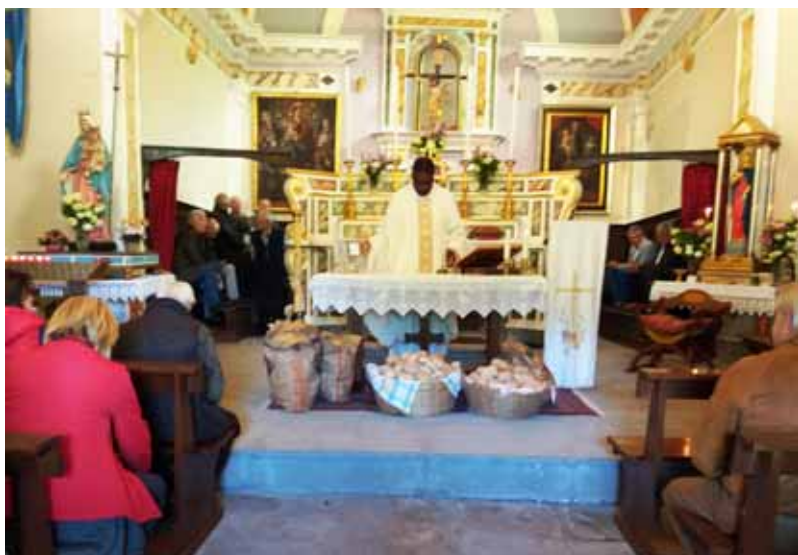
Festa di Santa Cristina a Brica