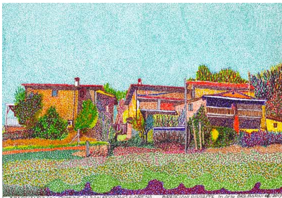
Veduta di Bacciano (nei dintorni di Villetta nel Comune di San Romano in Garfagnana)