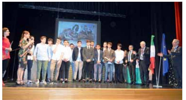
La classe 4B del Liceo vincitrice del concorso.