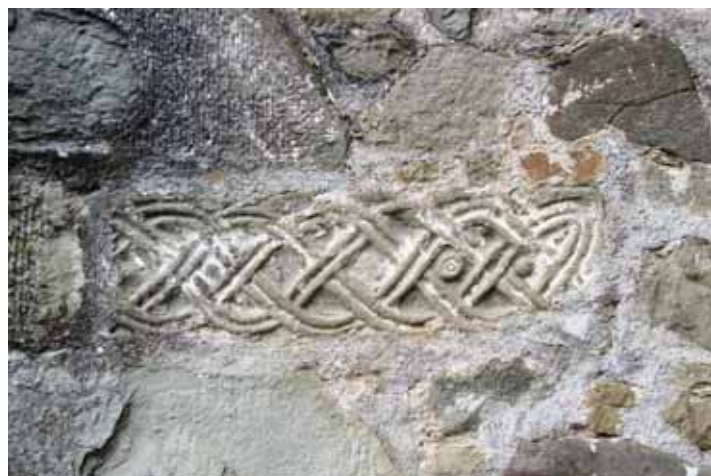
Frammento di architrave decorato con treccia a doppio vimine

A parte i diversi caratteri dei muri che mostrano il divenire della chiesa di San Lorenzo, merita segnalare quattro pietre decorate ed inserite nei corpi murari, che pongono altri problemi. Le due sul lato settentrionale, in quella specie di lesena all'incontro del muro settentrionale con il muro di facciata, sembrano reimpiegate nel cantonale rifatto, la cui sporgenza rispetto al fianco settentrionale appare indicarci il suo spessore originario. Le due pietre decorate e affiancate ricalcano motivi ricorrenti nell'apparato delle chiese medievali. In una è