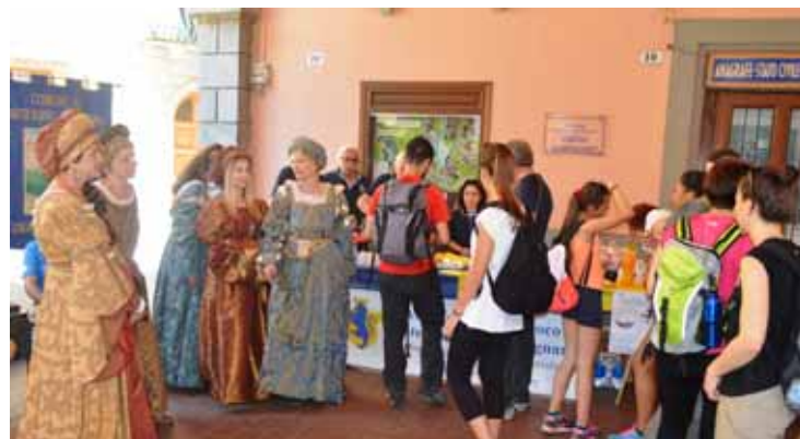
Il punto di ristoro allestito dalla Pro Loco di Castelnuovo in collaborazione con la Compagnia dell'Ariosto

Una splendida giornata di sole ha accolto i quasi 200 partecipanti che, sabato 27 maggio, hanno preso parte alla ormai tradizionale Camminata storica.