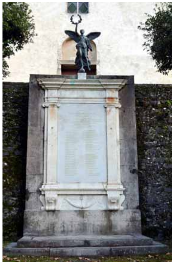
Il monumento restaurato

L'opera è composta da una statua in bronzo con figura di "Vittoria alata" dell'artista Francesco