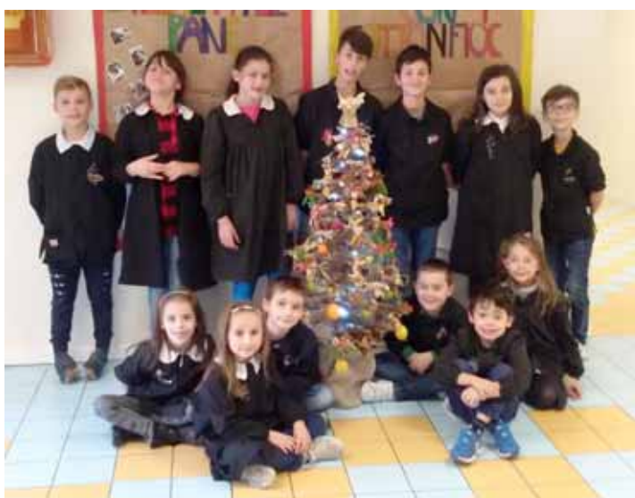
I vincitori assoluti del concorso garfagnino dei Presepi