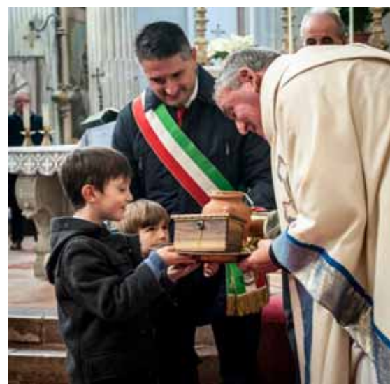
La celebrazione nella chiesa di San Michele