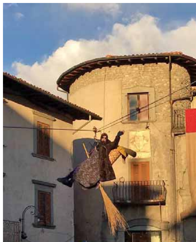
La Befana scende dalla Rocca

* A Castelnuovo la Befana è scesa dalla Rocca Anche quest'anno, puntuale come sempre, la vecchietta più famosa al mondo ha fatto tappa nei paesi della Garfagnana. Tanti gruppi capeg-