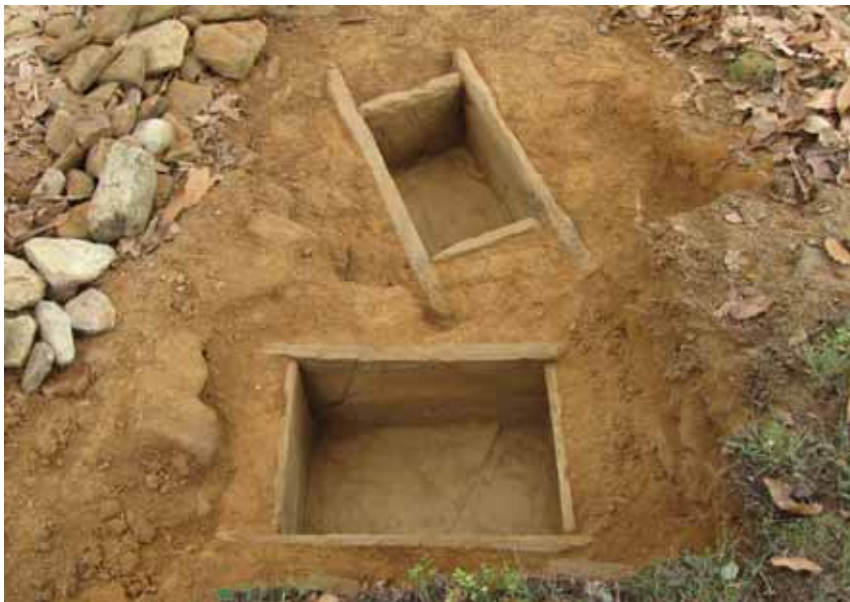
Le due tombe a cassetta riportate in luce

PIAZZA AL SERCHIO (Lu) - Tel. 0583.696058