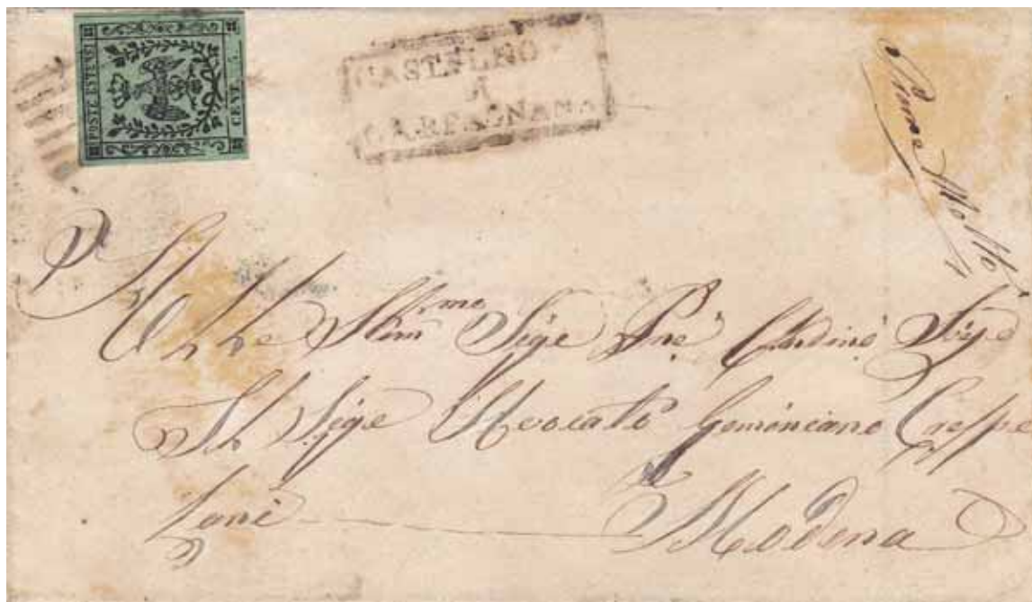
Lettera spedita, dopo il 1852, dall'ufficio di Castelnuovo a quello di Modena. Da notare la magniloquenza dell'indirizzo.

Ma per la Direzione Generale delle Poste Estensi, forse il problema più grande era l'elevato costo di gestione, poiché non sempre c'era un equilibrato rapporto tra l'apparato organizzativo (uffici, stazioni di posta, cavalli e corrieri) e la quantità di pacchi e lettere che giungeva nei diversi centri di raccolta. Allora in Garfagnana non erano molte le persone che sapevano leggere e scrivere, specialmente se di misera estrazione sociale,