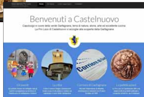
Il nuovo sito della Pro Loco di Castelnuovo

www.castelnuovogarfagnana.org dà la possibilità a chiunque sia interessato, di navigare con semplicità e rapidità alla ricerca di notizie e informazioni del luogo. La grafica, intuitiva e moderna, prevede numerose sezioni, tutte facilmente accessibili. In primo piano gli eventi e le principali attrazioni turistiche. Oltre a questo il sito si compone anche di una sezione dedicata al Corriere di Garfagnana, dove è possibile sfogliare con un semplice click