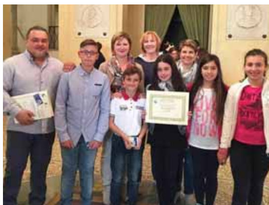
Delegazione di Galliciano alla premiazione a Cesena