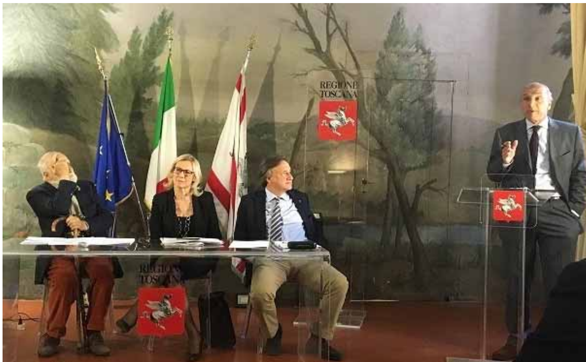
Conferenza stampa nella sede della Presidenza della Giunta Regionale Toscana a Firenze.