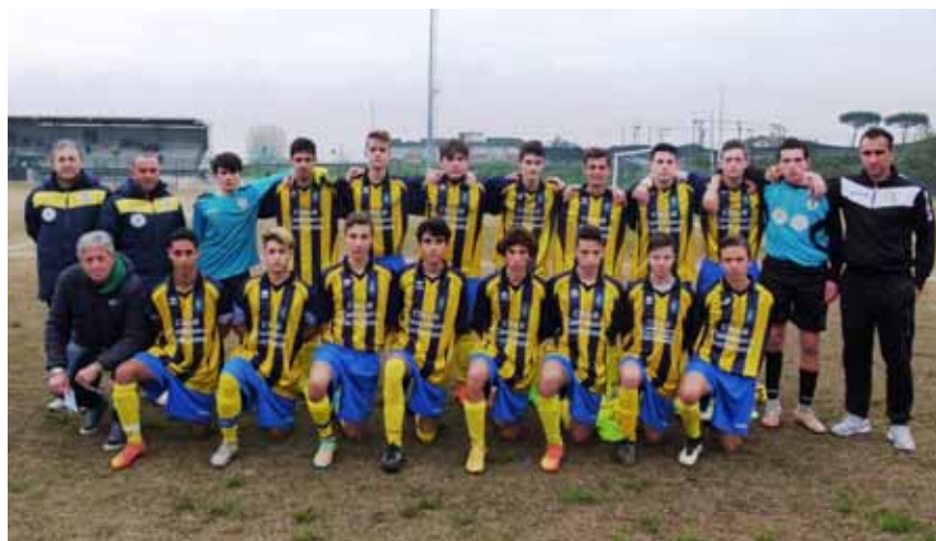
Squadra Allievi A campione provinciale