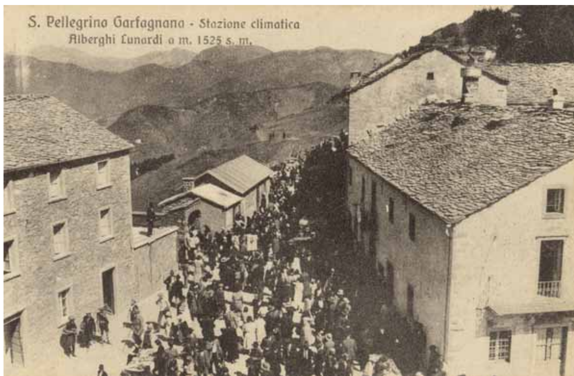
Una veduta di S. Pellegrino nei primi anni del Novecento (cartolina di Silvio Fioravanti)

Nei pochi anni della Repubblica Cisalpina, abbiamo una lettera inviata dal capitano Ferrari del primo reggimento Ussari e comandante dell'ex Provincia della Garfagnana, al Capo Sezione della Guardia Nazionale, Vanni, dalla quale apprendiamo quanto allora fosse poca la sicurezza lungo la Via Vandelli: «Per molti ricorsi prevenuti al mio Bureau da diversi Lom-