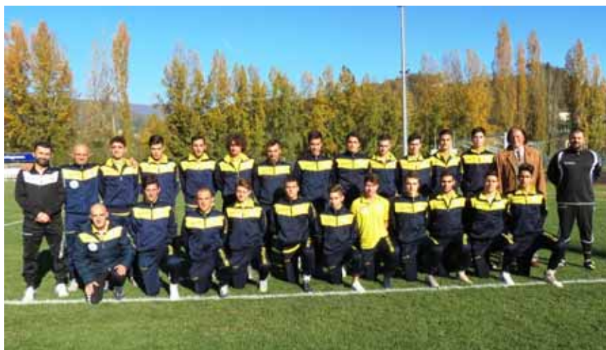
La squadra Juniores campione provinciale

Via F. Azzi, 7/D - 55032 CASTELNUOVO di GARF. (Lu) Tel. + 39 0583.62169 - Cell: +39 328 9834311- E-mail: orsettibrunello@tin.it www.ilparcoimmobiliare.it www.houseingarfagnana.com