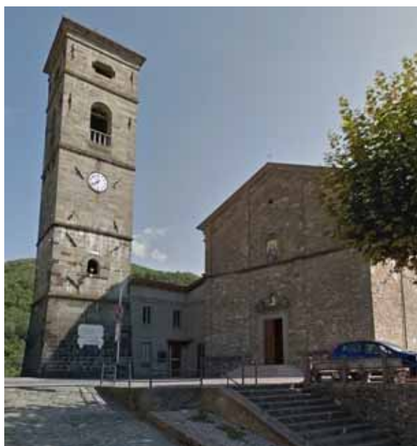
Piazza al Serchio

Il prossimo 5 giugno, insieme ad altri 1.368 Comuni italiani, anche i cittadini di due importanti comunità garfagnine, saranno chiamati alle urne per rinnovare le proprie amministrazioni. Si tratta di Piazza al Serchio e Pieve Fosciana che votano in maniera sfalsata rispetto a tutti gli altri. Parliamo di due realtà che non raggiungono i 3.000 abitanti (entrambi si attestano su circa 2.400 cittadini) e che, pertanto, oltre che il Sindaco, sono chiamate ad eleggere 12 consiglieri, otto nella lista che avrà il maggior numero di voti e quattro divisi fra le liste minoritarie. Che cosa succede nei due Comuni? Quali sono