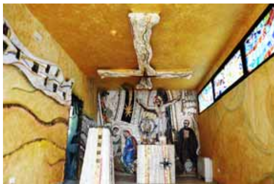
Interno della Cappella con i mosaici

il cuore pulsante della struttura. Nel mosaico di fondo alla sinistra, rappresentata da una grande cometa, il mistero dell'Annunciazione e dell'Incarnazione. Nel centro un tabernacolo sulla cui porticina è raffigurato un pellicano, uno dei simboli dell'Eucarestia. Maestoso è il Cristo crocifisso che si sviluppa sulla parete dall'alto verso il basso: le sue braccia aperte e il suo sguardo profondo sembrano dire che la