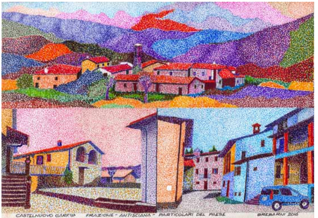
Antisciana (Castelnuovo di Garfagnana) - Panorama e particolari del paese.