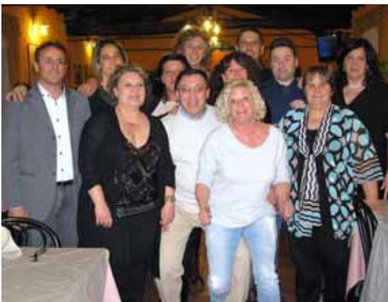
I ragazzi della 5 a dopo trent'anni

A trenta anni dal conseguimento del diploma in Ragioneria nell'ormai lontano 1986 gli studenti della 5A dell'Itec "Campedelli" di Castelnuovo si sono ritrovati per una serata di allegria al ristorante Il Pozzo di Pieve Fosciana, all'insegna dell'amarcord, del ricordo di tanti particolari, dei loro insegnanti e di questi trent'anni trascorsi