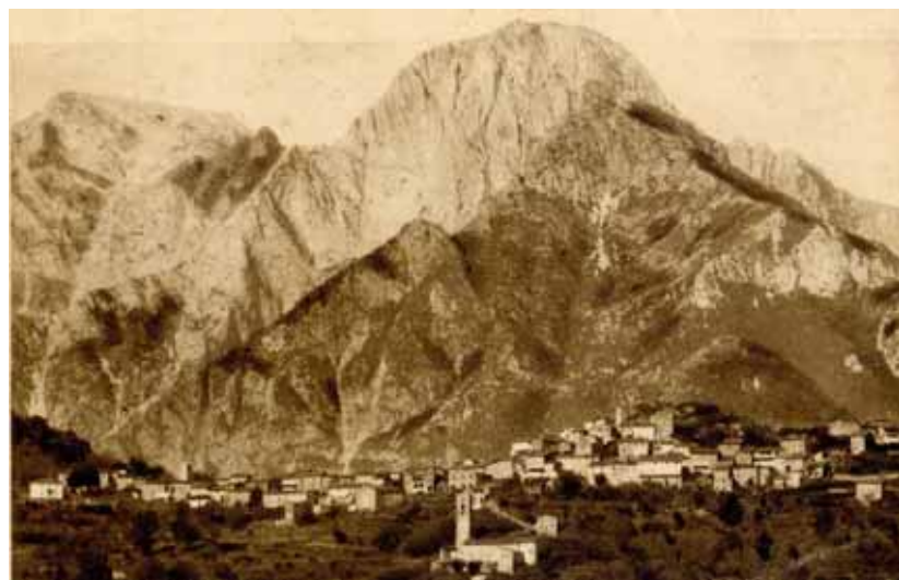
Trassilico con sullo sfondo le Alpi Apuane (cartolina di Silvio Fioravanti)

sarebbe l'unico caso nel quale Gunduald tratta un affare al di fuori dell'ambiente strettamente locale", così L. Angelini nel suo lavoro "I Longobardi de Campulo " (in «La Garfagnana dai Longobardi alla fine della Marca canossana - secc. VI/XII»), a cui rimando per la figura storica di Gundualdo e i suoi interessi economici nell'area 'pievarina'. Da parte mia aggiungo che pure il venditore della vigna, Baruncio, è di Canpulo e quindi sarebbe strano l'acquisto di una vigna, insieme ad un altro pezzo di terra incolto, in luogo lontano da Campori. Pur consapevole che niente vieta di stare in un villaggio e possedere beni in posti assai distanti, mi sembra poco credibile che Gundualdo fosse interessato a terre in un luogo così lontano da Campori e non facilmente raggiungibile come Trassilico. È molto più probabile, invece, un interesse verso terre vicine. Quali potrebbero essere state? Visto che nei documenti storici il toponimo Sillico ha varie forme ed inoltre è abbastanza vicino a Campori, vedrei in questo l'esito del Trasicclu dell'atto di vendita/acquisto registrato nell'antica pergamena. Trasicclu si potrebbe leggere come