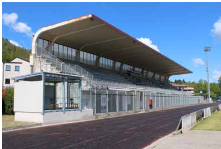
La nuova struttura al "Nardini"

A Castelnuovo è stata inaugurata la struttura protetta che permetterà alle persone diversamente abili di assistere alle partite allo stadio "Alessio Nardini", con facilità di accesso per le carrozzelle e al riparo in caso di maltempo. In particolare sono state realizzate, su progetto dell'architetto ed ex giocatore del Castelnuovo, Pacifico Fanani, una rampa di accesso e una postazione coperta