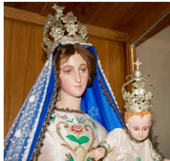
Particolare della Madonna restaurata

Un santuario di grande valore, reso magico anche dall'incantevole cornice del piccolo borgo di Pontecosi, che con l'arrivo della bella stagione merita indubbiamente una sosta e una riscoperta. Per maggiori informazioni, o per richieste di visite straordinarie, visitare il sito