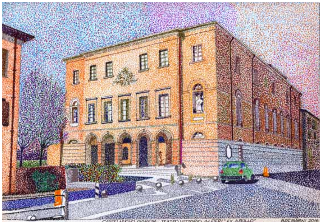
Castelnuovo di Garfagnana - Teatro Alfieri