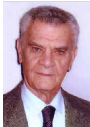
* Anniversario Castelnuovo di Garfagnana