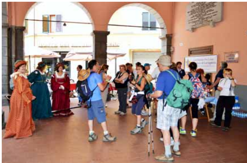
Il punto di ristoro allestito dalla Pro Loco di Castelnuovo in collaborazione con la Compagnia dell'Ariosto

Via Pettinella, 30 - Castelnuovo di Garfagnana (Lu) Tel. e Fax 0583 62943 - Email: flisuffredini@libero.it