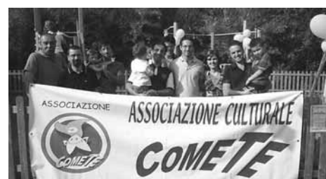
Un momento di una festa a Molazzana

Un anno importante, il 2010, per l'attività di "ComeTe", l'associazione creata a Castelnuovo di Garfagnana nel 2007 con l'intento di sostenere bambini meno fortunati.