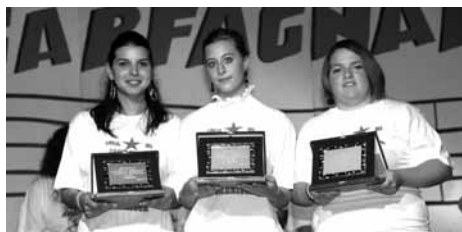
le vincitrici del concorso "Una stella in Garfagnana"