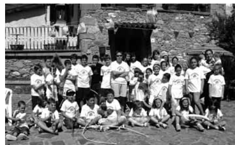
I piccoli artisti di Antisciana

La sedicesima edizione della bella giornata nel paese di Antisciana si è svolta quest'anno il 29 agosto u.s. Gli organizzatori del paese scelgono tutti gli anni un tema sempre diverso che caratterizza tutte le attività della giornata; quest'anno ad Antisciana sono saliti Robin Hood e i suoi amici (e nemici: vedi il principe Giovanni senza terra, lo sceriffo di Nottingham e i suoi scagnozzi, intenti a impedire che i forzieri del tiranno pieni di monete d'oro ingiustamente sottratte ai poveri abitanti del nord dell'Inghilterra fossero ridistribuiti da Robin e i suoi compagni). Nei bei disegni, realizzati da bimbi e bimbe divisi in categorie di età, aventi quattro anni in su, sono stati raffigurati l'eroe medioevale e il paesino di Antisciana, con tecniche e ispirazioni diverse da bimbo a