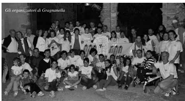
Gli organizzatori di Gragnanella