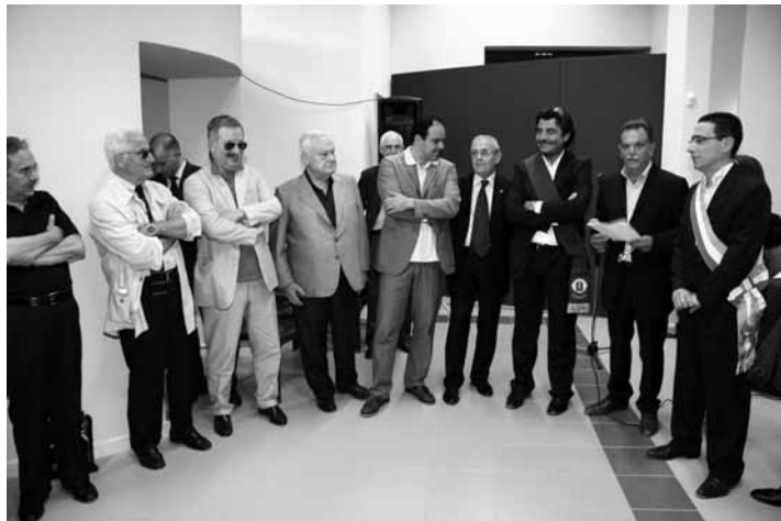
Un momento dell'inaugurazione

Senza ombra di dubbio la mostra dedicata ad Oreste Paltrinieri è stata un vero successo a dimostrazione della virtù culturale di un territorio che lancia a tutta la provincia un messaggio forte rivolto al futuro. Auspichiamo infine