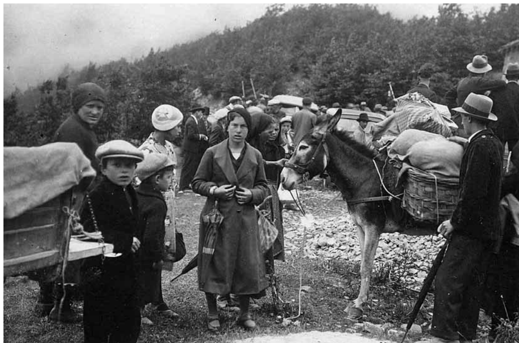
2 agosto 1936: sagra Pascoliana al Passo delle Forbici.

il vestito, si graffiò le mani ed il viso, ma arrivò in tempo per vedere la mamma svenuta. Con dell'acqua le bagnò il volto, la baciò sulle guance e tra i capelli e pianse, finalmente pianse, vedendola di nuovo sospiare. Sentì un forte dolore al petto, chiuse gli occhi per la mancanza di respiro, e quando li riaprì si ritrovò vicina alla mamma che si riprendeva dal suo male. La baciò, la accarezzò, se la strinse al petto. E sentì una gioia grande quanto mai provata. Con la mamma riprese poi la via del ritorno a casa ed era felice, veramente felice.