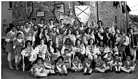
Nella foto il gruppo della contrada Ponticelli di Quattro Castella.

* Sabato 3 luglio si è svolta il "1° torneo gallicanese della bandiera" organizzato dal gruppo sbandieratori e musicisti di Galliciano con il patrocinio della LIS, lega italiana sbandieratori, associazione nata nel 1982 e che riunisce i migliori gruppi nazionali. Dopo la sfilata nelle vie del paese i 4 gruppi in gara, Rivarolo Mantovano, Quattro Castella (RE), Zeveto di Chiari (BS) e Galliciano si sono sfidati nelle discipline del singolo, coppia, piccola squadra e assolo musicisti. Nel singolo e piccola squadra hanno prevalso gli atleti emiliani Quattro Castella, nella coppia e musicisti, Galliciano, ma la vittoria finale del torneo è stata appannaggio di Quattro Castella.