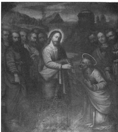
San Pietro riceve le chiavi - particolare

* Fosciandora - Restaurate due opere a Lupinaia Quest'anno, in occasione della festa del patrono di Lupinaia, San Pietro, i festeggiamenti nel paese fosciandorino hanno assunto una particolare rilevanza e solennità.