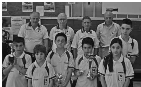
Gli atleti della "Bocciofila Garfagnana" con i dirigenti

* Castelnuovo ha ospitato una Interregionale di bocce Domenica 22 giugno, con il sostegno di Comunità