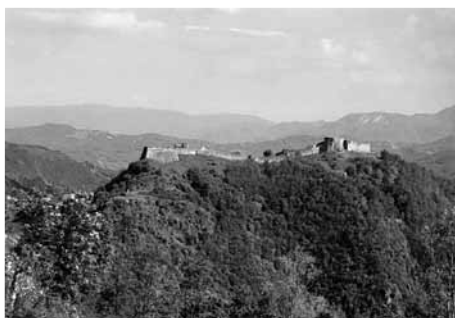
La Fortezza delle Verrucole

In questo senso particolare spazio avranno le tradizioni