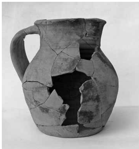
Castelvecchio, boccale della fine del XII secolo Scavo archeologico all'interno del Castelvecchio

ritagliato proprio gli strati archeologici preesistenti. La stessa realtà, ossia materiali pertinenti a più periodi storici, è stata riscontrata sul rilievo su cui il Castelvecchio e parimenti nelle guglie di Monte Croce. Di certo di fronte a tanta ricchezza archeologica si oppone lo sconsolante silenzio per la storia del territorio di quanto scomparso che non può più testimoniare quel passato di cui era stato frutto. Nessun reperto della necropoli longobarda si è salvato; distrutta pure la Pieve di San Pietro per fare spazio all'edificio della Scuola media e ai successivi ampliamenti; distrutta anche parte di Sala - sala è parola di origine longobarda - senza alcuna indagine archeologica preventiva; le ossa umane di qualche tomba distrutta galleggiavano sul terreno scaricato sulla scarpata del Serchio. Erano ossa di sepolture pertinenti alla chiesa di San Giorgio di Sala, nota dai documenti storici ma di cui ignoriamo la localizzazione, o a qualche inumazione più antica? Distrutti pure gli strati archeologici e portato via il materiale dalle caverne di Monte Croce, da rapaci clandestini, cui si deve anche il lascito sul luogo di diversi piatti di plastica dopo un, presumo, lauto pranzo. La distruzione delle stratigrafie e la dispersione dei reperti impediscono di leggere le vicende del popolamento del