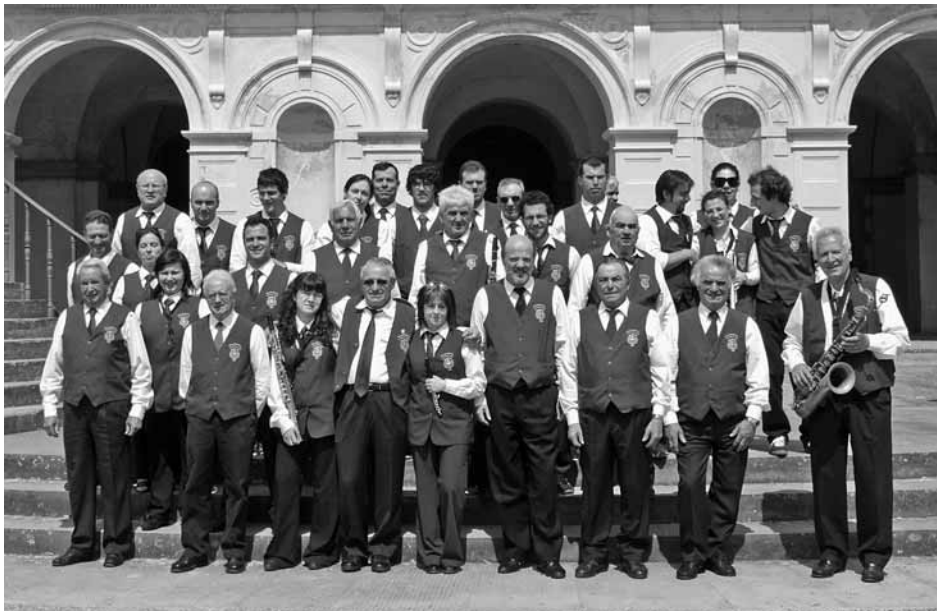
La Filarmonica "A. Catalani" di Poggio - Filicaia - Sillicano

Mi è venuto in mente, invece, di riflettere, un po' in generale, sul rapporto fra la nostra Valle e la musica. Il legame mi appare solido e coltivato: in un momento di difficoltà economiche e di calo dell'occupazione, la caratterizzazione e la ricchezza musicale della Garfagnana non accusano flessioni ma, piuttosto, si incrementano e danno luogo a veri fenomeni di partecipazione di massa. La musica, al contrario della letteratura, della pittura, della scultura e dell'architettura, pur essendo espressione conosciuta fin dai primordi dell'uomo, per valanghe di secoli non ha mai avuto un processo di storicizzazione, se non a partire dal 1700: sino a tale epoca nessuno si è