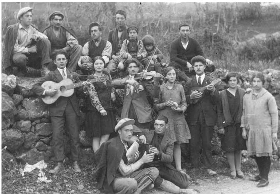
Villetta S. Romano - Una scampagnata di altri tempi a Villetta San Romano. La rara immagine scattata il 22 aprile 1928 proviene dall'archivio del nostro collaboratore Silvio Fioravanti.