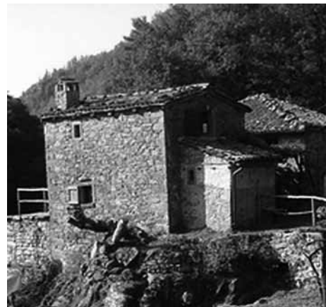
Il molino «Francesco Saverio» ancora esistente nel territorio della Roncagliana.

La memoria continuava inoltre con un dettagliato resoconto - che omettiamo per ragioni di spazio - allo scopo di dimostrare come la comunità di Castelnuovo avesse torto a non voler pagare l'imposta sui canoni riscossi, prendendo come spunto difensivo la mancata chiarezza sul valore del fondo: «Se poi la comunità di Castelnuovo