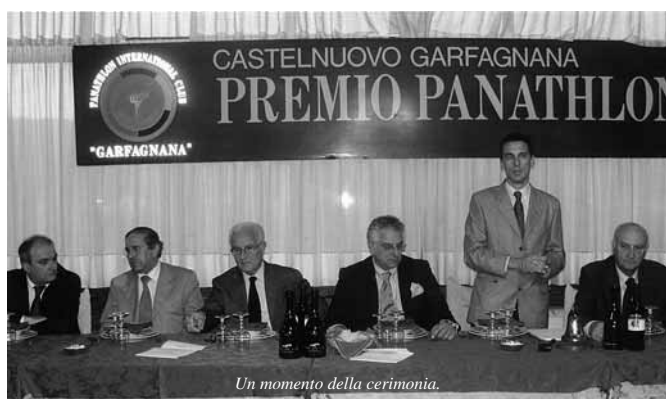
Un momento della cerimonia.

Tel. +39 0583 571712 - Fax +39 0583 950499