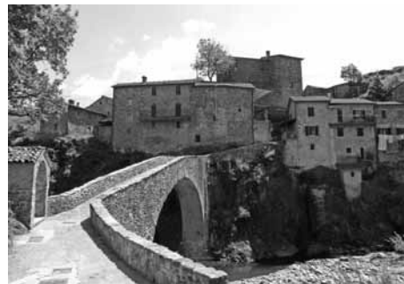
L'antico paese di San Michele con il ponte medievale sul Serchio di Gramolazzo