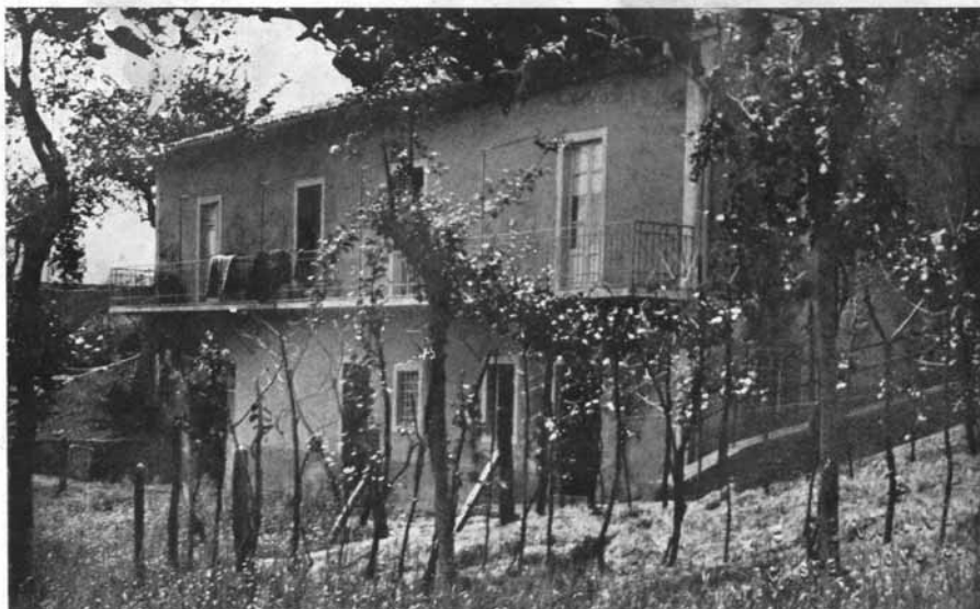
Malcantone Fortezza Montalfonso

Alcuni giorni dopo furono istituite le commissioni sani-