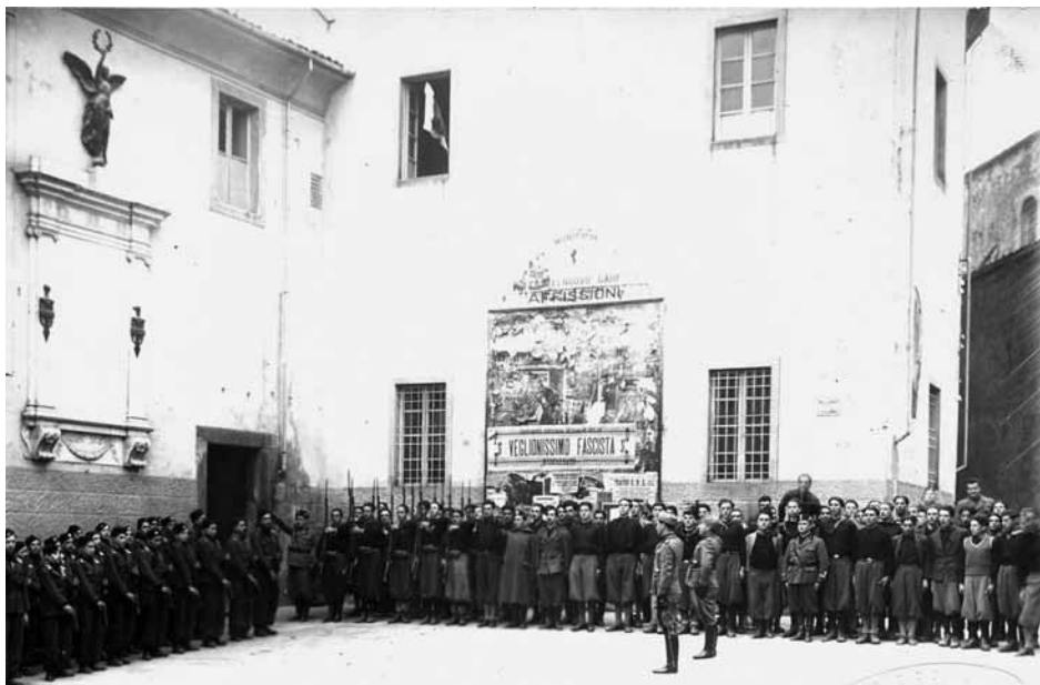
Castelnuovo di Garfagnana, primavera 1923. Cerimonia fascista in Via Olinto Dini.

Stelluccia seguiva quel gioco di luci e di ombre, muovendo agilmente le dita, intrecciando filo su filo. La fiamma guizzava ad ogni sbuffo di vento, e le "monachine Scintille del fuoco" salivano su per la cappa. Toc, toc! Qualcuno bussa alla porta! No, è il vento! Toc, toc! Qualcuno bussa davvero! No, è la pioggia che batte sui rami secchi, sui tegoli! Toc, toc! No, c'è veramente qualcuno! "Se c'è qualcuno, in questa casa, mi apra, per amor di Dio!": Che paura aveva Stelluccia, che paura! Ma non poteva lasciar fuori chi invocava aiuto per amore di Dio! Stelluccia, tremante, aperse la porta e vide un vecchio, appoggiato allo stipite, tutto bagnato, tremante di freddo e allo stremo delle forze. Stelluccia lo fece