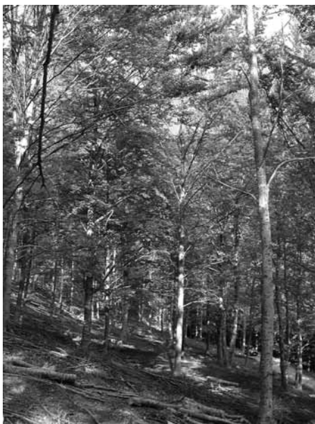
Una faggeta locale

"Si tratta di interventi che, puntando alla regolarizzazione delle strutture ed al miglioramento della funzionalità dei soprassuoli, assicurano valido accrescimento e stabilità ecologica - continua Puppa - Da evidenziare che questi popolamenti, oltre ad appartenere alla categoria dei boschi produttivi, possiedono una forte valenza protettiva. Il secondo settore di intervento è invece prettamente rivolto al potenziamento ed al miglioramento della rete