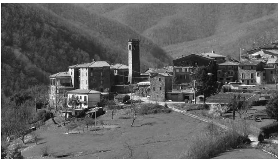
Immagine di Puglianella con il campanile, antica torre medievale.

Se nei racconti dei nonni ai nipotini Puglianella appare fondata da un Signore, o re, che veniva dalla Puglia e che aveva per moglie una certa Nella, ai grandicelli, invece, questa versione sull'origine del paese appare un