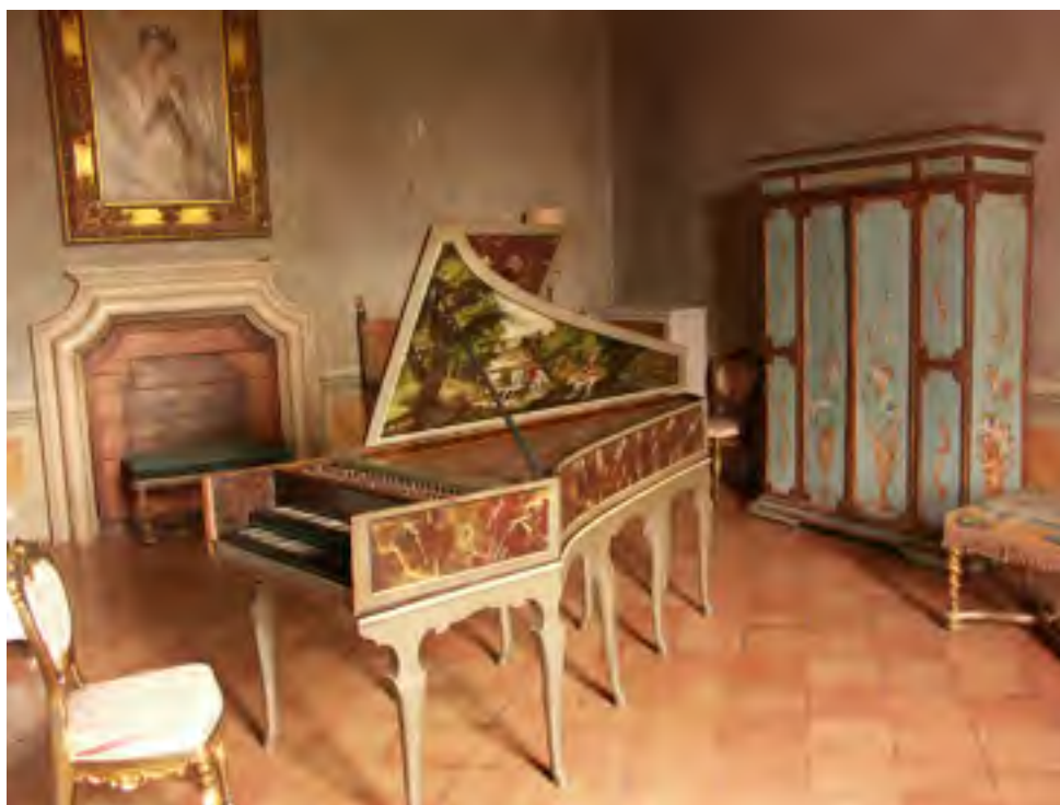
Nella foto lo strumento restaurato a Villa Medici

L'importanza che c'è lì per la musica a tutti i livelli. La musica è insegnata seriamente nelle