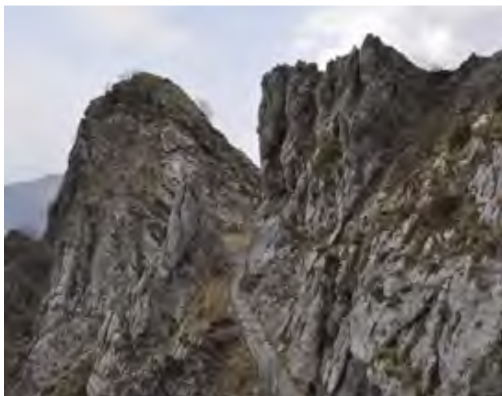
Una immagine della Via Vandelli al Passo della Tambura.

Ritenendola S.A.R. a carico dello Stato la manutenzione del tronco della Strada Vandelli da S. Pellegrino fino all'Arco e Porta di S. Lucia in