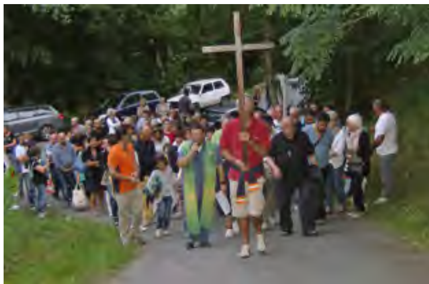
La partenza della Via Crucis verso la Rocca

A Rocca Soraggio, in comune di Sillano, a ridosso di ferragosto con le sue sagre ed il suo consumismo, è stata promossa, invece una serata di preghiera e di meditazione, alla riscoperta dei veri valori della vita. Promotori tanti giovani dell'alta Garfagnana, a cominciare da quelli della Valle di Soraggio e Sillano, sotto la guida di don Giorgio Simonetti e del parroco don Pietro Fortini, che hanno promosso lo svolgimento di una Via Crucis che si è snodata lungo la strada comunale che sale all'antica chiesa di Rocca