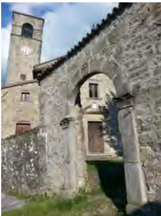
L'esterno della chiesa parrocchiale con il sagrato recintato.