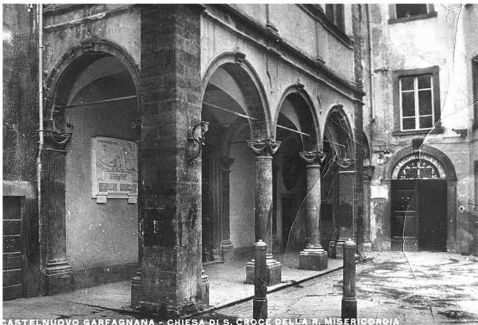
Santa Croce, una delle chiese distrutte dai bombardamenti aerei.

La maggior concentrazione di questi edifici di preghiera era limitata ad un perimetro molto ristretto del rione del Centro, dove, oltre al Duomo dei santi Pietro e Paolo, c'erano le piccole chiese di Santa Croce, del Corpus Domini, delle monache di San Bernardino, della Madonna del Rosario e del Suffragio. Le prime tre erano poste ai lati del Duomo, la quarta era invece ubicata di fronte, dove è ora funzionante il Bar del Centro, mentre l'ultima si trovava ai margini del «Chiassetto», tra il