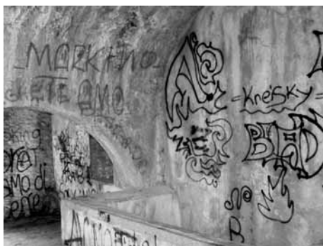
...la loggetta dentro le mura vicino alla porta Castruccio Castracani

a quel gioiello architettonico del teatro Alfieri. Poco oltre, via Marconi, dove perennemente rigogliosa la vegetazione dei muri accompagna le interminabili file di auto che transitano. Attenzione a parte merita la Rocca Ariostesca: lo stato di dissesto del portale e l'incuria dell'ingresso farebbero spendere fiumi d'inchiostro in attesa di sostituire alla perenne volontà di ristrutturazione che l'accompagna da lustri quella concretezza che lo potrebbe elevare tra i monumenti nazionali. La bella e storica fontana di Piazza Umberto, è aggredita dal sporcizia, galleggiante e non, che nessuno cura di pulire. Lo ha fatto a lungo l'amico della vicina edicola, anche lui adesso ha dovuto rassegnarsi. Chi si chiede invece che fine abbiano fatto i cassonetti dell'immondizia, possono stare tranquilli, non sono scomparsi. Continuano a fare bella mostra di sé, in quegli angoli poco appartati, a cui spesso si è discusso di porvi rimedio ma ancora niente lasciano alla più fervida immaginazione di trascuratezza e sporcizia. Arredo urbano significa anche conservare quelle cose buone che vengono svolte perseguendo l'inciviltà e i diritti altrui: come quel brando di imbecilli che hanno eletto via delle mura a loro quartiere, e dipingono la recente illuminazione con colorazioni