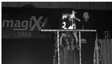
Nella foto di Mario Bonaldi un momento della festa

Già fin dal pomeriggio, con lo spettacolo dei bambini di Magico Renzo, si era intuito che sarebbe stata una giornata speciale, centinaia erano le persone che già affollavano la piazza. Magico Renzo ha così potuto entusiasmare i piccoli aprendo anche il gala serale lo spazio che avrebbe