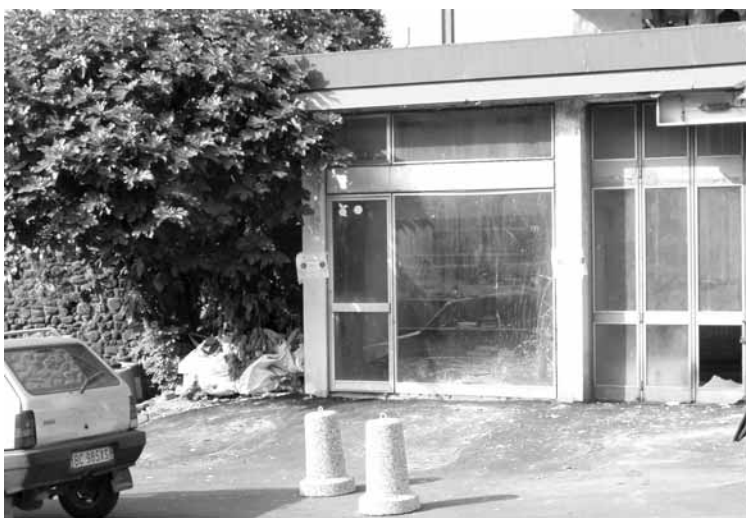
La via Roma all'ingresso del paese....

perti organici; fa poi un certo effetto appena imboccato il ponte Castruccio Castracani, vedere una discarica fognaria a cielo aperto con i suoi assidui frequentatori: sembra essere stata istituzionalizzata. E poco più avanti si apre l'immagine della trascuratezza: via XX settembre, una dedica importante e impegnativa per una via da salvaguardare in altro modo, se non altro perchè conduce