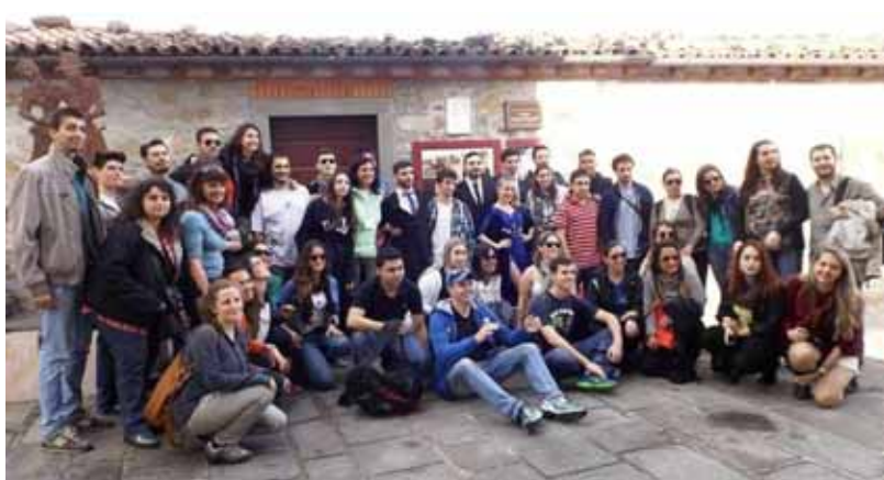
Visita a Massa Sessorosso

l'Associazione Lucchesi nel Mondo di Mar del Plata e Federacion de Asociaciones Italianas de Cordoba (FAIC) in Argentina, l'Associazione Lucchesi Toscani nel Mondo di Jacutinga e Associazione Giovani Cuori di San Paolo in Brasile e in collaborazione con il Parco Nazionale dell'Appennino Tosco Emiliano, La Regione Toscana, la Regione Emilia Romagna e altri partner europei - con il cofinanziamento dell'Unione Europea nell'ambito del Programma Erasmus + per la cooperazione all'innovazione e lo scambio di buone pratiche nel campo della gioventù. Quaranta ragazzi, discendenti di emigrati che hanno lasciato in passato i nostri paesi, sono stati selezionati per il soggiorno formativo di una settimana alla scoperta della terra dei propri antenati accompagnati da 10 giovani locali, per uno stage di formazione sul "turismo di ritorno". Provengono da due nazioni che esprimono un importante sistema di relazioni in stretta collaborazione con il progetto - Argentina e Brasile - e il dato più significativo è che un'alta percentuale