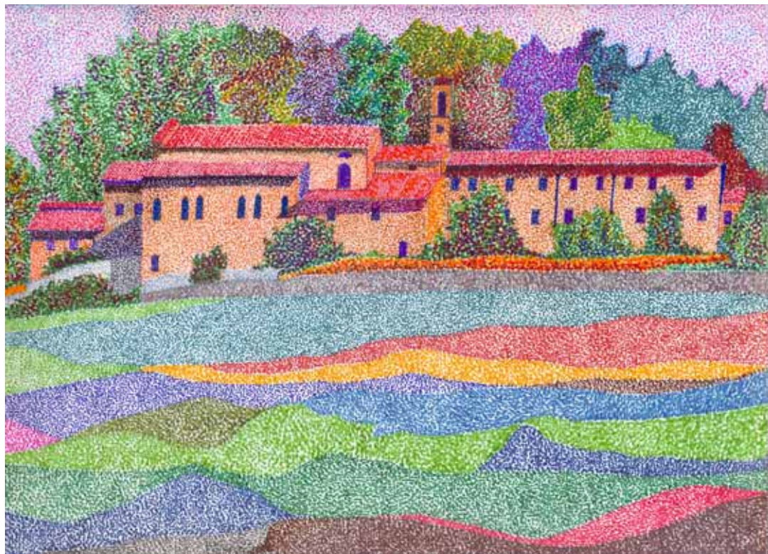
Il Convento dei Cappuccini di Castelnuovo di Garfagnana