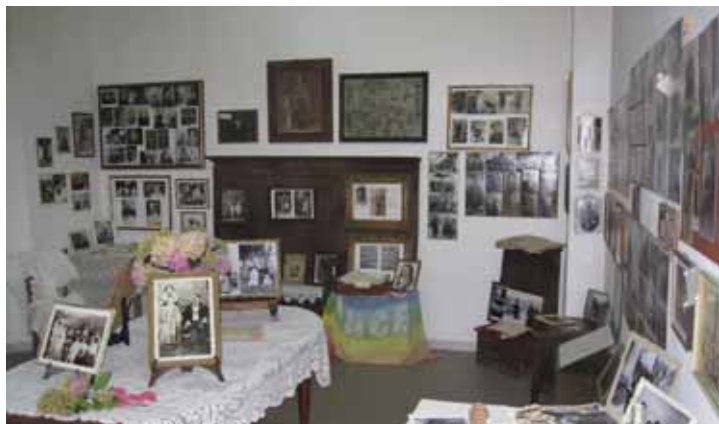
Una delle sale della mostra a Caprignana.

Tel. e Fax 0583 62943 - Email: flisuffredini@libero.it