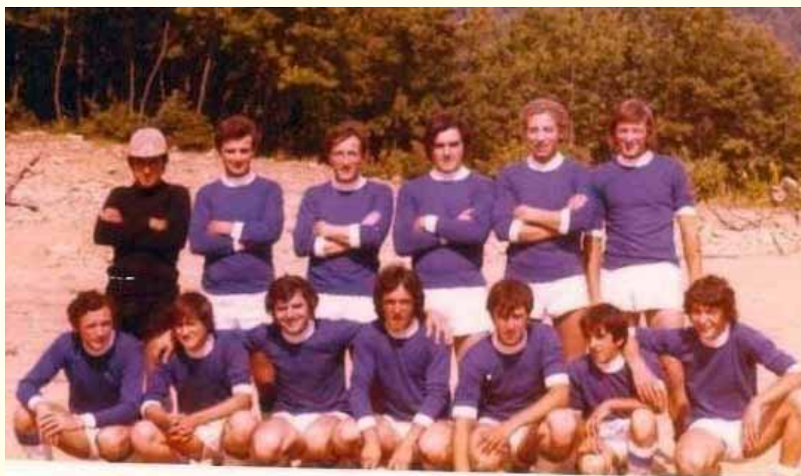
La prima partita sul campo di "Pian di Che" a Magliano

Siamo nella tarda primavera del 1972 ed il campo sportivo di Pian di Che di Magliano, lungo la strada per Pontecchio, non era ancora del tutto completato, ma incombeva l'avvio della prima edizione del torneo estivo "Comune di Giuncugnano - Trofeo Lo Scoiattolo" (poi vinto dalla squadra di Colognola) e così fu programmata un'amichevole per saggiare soprattutto il fondo non ancora seminato.