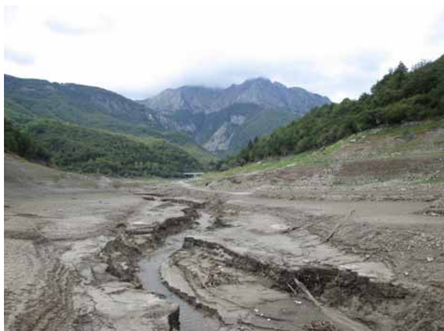
Alveo del lago di Vagli dove sorgeva Piari e probabilmente si estendeva Pugliana.

glia - Vaiano - Tribbio, che hanno spinto la popolazione a trovare rifugio in luoghi più sicuri. I toponimi Monte Castri, Castilioni e Castiglione su questo asse viario pongono degli interrogativi. Comunque sia Pugliana occupava un'area piana, un terrazzo morfologico alto sull'incassato fiume e dotato di grosse sorgenti, ai piedi di un'erta costa. Detto questo possiamo, pure, richiamare, a testimonianza del periodo romano della valle, il toponimo Conchiuso (da conclusum ) e Vicaglia, soprastante alla ricostruita posizione di Pugliana, indice dei beni comuni del vicus, occupanti il ripido pendio montano ed ancora oggi beni di uso civico. Potrei infine ricordare Capredosso, prossimo a Valpugliana, che appare come normale forma latina del 'dosso della capra' ( caprae dorsum ), se vogliamo 'colle delle capre'. Insomma una toponomastica minore che attesta l'impronta romana sul territorio, prima di 'Valli' (dell'anno 1154) e di 'Valle de Sueto'