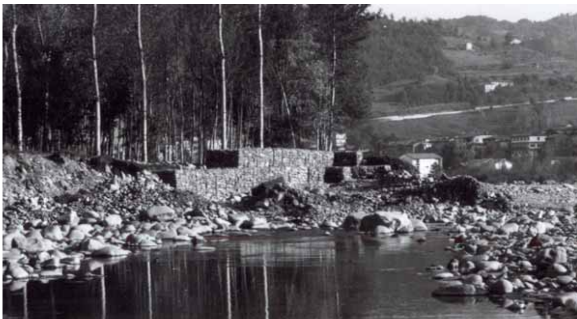
Un moderno gabbione, posto in un punto nevralgico del fiume.

Per eliminare questa incombente minaccia, furono nel tempo realizzate molte opere murarie di controllo e di difesa, ma i risultati furono