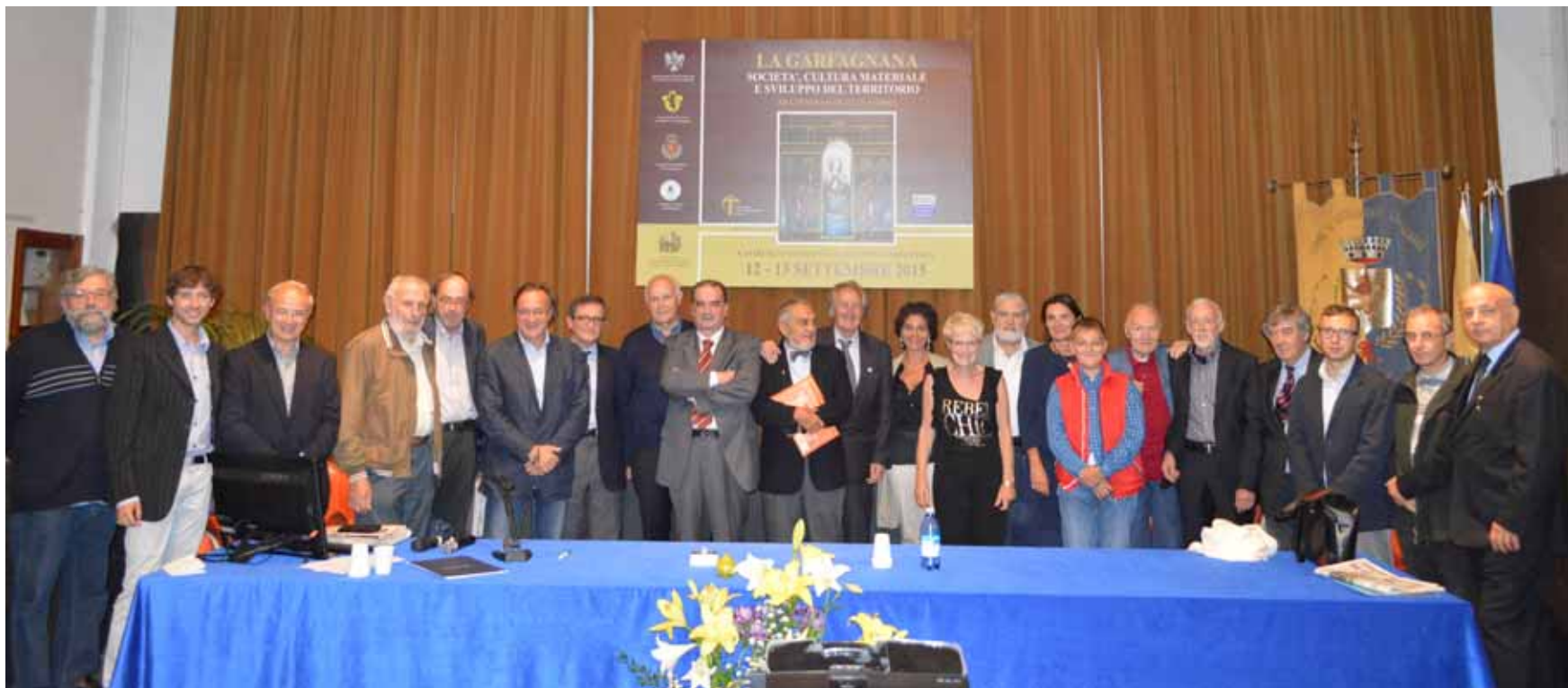
I relatori e il sindaco di Castelnuovo Tagliasacchi, a conclusione del convegno di studi.

Via Valmaira, 26 - Castelnuovo di Garf. (Lu) Tel. 0583 65679 • Fax 0583 65300 - e-mail: nikosnc@tin.it