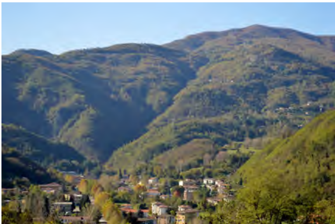
Parziale veduta del Monte Volsi.