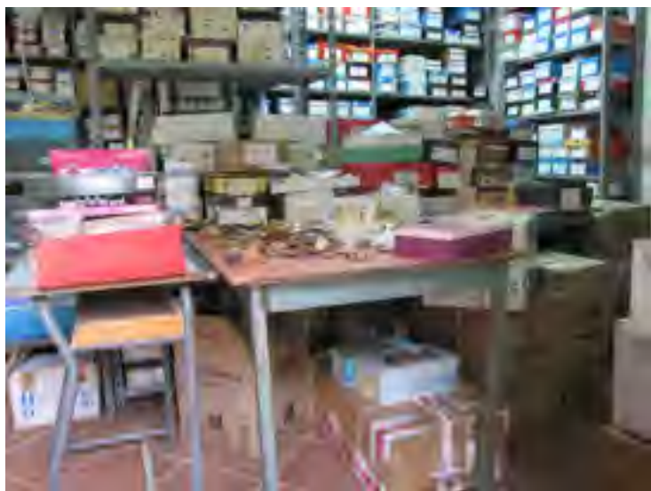
Un vero deposito (sic!): scatole, scatoloni e vecchi banchi di scuola.

CASTELNUOVO di GARFAGNANA (LU) - Via G. Marconi, 24 ☎ e Fax 0583.62049 PIEVE FOSCIANA (LU) - loc. Pantaline Tel. 0583.65678