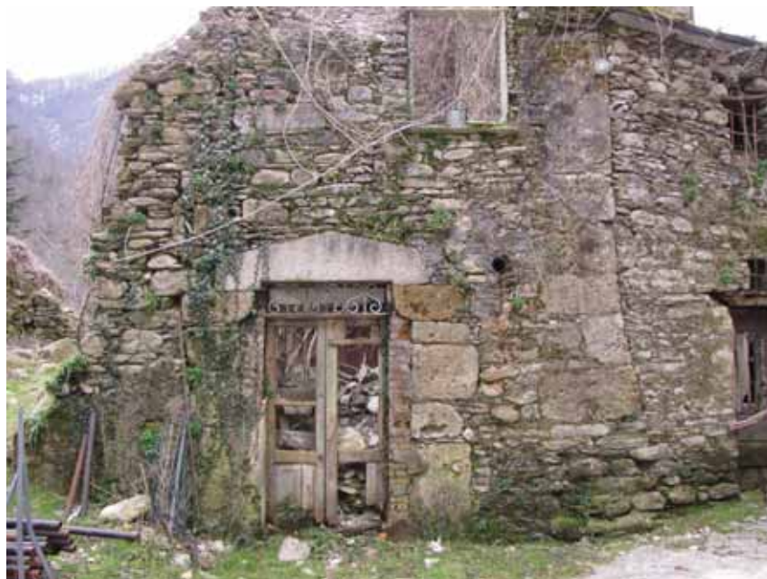
Foto 2. Rudere della casa antistante la chiesa con architrave medievale, modificato e reimpiegato.

una chiesa ed un sacro più ampi furono coinvolte anche le strutture adiacenti. Di ciò è traccia in quel particolare edificio dotato di architrave monolitico, chissà quante volte rimaneggiato, che si affaccia sulla piazza. L'architrave è certo frutto di un riadattamento della pietra a nuova epoca, essendo medievale per il profilo triangolare ma contraddistinto dalla data incisa 1579; riporta inoltre un evidente intaglio nella parte inferiore che lo ha modificato per il nuovo uso. Ne consegue che l'architrave sia probabilmente riposizionato, dopo le succitate modifiche, al momento della data che riporta. Potrebbe esser stato recuperato dalla facciata della primitiva chiesa, oppure dalla torre – di cui restano solo notizie storiche e l'intitolazione di una via (Via della torre) – in ogni modo da un edificio medievale, e riutilizzato in bella vista sulla piazza per un ingresso ad un'altezza del terreno assai inferiore rispetto a quello in uso nei tempi me-