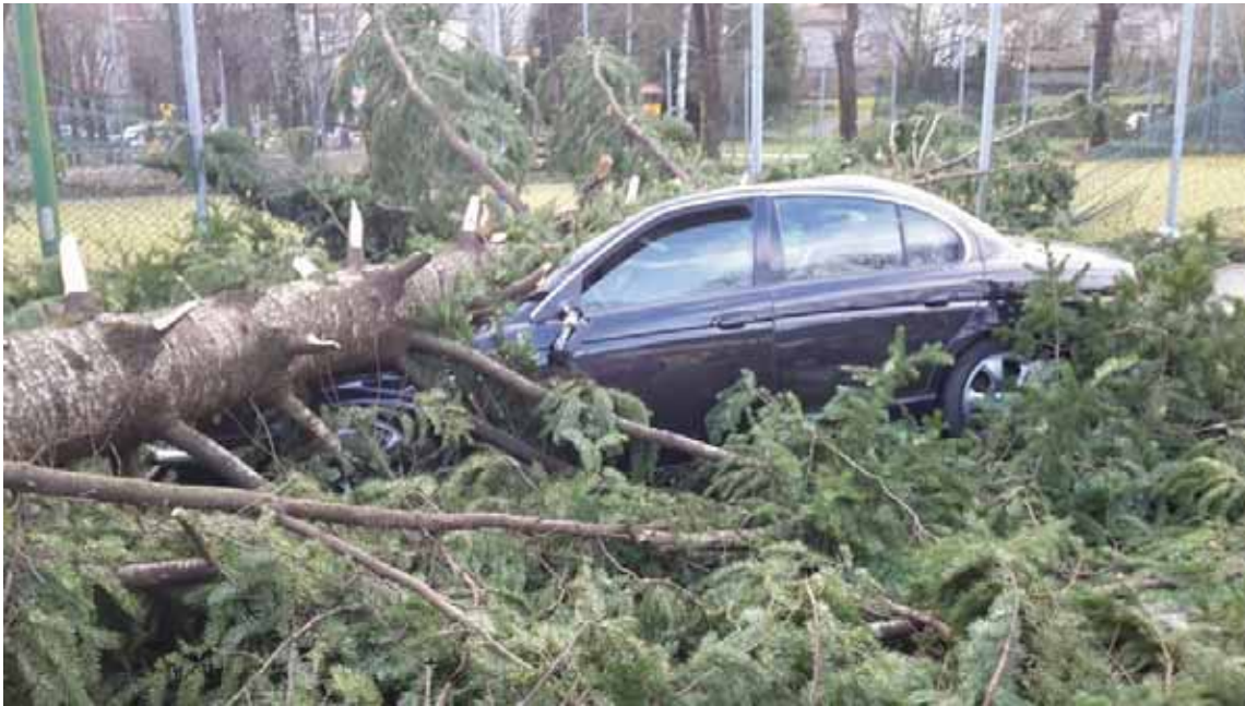
L'albero caduto su un'auto al Parco Dronero a Castelnuovo

PIAZZA AL SERCHIO (Lu) - Tel. 0583.696058