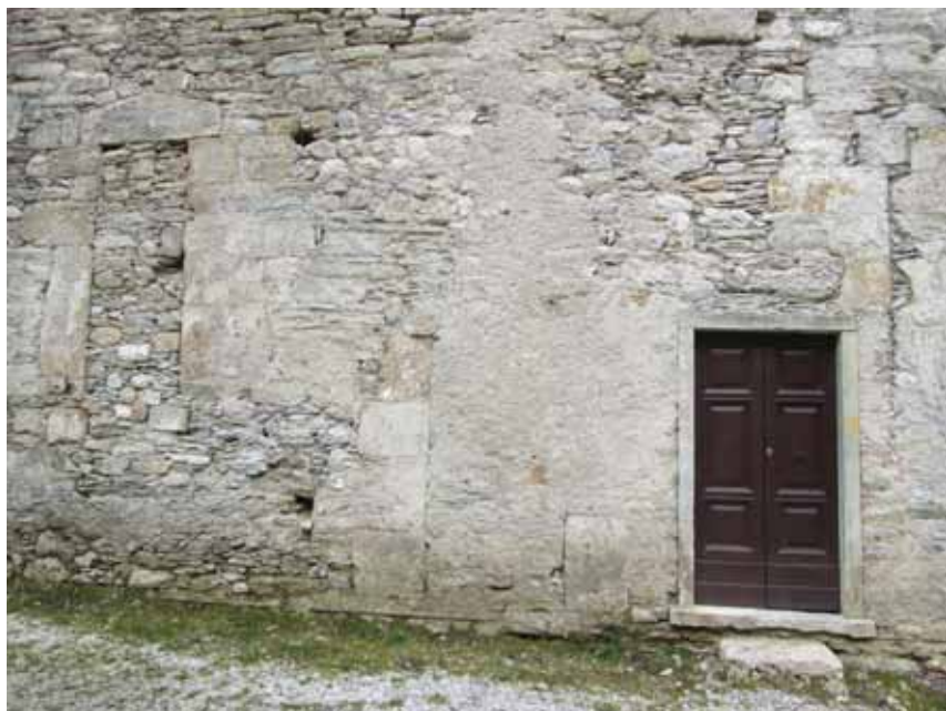
Foto 1. Sottofondazioni e soglie a vari livelli nel muro meridionale della chiesa.