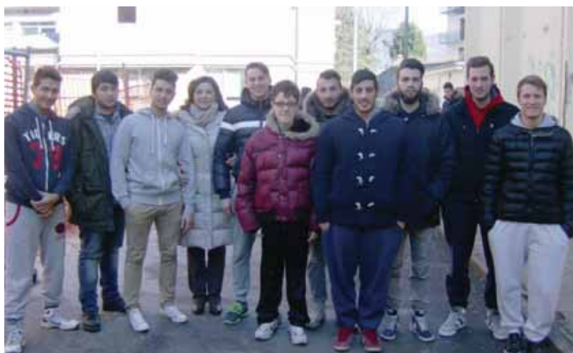
Gli alunni della quinta classe Ii

Due paesi della Garfagnana si sono fatti onore nel concorso provinciale "Il presepe più bello 2015", promosso dal quotidiano La Nazione e dall'Arcidiocesi di Lucca. Si tratta di Borsigliana di Piazza al Serchio e Chiozza di Castiglione che si sono piazzati rispettivamente al secondo e nono posto nella classifica finale. In concorso i presepi allestiti nelle due chiese parrocchiali, quella di Santa Maria Assunta di Borsigliana e San Bartolomeo di Chiozza. Borsigliana ha ottenuto 1.986 voti, attraverso l'invio dei tagliandi pubblicati ogni giorno su La Nazione, mentre