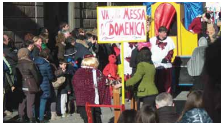
Tanta gente al Carnevale di Pieve Fosciana

La contrada del Casale ha vinto il carnevale di Pieve Fosciana 2015 al termine di una bella giornata di festa e divertimento con protagoniste tutte le storiche consorelle contrade (non rioni) pievarine: Casale (zona del Voltone, dalla chiesa parrocchiale verso Pontardeto), Sardegna (zona del Bagno), le contrade oggi riunite di Centro-Via Lunga. In palio, ogni anno, il "Pievarinello", il trofeo simbolo dell'antichissimo carnevale pievarino, risalente addirittura al 1625, assegnato da una giuria segreta. Il "Pievarinello" consiste