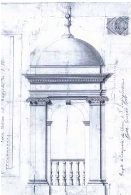
Disegno n. 1

Non sappiamo esattamente quando i lavori ebbero inizio, ma nei primi giorni di novembre 1877, a restauro quasi ultimato, il sindaco venne a sapere che il progetto da lui autorizzato era stato soltanto