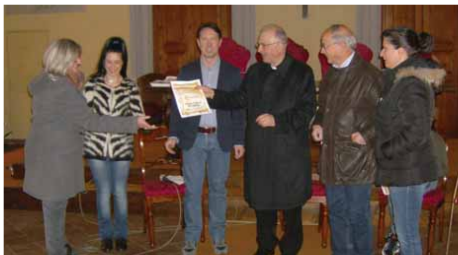
I rappresentanti di Chiozza e Borsigliana premiati dall'Arcivescovo Castellani