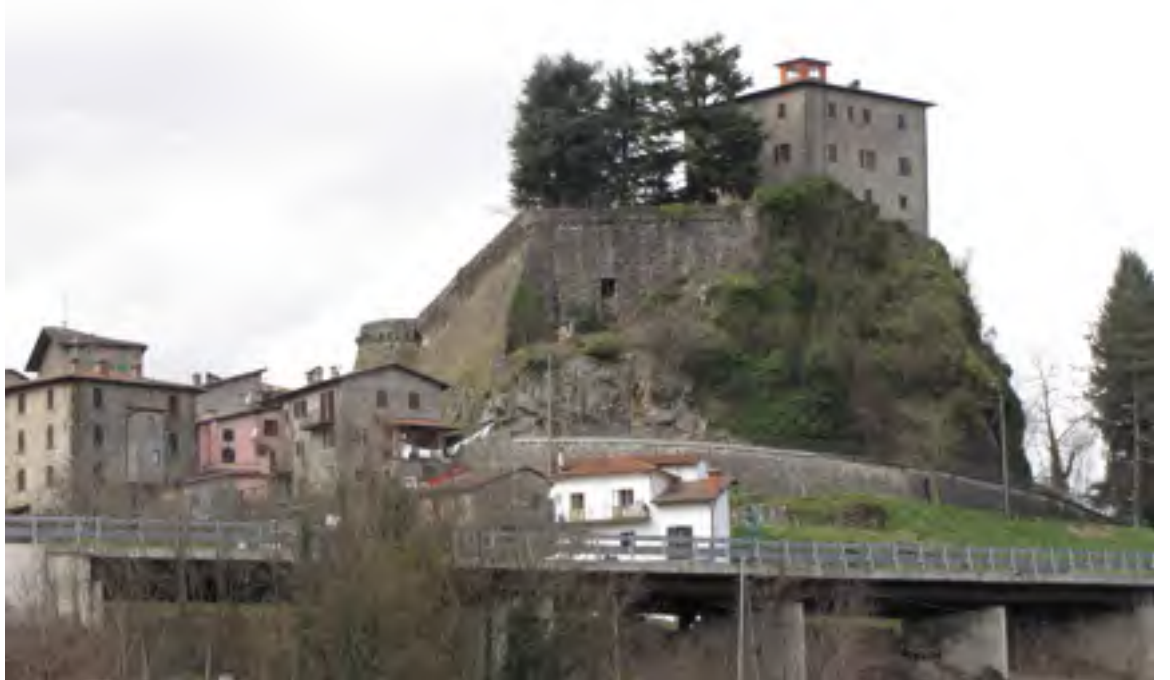
La Rocca di Camporgiano al centro, a destra Prato castello, a sinistra il Borghetto.

La toponomastica minore, ossia di luoghi secondari, ci trasmette un nome "villa". Nome quasi sconosciuto, oggi vagamente ricordato da poche persone in quanto era specificazione di un podere detto di Villa; scomparso, dunque, è in ogni modo toponimo riportato sulle carte catastali. Corrisponde alla parte settentrionale dell'area in cui è il Centro La Piana, ex-vivaio forestale che aveva occupato Le Piane, a circa un chilometro da Camporgiano. L'area delle Piane, ovviamente, poteva essere stata un buon terreno coltivabile, anche se prima della trasformazione moderna era occupata da un castagneto secolare, dove mi ricordo si teneva il "maggio". Dietro il nome Villa cosa si nasconde? Una villa rustica, ossia una fattoria romana, che il non lontano nome di un torrente (fosso di Comaiana) potrebbe ricor-