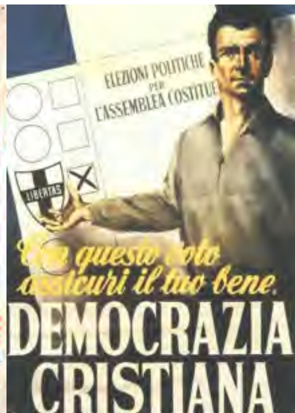
Due vecchi manifesti di propaganda elettorale

specialmente da un punto di vista economico: giovani senza prospettive, lavoratori espulsi dal loro mondo, pensionati a basso reddito, per non parlare di portatori di handicap o malattie, sentono la politica come estranea ai loro problemi ed incapace di prospettare soluzioni idonee a profondi cambiamenti. Così, ci si distacca sempre più dalle Istituzioni e dalla relativa tematica. In