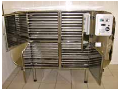
Essiccatrice di funghi

Via E. Fermi, 16 - Zona ind. - Tel. 0583 62285 (ric.aut) Fax 0583 65152 - 55032 CASTELNUOVO GARFAGNANA