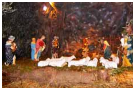
Il presepe di Migliano