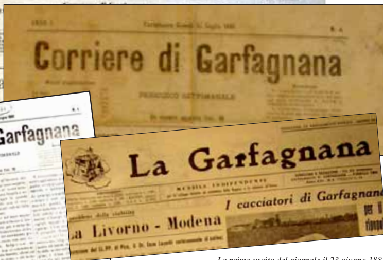
La prima uscita del giornale il 23 giugno 1881 e alcune testate del nostro giornale

avere un quadro più completo degli avvenimenti, ai fatti e alla cronaca locale. Rivisitata, alla luce di questi criteri ispiratori, anche la scansione territoriale delle pagine.