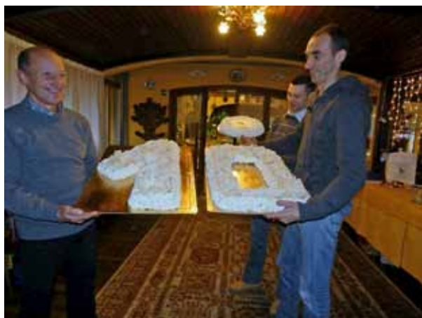
Un momento della festa

Via Pettinella - Castelnuovo di Garfagnana (Lu) Tel. 0583 62455 - Fax 0583 62943 - Email: flli.suffredini@libero.it