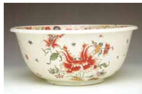
Dalla collezione "Carlino" - Raro catino Ginori, prima metà sec. XVIII, esposto nel 1998 alla mostra di Pisa "La manifattura Toscana dei Ginori Doccia, 1737-1791."