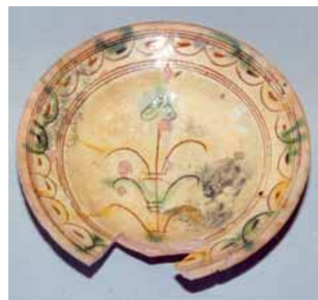
Piatto ingobbato e graffito degli inizi del XVII sec.

E' disarmante con quanta cecità di idee è stata affrontata la "guerra delle porcellane". Sono volati i piatti a destra e a manca, alla cieca, in una visione molto limitata dell'offerta fatta dalla famiglia Andreucci, come pure di quel monumento storico qual'è la Rocca ariostesca, evocatore di un passato importante. Fra l'altro l'unico monumento rimasto dei tempi antichi, destinato ad essere sede museale secondo un'idea avanzata diversi anni fa dal Circolo filatelico numismatico