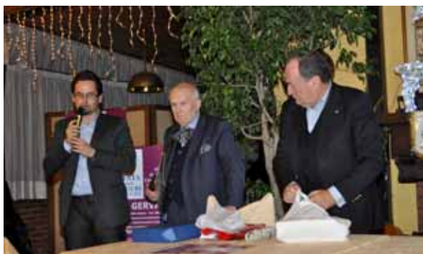
Un momento della serata

una grotta predisposta nei pressi della chiesa. A partire dalle ore 16, però, gli avventori avevano potuto degustare mondine e altri prodotti caserecci cucinati e serviti da donne e uomini del borgo, mentre i bambini, in una casetta approntata nella piazza, potevano trastullarsi con babbo natale, il quale offriva piccoli doni invitandoli a pitturare disegni e ad affidargli la letterina con le loro richieste. In paese, di fianco alla chiesa intitolata a San Martino, in una stanza della canonica oggi uti-