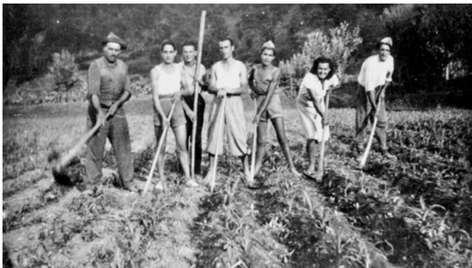
Anni '50 del secolo scorso, un gruppo di torritesi mentre sta roncando un campo di granturco.

Non era infatti difficile vedere, prima e dopo le semine, gran parte delle famiglie contadine riunirsi alla sera per recitare insieme il Santo Rosario, eseguire riti propiziatori, promettere alla Madonna astinenze e fioretti, in cambio di messi abbondanti. E se queste implorazioni rimanevano ostinatamente inascoltate, come ultimo speranzoso atto di fede, alcune comunità portavano anche in processione i santi protettori delle coltivazioni: nella comunità di Castelnuovo, per far piovere, si ricorreva a San Primitivo. E' inutile dire che uno scarso raccolto di biada rappresentava per molte famiglie un'annata di fame e la situazione si faceva ancor più grave quando anche la rimessa di castagne era carente. Purtroppo gli anni particolarmente prolifici, in cui era possibile riempire fino all'orlo gli scrigni di ogni sorta di farina, si potevano contare sulle dita, quindi le locali "deputazioni di Annona" erano costrette, quasi ogni stagione, a chiedere