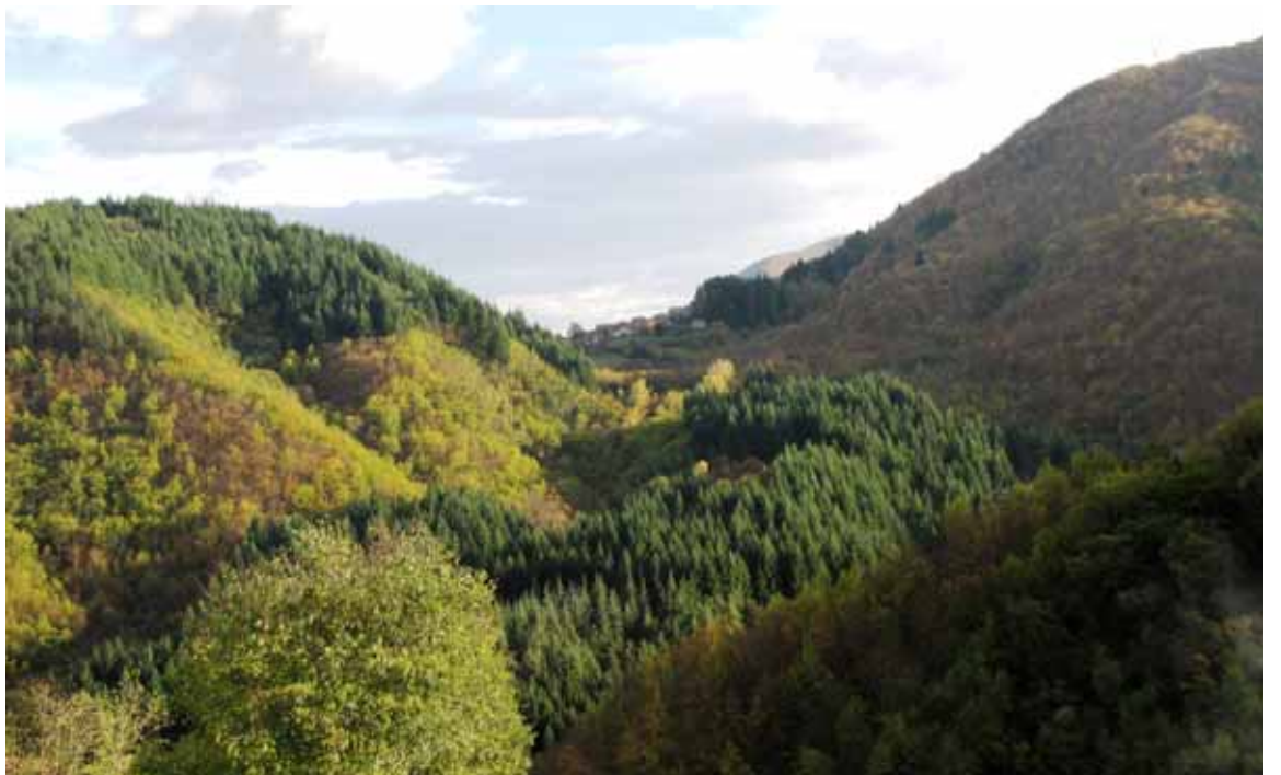
La sella fra il Monte di Casatico (a destra) e il Monte dei Venti (a sinistra), foce o 'passaggio obbligato' dell'antica viabilità.

Ho già scritto in altre occasioni della sequenza dei numerosi prediali che da Antisciana si susseguono a mezza costa fino a Galliana (località a monte del Poggio, ai piedi delle Corticchie), da dove poi si discende verso il fiume Edron