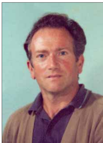
* Castelnuovo di Garfagnana 2.2.2008 - 2.2.2014