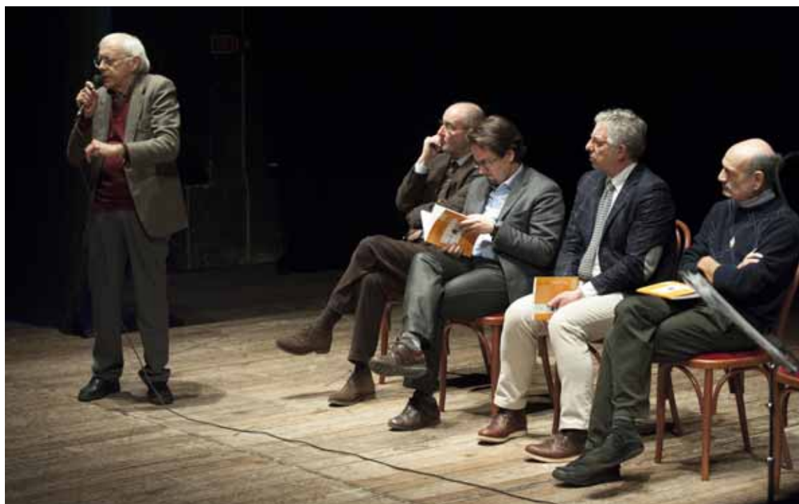
Un momento della manifestazione