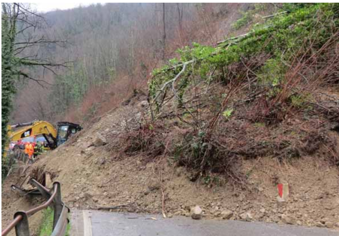
La frana sulla strada regionale 445

Oltre a diverse frane, l'evento alluvionale del 21-22 ottobre 2013, aveva prodotto pure svariati allagamenti negli abitati (San Romano in Garfagnana, Pieve Fosciana, Filicaia, Galliciano, località La Barca ecc., e perfino in alcuni negozi e alla stazione ferroviaria di Fornaci di Barga).