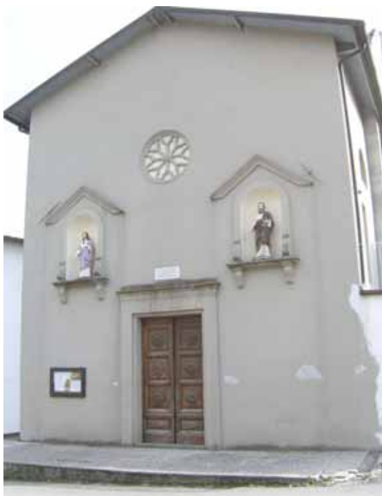
La Chiesa di Casciana