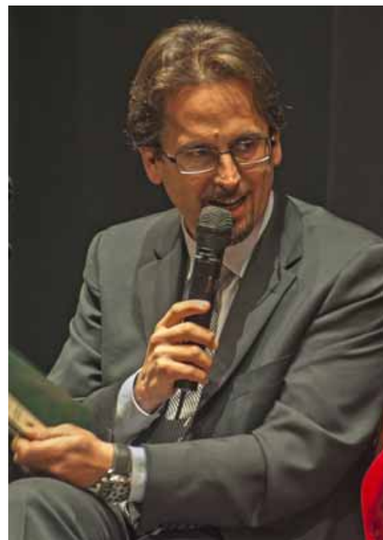
Il Presidente Mario Puppa

Il programma predisposto dall'Unione Comuni Garfagnana prevede interventi per Euro 2.143.164 tra interventi di prevenzione e di recupero. Questo lavoro di programmazione