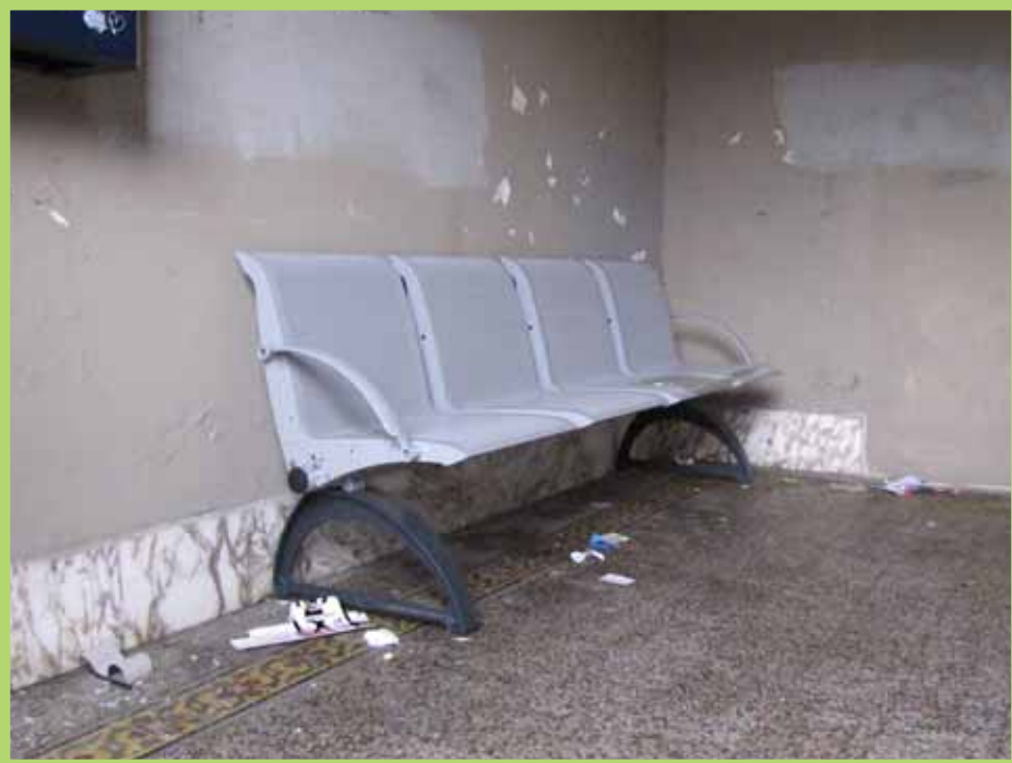
Degrado delle stazioni (Camporgiano) e... dei cittadini. Sempre la solita spazzatura.