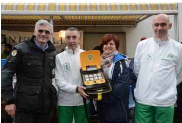
La consegna del defibrillatore