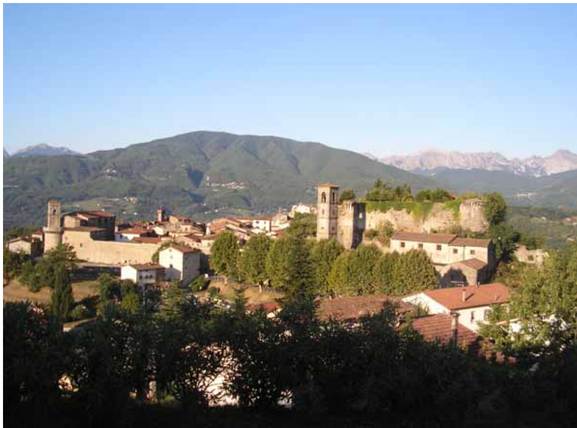
Una bella veduta di Castiglione

Un domenica pomeriggio, l'ultima di gennaio, con Castiglione protagonista su Rai 3, all'interno della trasmissione "Alle Falde del Kilimangiaro", condotta da Licia Colò e Dario Vergassola, grazie ad un bel servizio sul paese garfagnino che partecipa, in rappresentanza della Toscana, al concorso televisivo "Il Borgo dei Borghi". Occhi puntati sul televisore anche in tante parti della Lucchesia ed in particolare da parte nella case dei castiglionesi emigrati. Appena saputo che il servizio su Castiglione sarebbe andato in onda sono partiti centinaia di messaggi dai cellulari per avvisare tutti dell'evento, che veramente meritava di essere visto. Il concorso prevede per ogni puntata la partecipazione di un comune per ogni regione, tra quelli che fanno parte del Club "Uno dei Borghi più belli d'Italia". Il servizio si può vedere anche sul sito internet della trasmissione di Licia Colò: