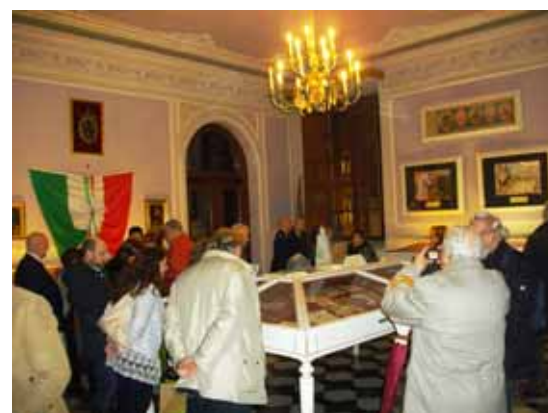
I visitatori ammirano la sezione della Garfagnana

Nell'ambito delle iniziative connesse alla commemorazione del Centenario della Grande Guerra, pianificate a livello provinciale dal Comitato per il Centenario della Prima Guerra Mondiale, costituito presso la Prefettura di Lucca e presieduto dal Prefetto Giovanna Cagliostro, è stata allestita nei locali dell'Archivio di Stato di Lucca, una importante mostra di cimeli e oggetti conservati delle famiglie lucchesi, spesso come prezioso ricordo dei loro congiunti che parteciparono alle operazioni belliche. Numerosi sono i giornali, le riviste, le lettere e le cartoline, come numerose sono le fotografie,