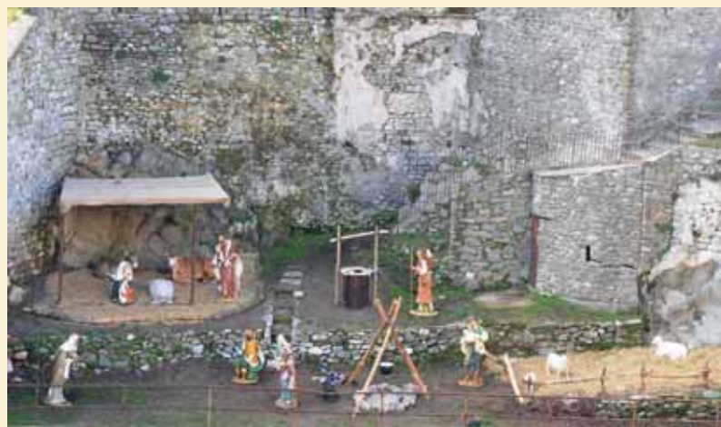
Presepio adiacente la Porta Miccia, realizzato per la prima volta dall'amministrazione comunale di Castelnuovo con l'ausilio dei "Ragazzi del Duomo"

E' un Natale difficile quest'anno, dove la civiltà, la libertà, la convivenza, la pace, dove anche le tradizioni e la nostra cultura sono messe in discussione da integralismi; vorremmo così che il nostro augurio raggiungesse tutti, nella luce della fratellanza, dell'amore al prossimo e della nostra storia.