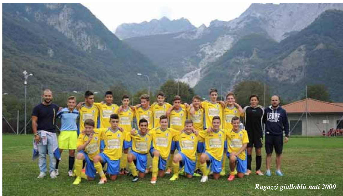
Ragazzi gialloblù nati 2000