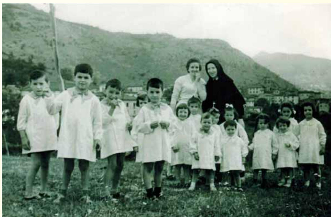
Asilo misto di Corfino - anno 1957