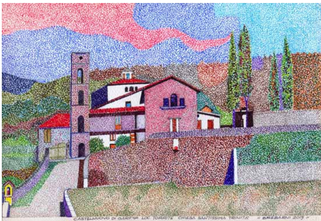
La chiesa della SS. Trinità di Torrite.