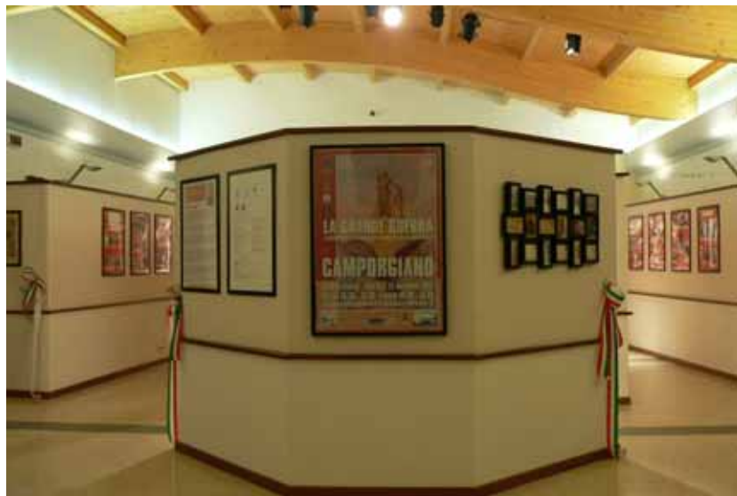
Un particolare della mostra

Tel. e Fax 0583 62943 - Email: flisuffredini@libero.it