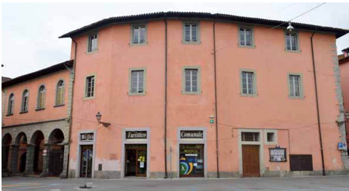
Palazzo Rocchi, attualmente sede del Municipio di Castelnuovo, visto da Piazza delle Erbe

I primi a spartirsi la casa paterna furono, nel