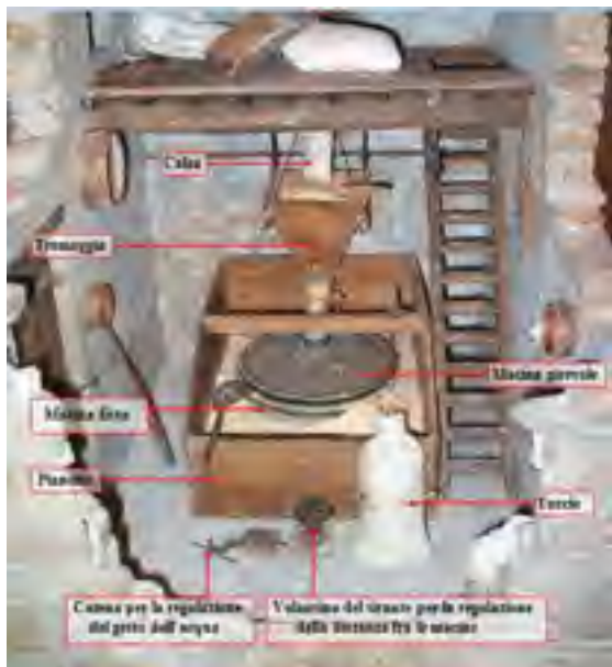
Un particolare del mulino realizzato da Emilio Lammari

Via Pettinella, 30 - Castelnuovo di Garfagnana (Lu) Tel. e Fax 0583 62943 - Email: fllisuffredini@libero.it