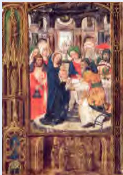
Miniatura fiamminga (1515-1520)

Davvero. E poiché il "Corriere" non va in vacanza, mai, vi aspettiamo, cari e fedeli