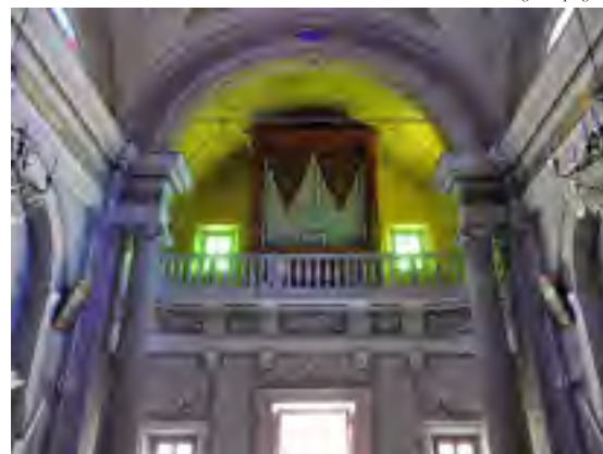
L'organo di Corfino