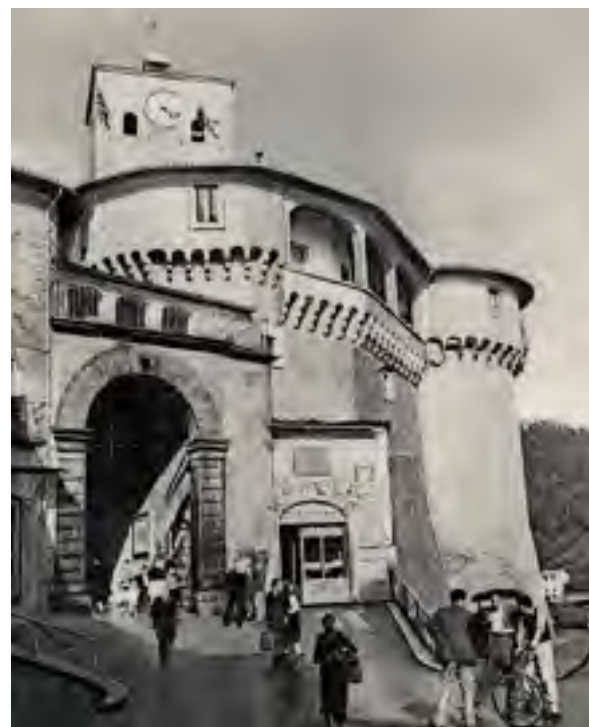
La Loggetta prima e dopo la guerra. (cartoline di Silvio Fioravanti).

la seguente notificazione emessa dal Governatore di allora: «Al fine di provvedere al Pubblico interesse tanto a riguardo della Spesa, quanto per la stabilità del Lavoro, o proprietà del medesimo si deduce a pubblica notifica come nel giorno 2 Marzo 1788 alle ore 9 antimeridiane si apporrà alla Subasta al luogo solito degli Incanti, cioè nella Loggetta davanti la cosiddetta Porta di Dentro, e si rilascerà al migliore e più vantaggioso oblatore il Lavoro del nuovo piastronato decretato farsi da questa Comunità nella strada detta del Forno, cominciando da dove termina il selciato nuovo dell'Aiottola fino al Canto, unendo fino all'altro nuovo fatto già nella Via detta Angeli, con le appresso condizioni...». Inoltre, a cominciare dai primi anni dell'Ottocento, il nostro piccolo stabile ha per lungo tempo ospitato anche la Tombola di Beneficenza, la stessa che ancora oggi viene estratta la prima domenica di settembre. A dare l'avvio a questo tradizionale passatempo fu il governa-