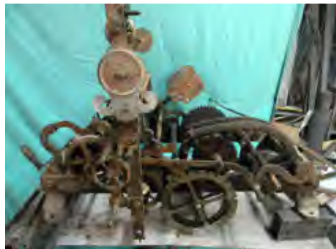
Il vecchio meccanismo a carica manuale

* A Castiglione Garfagnana è finalmente tornato in funzione l’orologio pubblico posto nella omonima torretta sopra la porta principale del paese. Dopo circa tre anni di fermo e di vari tentativi per la riattivazione del vecchio meccanismo