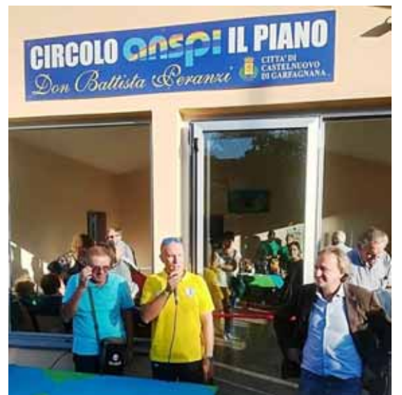
Un momento della cerimonia sul Piano