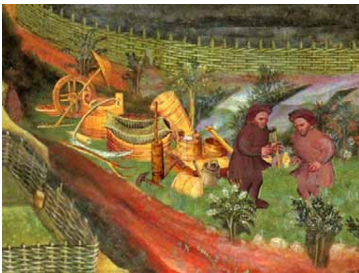
Graticci da un affresco medievale della Torre dell'Aquila di Trento

Pensando ai tempi moderni, in cui per salvarci da istrici, tassi, cinghiali, caprioli e cervi bisogna recingere i terreni coltivati, appare evidente l'analogia con ciò che si osserva nei dipinti o nei cicli dei mesi medievali, la presenza di quelle siepi morte, fatte di rami intrecciati. Ciò vale a dire che nel passato, come nel presente, non vi poteva essere orto o seminativo se non adeguatamente protetto. I rami giovani potevano anche servire a fare graticci per separare nella stalla i vari animali, oppure a fare pareti per una intonatura d'argilla che si stendeva sull'intelaiatura lignea, e in tempi più moderni pure utilizzata a supporto di un intonaco di calce. Come per i pollai non era facile tener lontani fegonchi, bellere, faine, gocette e volpi così nel coltivo non era facile tener lontani cani, maiali, pecore, vacche e capre, nonché gli erbivori selvatici di cui sopra. Da tutto ciò l'importanza delle selve per verghe, varie volte ricordate nei documenti medievali per la loro specificità insieme al "vergario" che doveva essere un luogo recintato. Per quanto ne so oltre alla Vergaia di Careggine, vi è un Vergaiolo in quel di Roggio, una Vergarola a San Romano, una Vergaia in quel di Casatico e di San Donnino; altre se ne trovano nelle carte catastali, cui si possono aggiungere