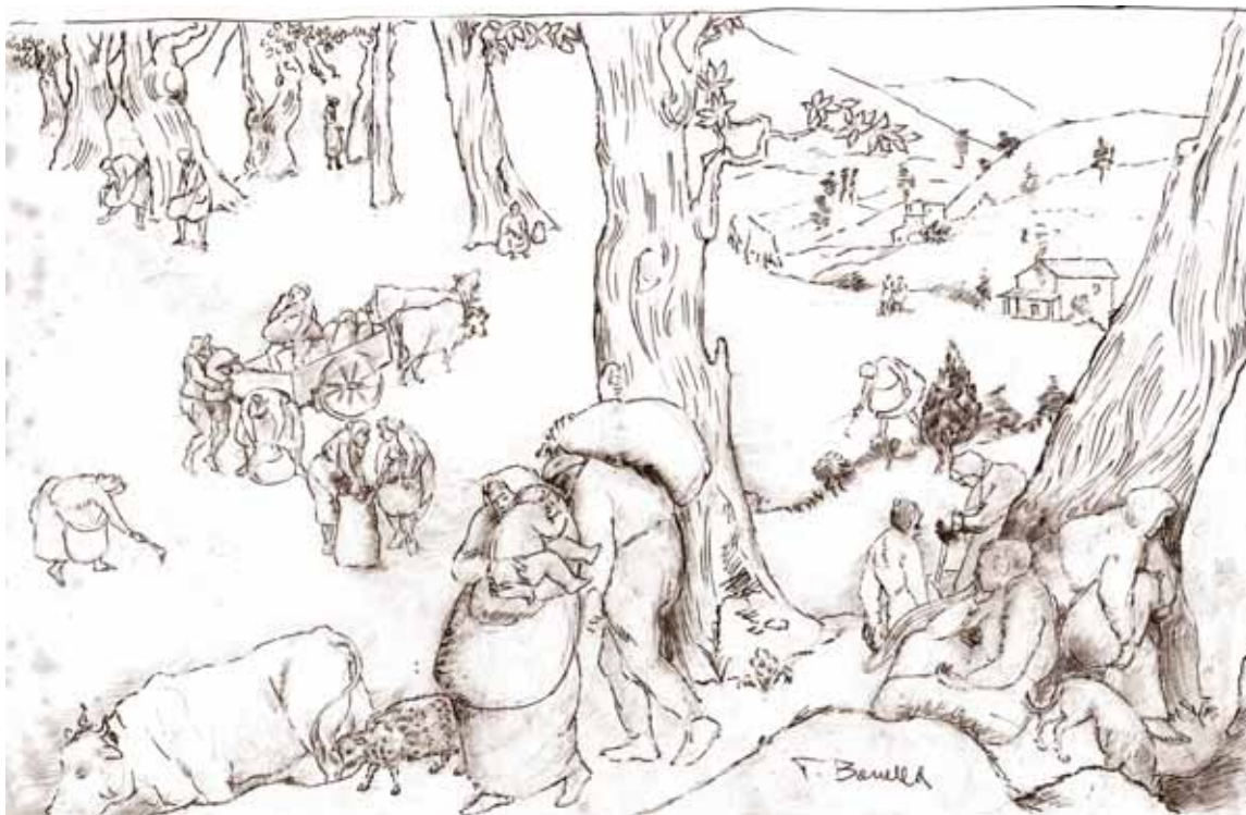
La raccolta delle castagne, da un disegno dell'artista castelnuovese Pellegrino Banella

I più timorosi di essi si accontentavano di una «borsatella» di castagne al giorno, magari raccogliendo soltanto quelle cadute lungo le strade comunali, che di fatto non avevano proprietari. Poi c'erano quelli che non si peritavano a raggiungere le selve più volte al giorno, scegliendo sfacciatamente le migliori castagne. Infine non