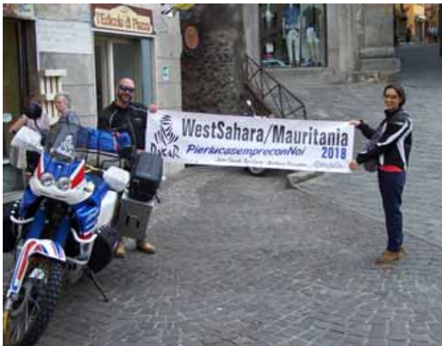
Partenza da Piazza Umberto

nell'Atlante alle dune colore oro, l'ingresso nel deserto quando sparisce la pista sotto le gomme ed inizia la sabbia.