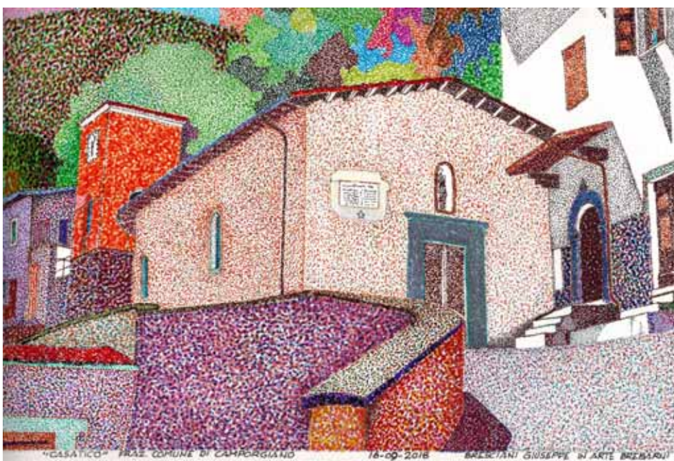
Particolare di Casatico (comune di Camporgiano).