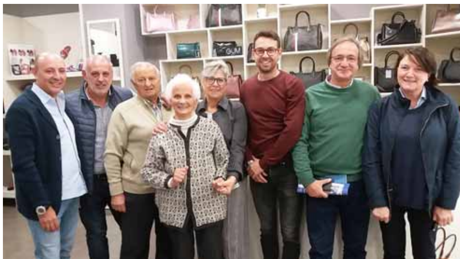
I Tortelli con le autorità

e rispetto il sacrificio e la tenacia dei giovani soldati garfagnini che, senza una specifica preparazione militare, misero a repentaglio la propria vita dando grandi esempi di lealtà, generosità e amor di Patria.