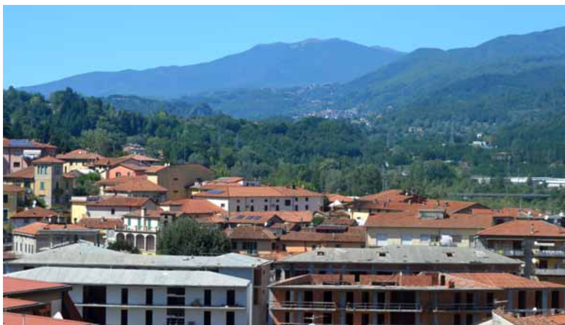
Veduta parziale degli edifici costruiti nell'area ex Valserchio