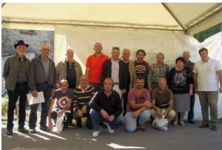
I protagonisti della manifestazione

Domenica 14 ottobre a Castiglione u.s., in una splendida giornata autunnale, si è svolta la tradizionale fiera delle vacche. Gli allevatori hanno portato in mostra i loro animali che oltre ad essere apprezzati dai numerosi visitatori, sono stati valutati da una speciale commissione di esperti del settore che ha assegnato i premi per tipologia di bovini. Nonostante le difficoltà economiche ed organizzative, questa manifestazione, patrocinata dal Comune resiste nel tempo per valorizzare un settore che riveste particolare