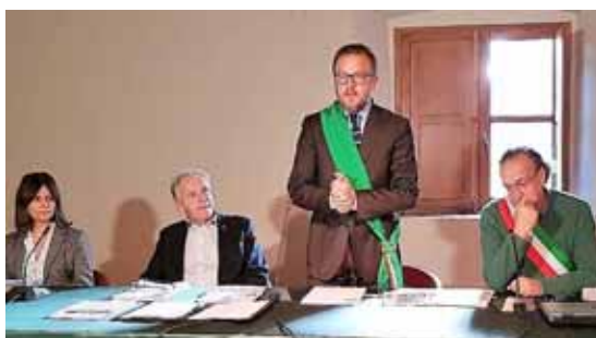
Tavolo delle autorità

Il progetto, di cui l'Unione Comuni Garfagnana è capofila, coinvolge le Unioni Comuni della Lunigiana, Media Valle del Serchio e Appennino