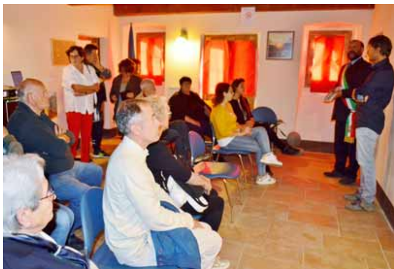
Un momento della presentazione nel Palazzo Roni di Vergemoli