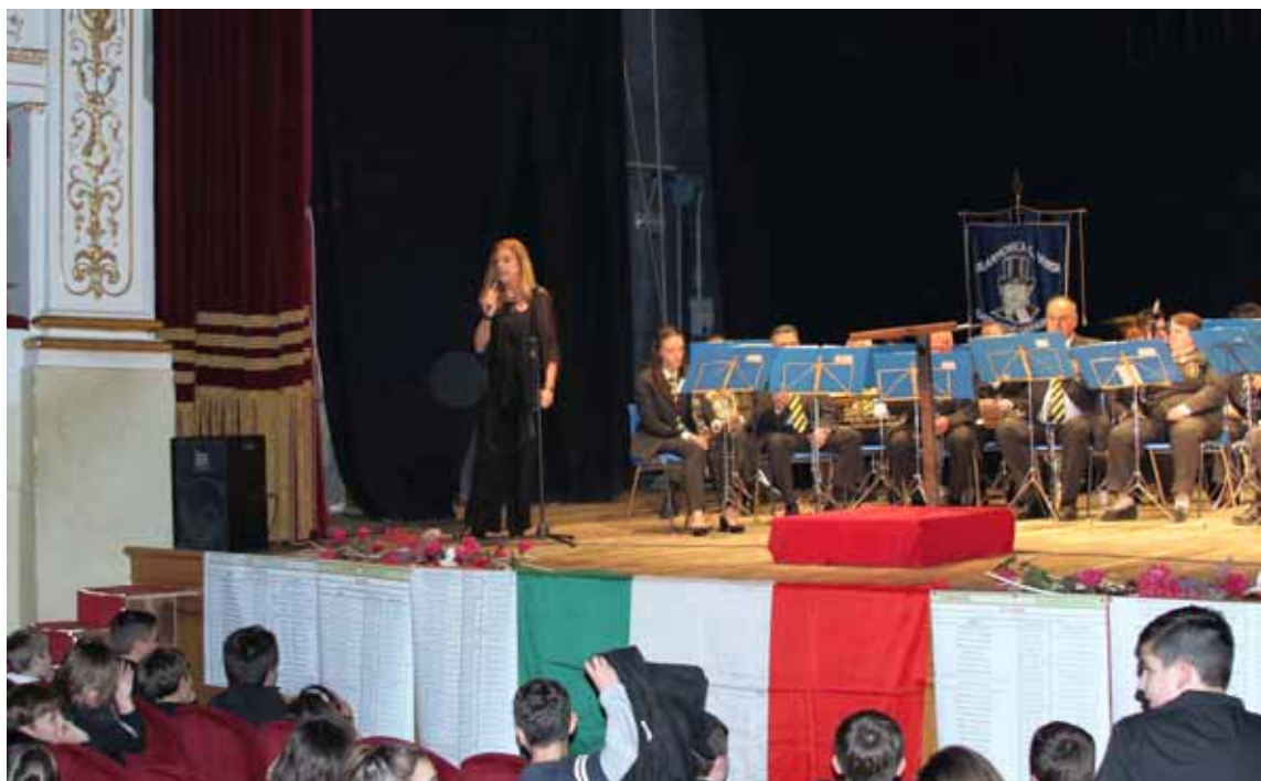
Un momento del concerto

Via F. Azzi, 7/D - 55032 CASTELNUOVO di GARF. (Lu) Tel. + 39 0583.62169 - Cell: +39 328 9834311 - E-mail: orsettibrunello@tin.it www.ilparcoimmobiliare.it www.houseingarfagnana.com