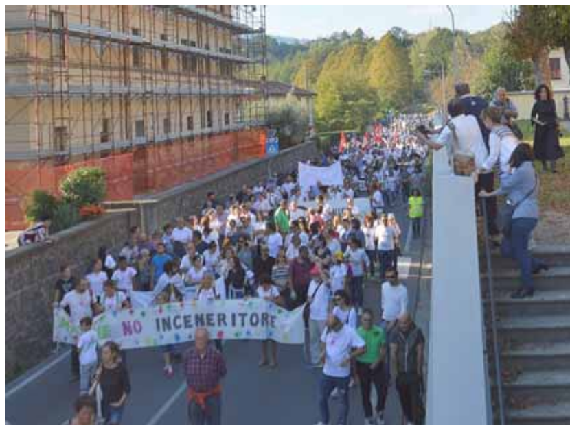
Il corteo sfilava in Via della Repubblica a Fornaci

ciazione Medici per l'Ambiente ISDE Italia; Potere al Popolo; Movimento 5 Stelle; Casa Pound; Lega Montagne Pistoiesi; Rifondazione Comunista; Confederazione Unitaria di Base Toscana; Fratelli d'Italia; Partito Comunista Italiano... e, di sicuro, anche altre realtà politiche e sociali.