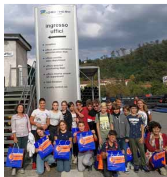
Alunni della III B davanti alla Idroterm a Castelnuovo