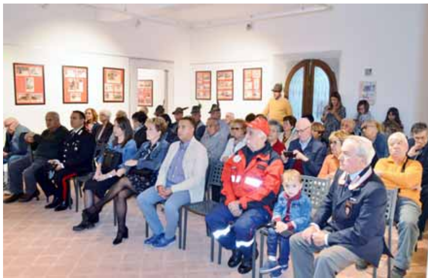
Il pubblico nel giorno dell'inaugurazione