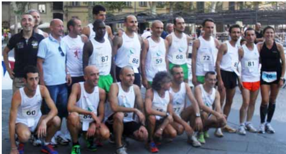
La squadra del Gp Parco Apuane