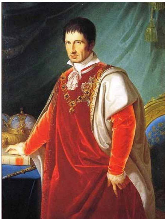
Il duca Francesco IV in un ritratto di Adeodato Malatesta

Non appena infatti il Duca manifestava l'intenzione «di voler graziosamente recarsi in Garfagnana», il governatore pro tempore immediatamente inviava precisi ordini al podestà di Castelnuovo e a tutti i sindaci della provincia, al fine di realizzare un programma d'accoglienza degna di «cotale Personaggio». Il cerimoniale imposto era quasi sempre lo stesso: manifestazioni di giubilo e di sudditanza da parte della popolazione; generale suono delle campane per annunciare l'arrivo del nobile personaggio nel nostro territorio; improvvisati archi di trionfo lungo tutto il cammino con insegne araldiche del Sovrano; spari di cannone al giungere del Duca a Castelnuovo, dove era ricevuto dal suono della Banda Civica, da un picchetto d'onore e dalle massime autorità civili e militari. Poi queste ultime, dopo un breve discorso di benvenuto, conducevano Sua Altezza a visitare la Città «perfettamente illuminata da torce e cera e resa ben decorata, brillante e ordinata dai cittadini». Il mattino dopo era il momento delle udienze in Rocca, dove Francesco IV si degnava di ricevere le delegazioni provinciali, comunali e i privati cittadini. Dopodiché, «nell'ora più propizia al