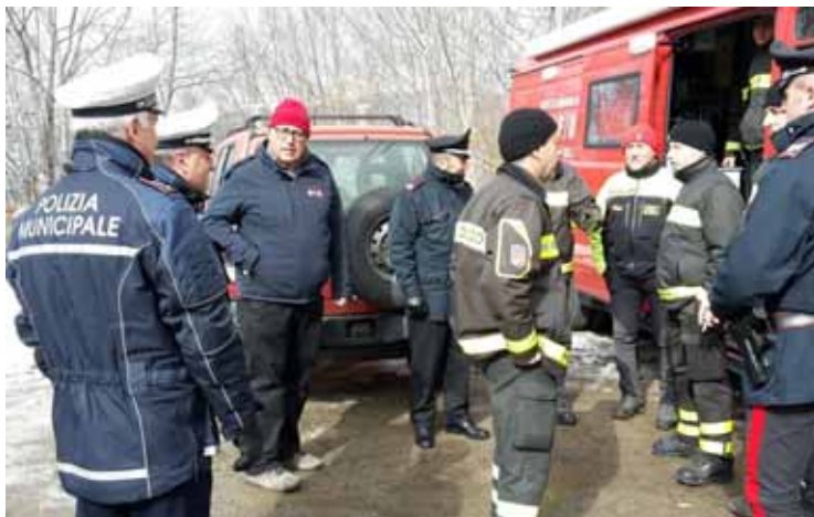
Volontari squadre di soccorso in attività