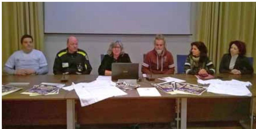
Presentazione a Castelnuovo del Progetto Araliya

Tel. 0585 93218 - Cell. 347 5226337 begmarmi@libero.it