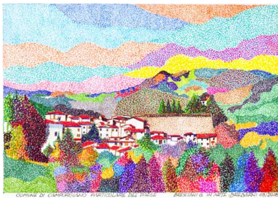
Camporgiano: particolare del paese con la Rocca.