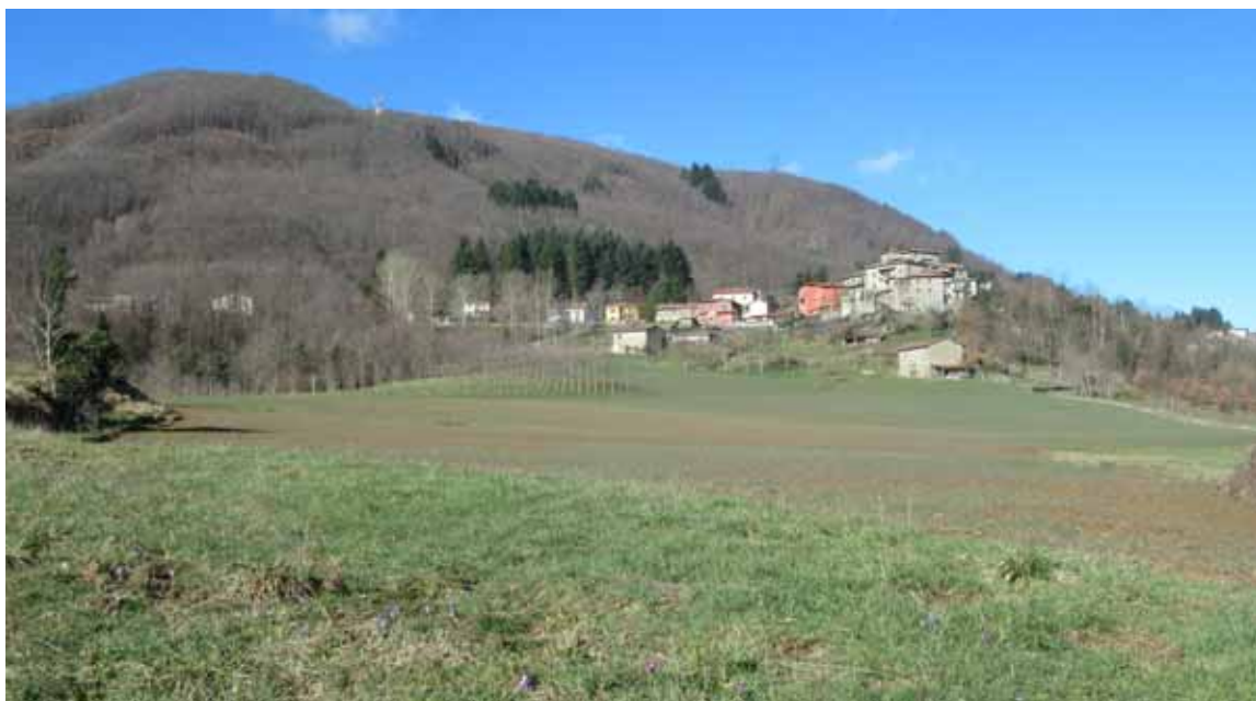
I campi arati di Eria e il paese di Vitoio

riale dei beni di Toto, dati in dotazione alla sua chiesa. Per il momento mi basta aver riportato l'attenzione su un luogo dove i Longobardi avevano posto buone radici. Illustrata la topografia dell'area (Vitoio, Novellito, Mato), inserendo pure nel breve elenco Carfaniana , – curtis che era venuta in possesso del marchese Adalberto di Toscana e che Roccalberti potrebbe in qualche modo ricordare, qualora interpretassimo il toponimo come Rocca di Adalberto – richiamo la parola longobarda «harja» che vuol dire esercito e che ritengo sia all'origine di Eria. In questo luogo poteva esservi stato il campo militare dei Longobardi che avevano occupato la Garfagnana impossessandosi di quel 'Castello di Carfaniana', centro militare ed amministrativo dell'alta Garfagnana, già ritenuto bizantino, del quale si sono più volte interessati gli studiosi dell'altomedioevo. La posizione di Eria mi fa credere che in fin dei conti alcune condizioni per ospitarvi gli exercitalis longobardi, o "arimanni" (uomini dell'esercito), vi potevano essere. In primis la vicinanza a Carfaniana – la cui posizione è ignota e 'oscillante' a seconda degli storici, ma per quanto detto riguardo a Roccalberti e per quanto altro si potrebbe arguire da altri dati, come la corrispondenza fra le terre