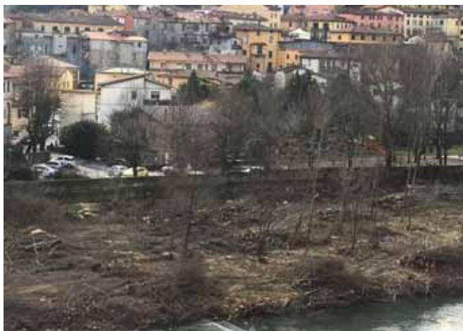
Taglio degli alberi sulla sponda destra del Serchio

* Utili i lavori di pulitura dell'alveo del Serchio Sono stati apprezzati i lavori di pulitura dell'alveo del Serchio a Castelnuovo. Grazie a potenti