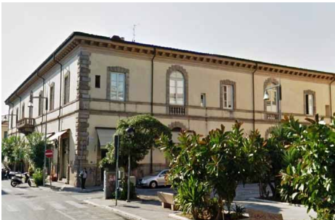
L'ospizio marino Umberto I di Viareggio che, nel 1878, ospitò per la prima volta i poverissimi fanciulli castelnuovesi.

A favore dei bagni di mare, per prevenire e facilitare la guarigione della suddetta malattia ed altre collaterali, si erano già espressi illustri medici fin dalla seconda metà del '700, ma come tutti sanno, fu soltanto nei primi anni del secolo successivo che, sulle aree costiere, da sempre in degradato abbandono, iniziarono a sorgere i primi ospizi marini, e parallelamente anche confortevoli villini per il turismo balneare. Ad accogliere in Toscana questo tipo di strutture sanitarie, fu per primo il litorale viareggino, su iniziativa degli ospedali di Lucca e del Comitato fiorentino. Ma se i regnanti di Lucca e Firenze