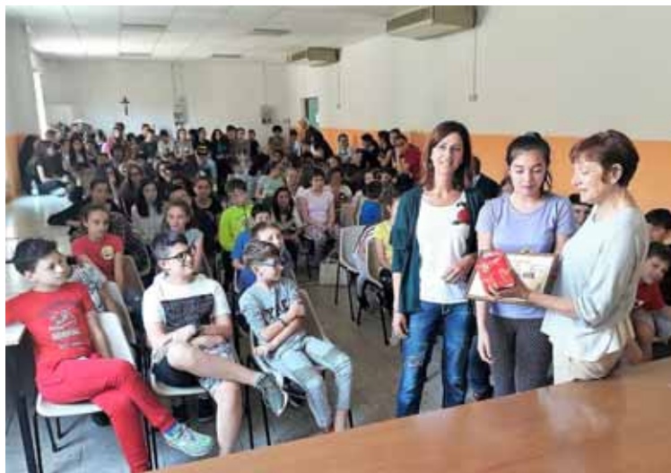
Premiazione presso la Scuola Media di Castelnuovo