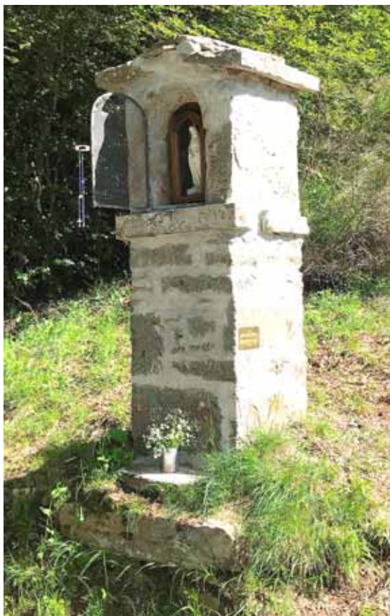
Maestaina della Madonna della Foresta nei pressi di San Pellegrino in Alpe sulla via per Col Maschio.

Anche nel 2018, l’Associazione Amici del Castagno di Pratofosco, sorta nel 2015 per la valorizzazione culturale, ambientale e naturalistica del territorio di Castiglione, ha effettuato diversi interventi grazie all’impegno dei soci che hanno raggiunto il numero di 50. Il primo intervento ha riguardato l’adozione del caratteristico Leccio della Torricella a Castiglione, di interesse sia per la sua posizione panoramica sia per il fatto che ai suoi piedi avviene la seconda caduta del Cristo durante la tradizionale processione de “I Crocioni” che si tiene il giovedì santo. L’albero è stato sottoposto, da parte di esperti, ad interventi di potatura per l’asportazione di diffuse parti secche ed ad un riequilibrio della chioma. Sono state poi eseguite opere di manutenzione alla