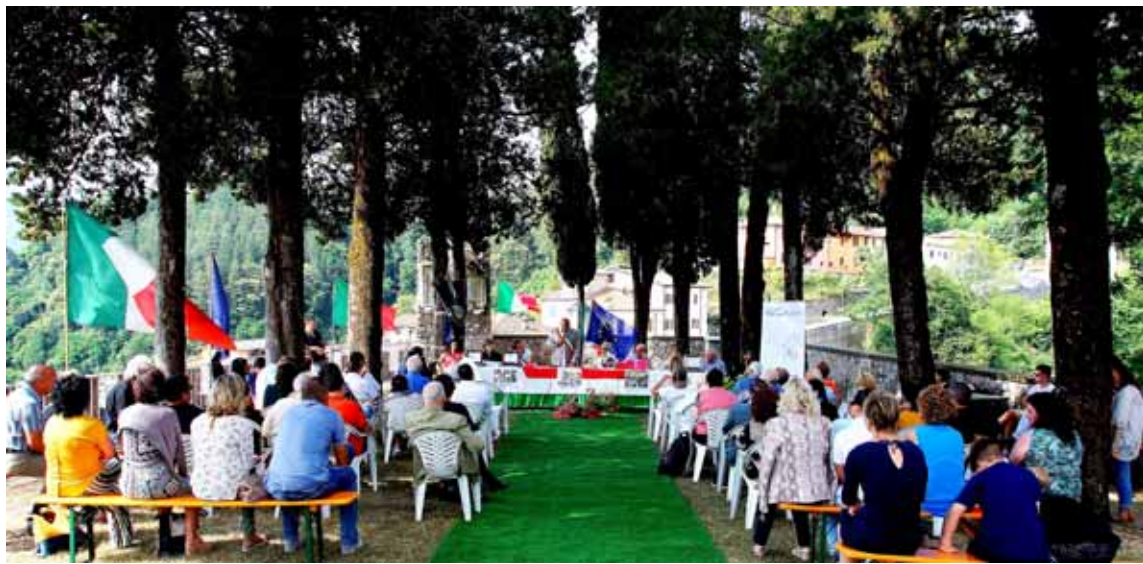
Un momento della premiazione dei vincitori del "Pania"

Tel. 0585 93218 - Cell. 347 5226337 begmarmi@libero.it