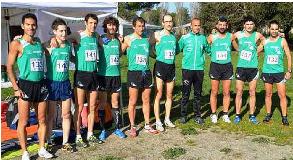
Formazione del Gp Parco Alpi Apuane