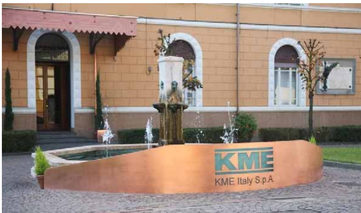
Lo stabilimento KME di Fornaci di Barga

E' doveroso tornare a parlare del progetto di costruire un pirogassificatore a Fornaci di Barga, anche se l'ubicazione non è su terra garfagnina è pur vero che i garfagnini, condannati da una morfologia ingenerosa, ne respireranno le eventuali emissioni. Il pirogassificatore, come ho spiegato in un articolo di qualche mese fa, è una specie di inceneritore che dovrebbe trasformare i rifiuti in energia elettrica, e ciò dovrebbe avvenire a temperature talmente elevate da scongiurare ogni tipo di inquinamento. Ovviamente così ci dicono, ma gli esperti, contattati da comitati formati nella zona, sono molto scettici sul punto. Questo progetto è stato ideato dalla ditta KME,