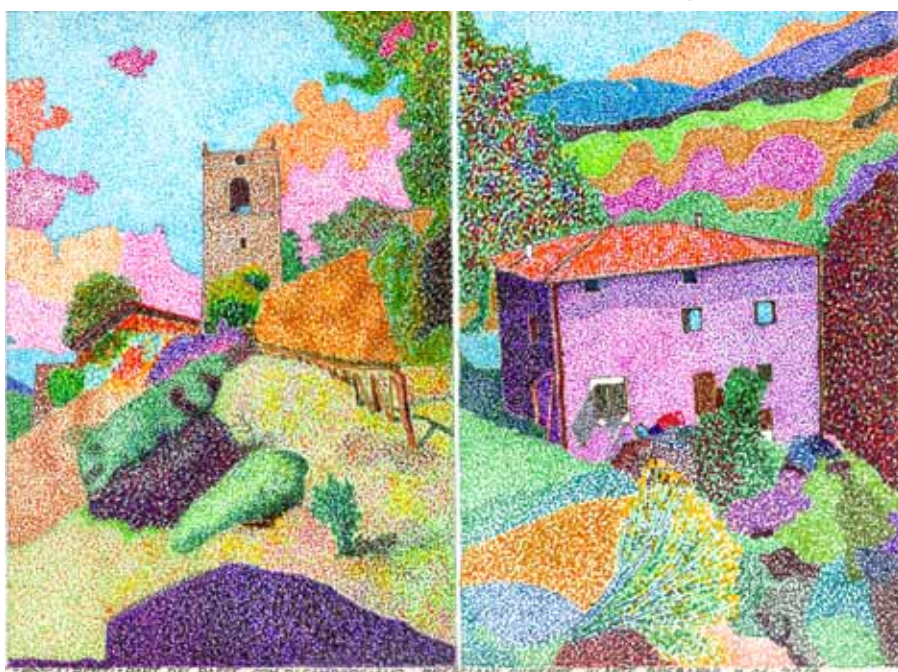
Due particolari del paese di Roccalberti (Comune di Camporgiano).