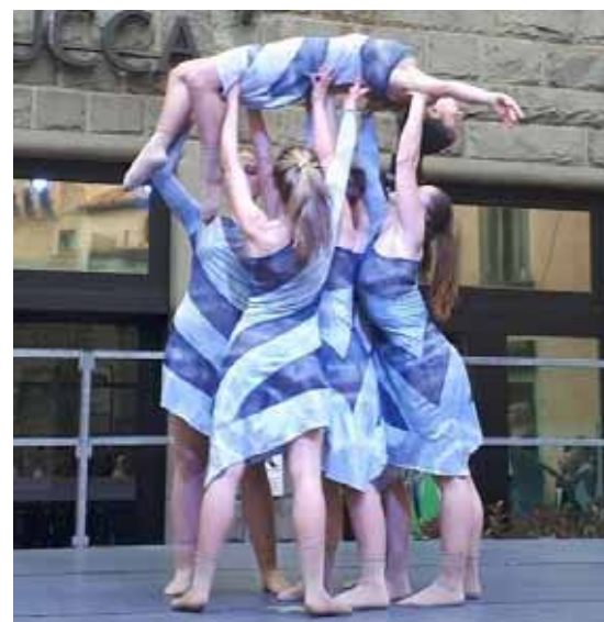
Una delle esibizioni in Piazza Umberto