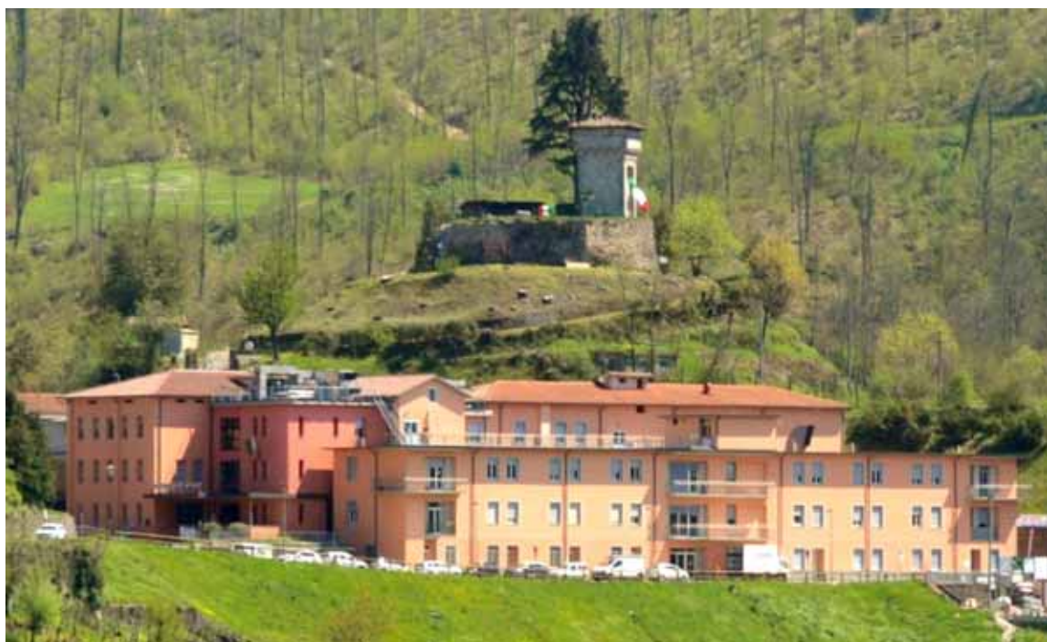
Ospedale Santa Croce

Alla continua ed, a volte, spasmodica ricerca di argomenti che interessino i nostri lettori, riteniamo, ancora una volta, di tornare a parlare della sanità, uno degli aspetti che si rivelano fondamentali per la qualità della vita dei cittadini della Garfagnana, sempre più anziani e sempre più abbandonati a sé stessi. Ci soffermeremo, in particolare, su due eventi, uno almeno parzialmente positivo, l'altro, invece, estremamente preoccupante, ma che sembra in via di soluzione: ci riferiamo alla presentazione del progetto di