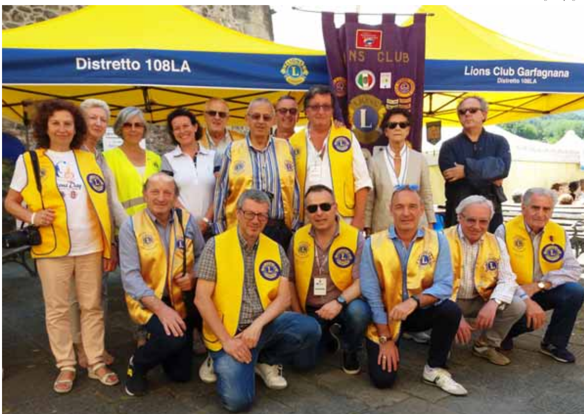
I dirigenti del Lions Club Garfagnana