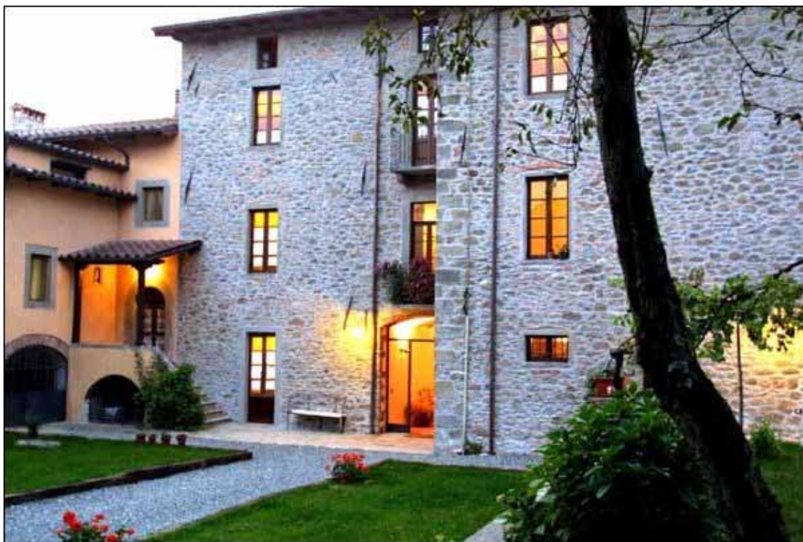
L'edificio che ospitava la vecchia Osteria del Piano.