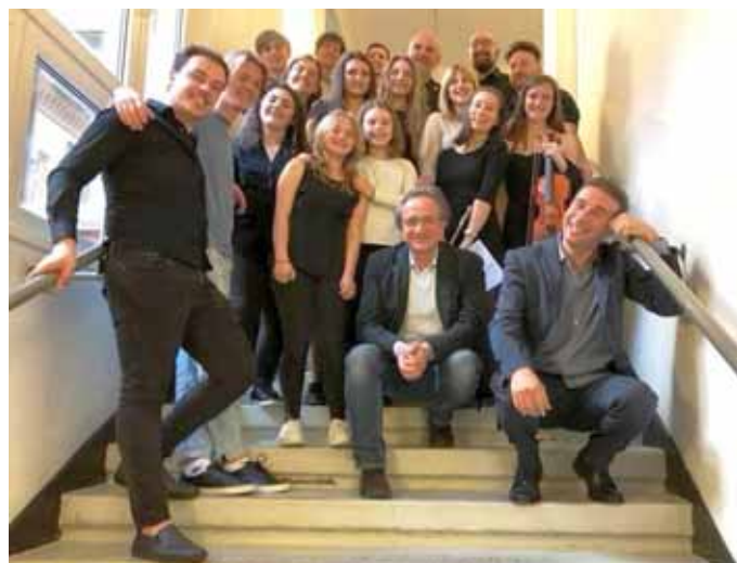
La Scuola di musica di Castelnuovo in Germania

Castelnuovo, con la sua Scuola di musica, ha stretto gemellaggio artistico con Dusseldorf in