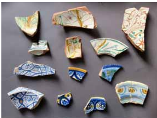
Frammenti di ceramiche rinascimentali da una fossa sul fianco orientale della Fortezza

dalla qualità delle ceramiche che ci sono pervenute. Al di là delle dimensioni, queste rimandano a quelle dei 'pozzi da butto' della Rocca di Camporgiano, sede dell'omonima Vicaria, per i frammenti di maioliche riconducibili a produzioni di Faenza e di Montelupo, e di ingobbiate e graffite padane di alta qualità che ci fanno rimpiangere la sorte subita da così sontuosi pezzi.