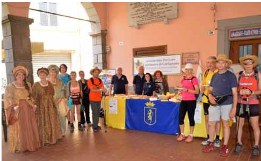
Il punto di ristoro allestito dalla Pro Loco di Castelnuovo in collaborazione con la Compagnia dell'Ariosto

Molto apprezzata la sosta a Castelnuovo, in cui