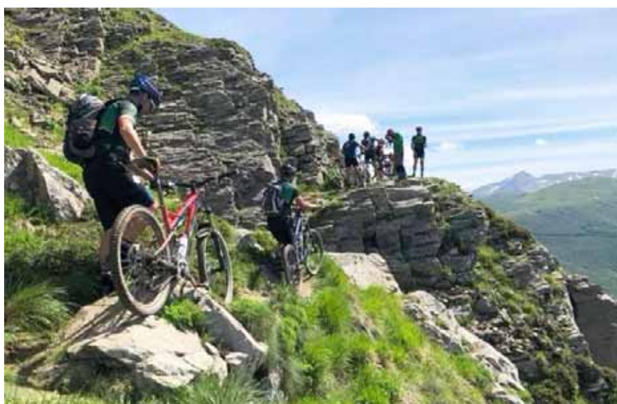
Un impegnativo passaggio