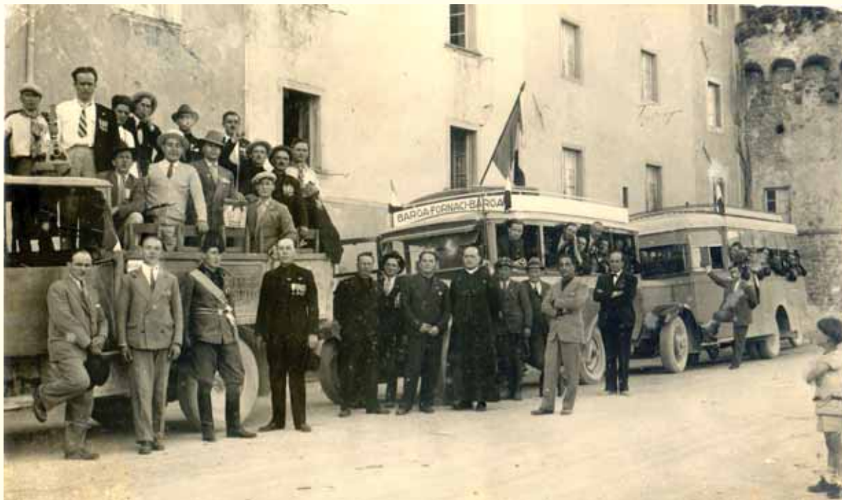
Castiglione di Garfagnana, 24 luglio 1931, anno IX Era Fascista.

Gita di un gruppo di combattenti e reduci del comune di Barga in posa nella Piazzola di Castiglione di Garfagnana. (Archivio Silvio Fioravanti)