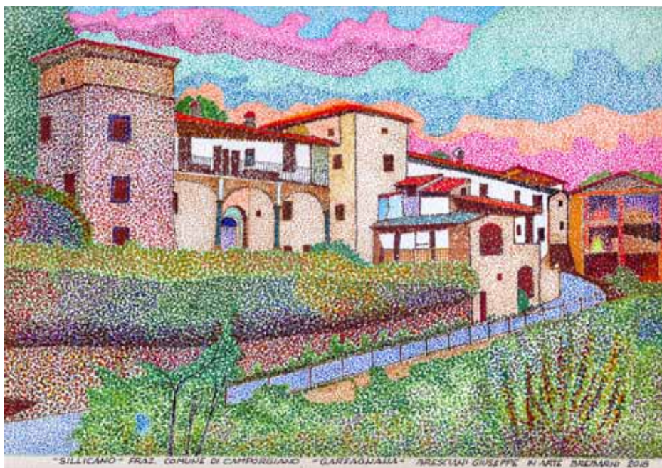
Silliciano (frazione comune di Camporgiano): Castello Turri, oggi "Villa Benedetta".