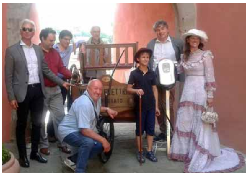
Gli organizzatori, i relatori e i figuranti del convegno.