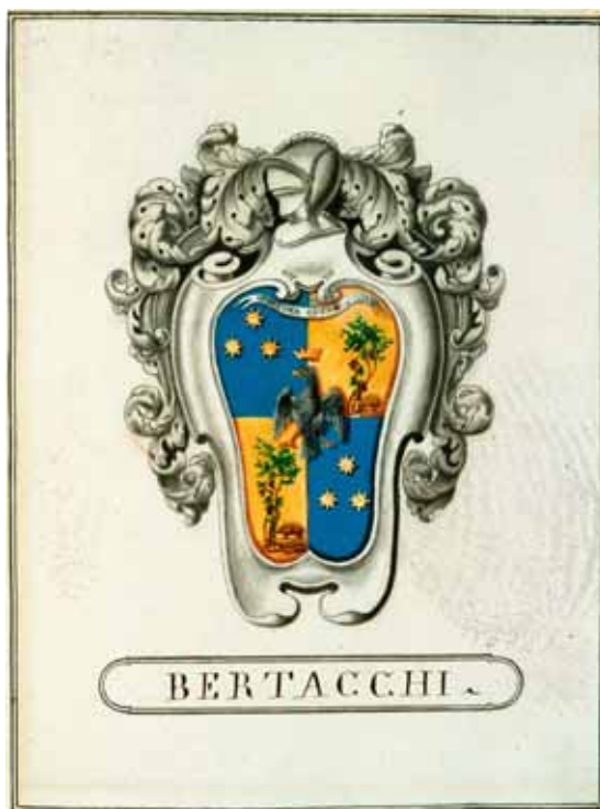
Stemma Bertacchi del ramo di Garfagnana

Il primo sequestro forzoso, lamentato dai signori Bertacchi, risale al periodo della Repubblica Cisalpina, «quando per alloggiare ufficiali e truppe, i maledetti giacobini occuparono quasi tutti i locali e le stalle, relegando in poche stanze