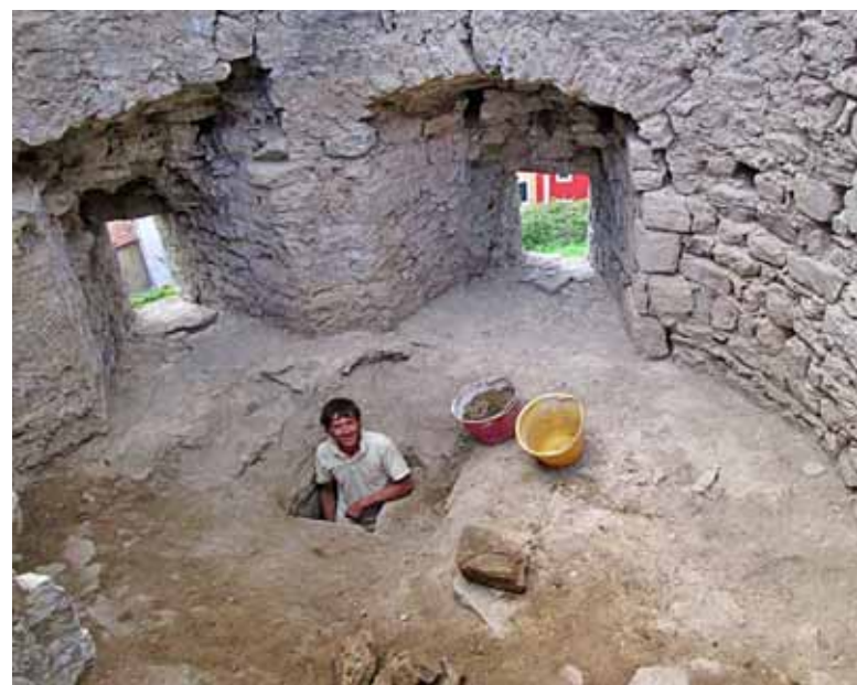
Lo scavo nella Rocca di Trassilico

Il 18 dicembre u.s. in un incidente stradale sulla via Aurelia nei pressi di Capalbino perdeva la vita Altero Matteoli, proprio in quella strada per la quale si era battuto per trasformarla in autostrada.