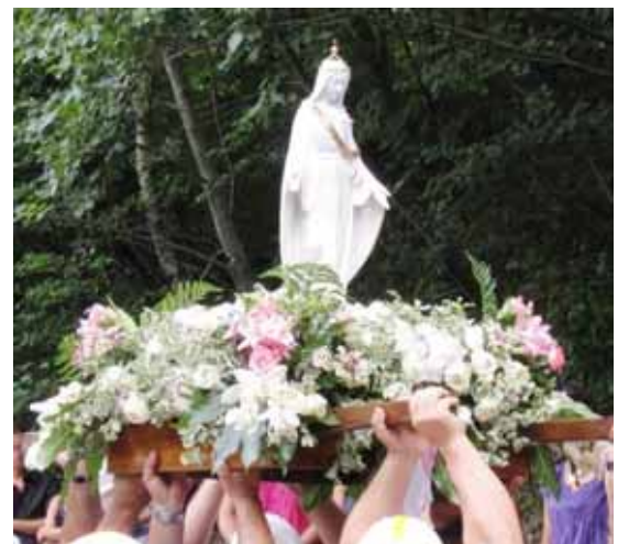
La statua della Madonnina dei cavatori