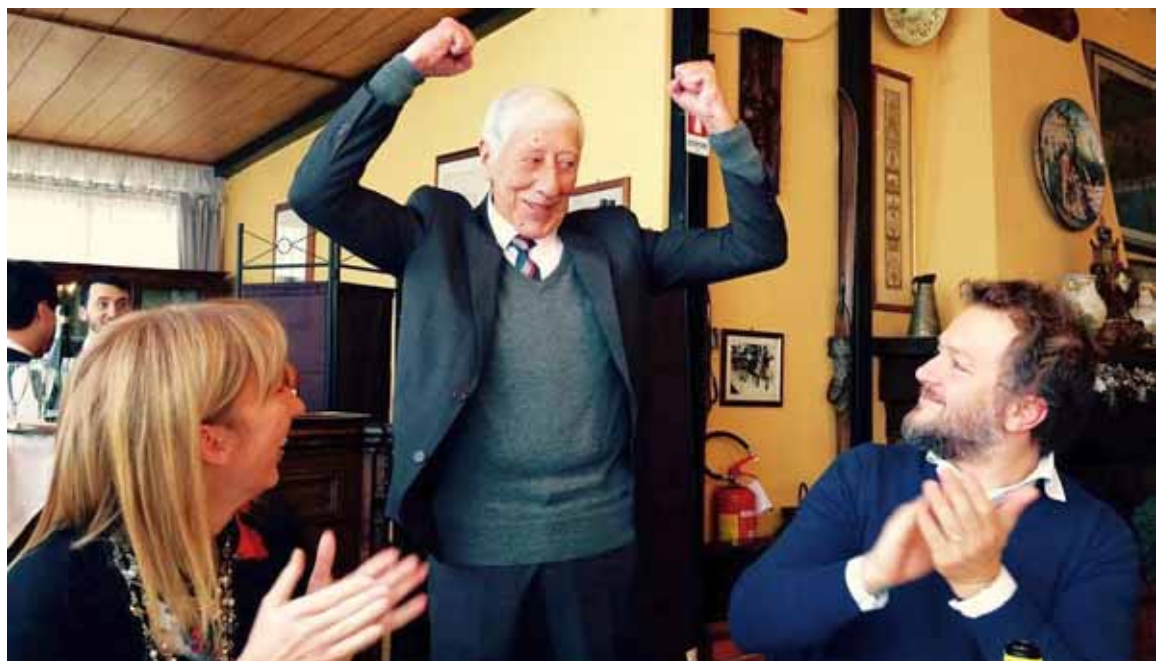
La potenza del nostro Direttore

I soci, la redazione e i collaboratori del Corriere di Garfagnana