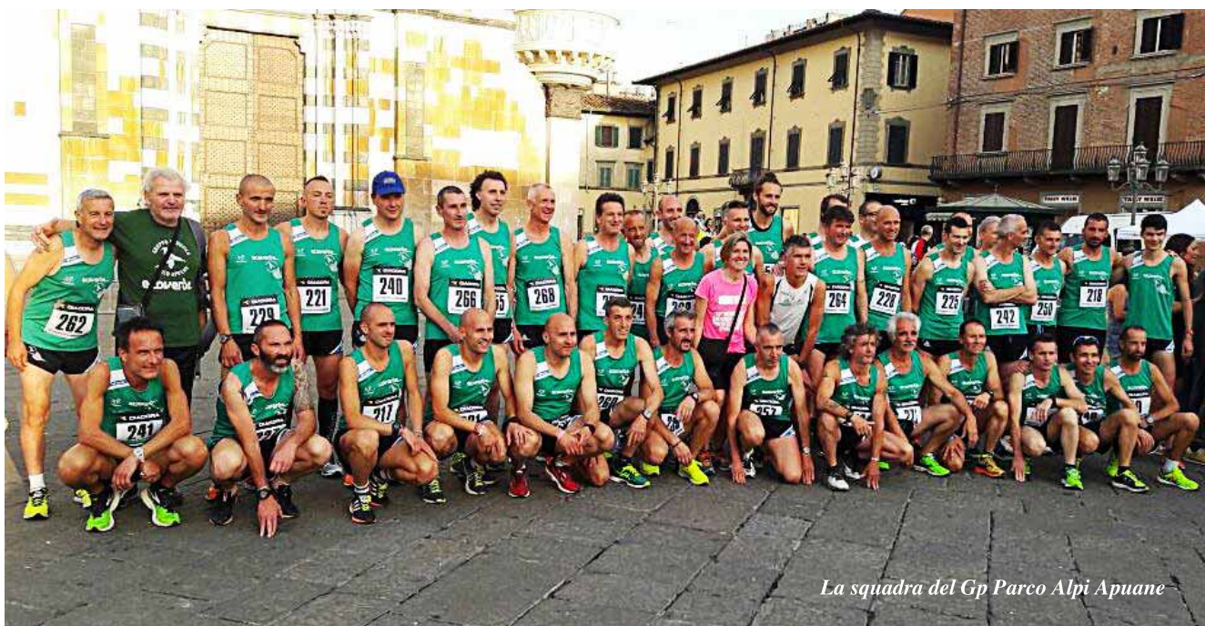
La squadra del Gp Parco Alpi Apuane