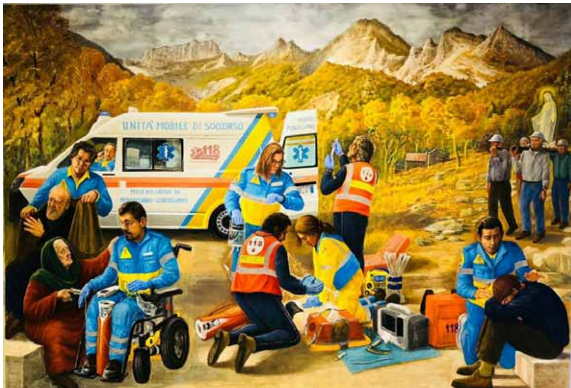
Affresco nella sede della Misericordia

Pegaso che sta arrivando sul luogo dell'incidente. Tutte queste scene avvengono sotto lo sguardo protettore della Madonnina dei Cavatori portata a spalla proprio da quattro anziani lavoratori.