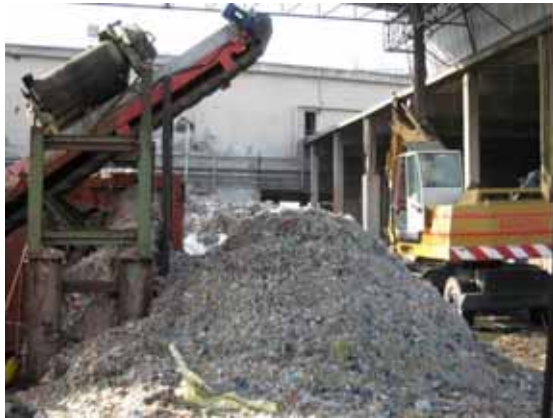
Lo scarto del pulper di cartiera