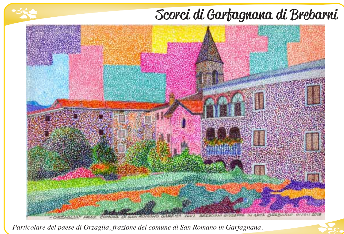
Particolare del paese di Orzaglia, frazione del comune di San Romano in Garfagnana.