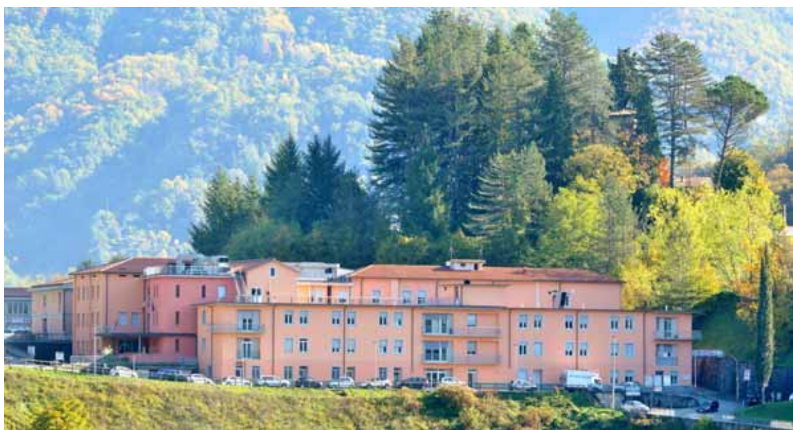
Ospedale S. Croce

È trascorso un altro anno, nel quale abbiamo cercato di trattare i temi sociali più caldi per la nostra valle. All'inizio di quello nuovo, il 2018, ci siamo domandati quale fosse l'argomento più importante e lo abbiamo individuato, con certezza, nel tema della sanità, al quale tutti i cittadini sono estremamente sensibili. Anche chi scrive sente molto questo aspetto della vita: non essendo più di primo pelo, negli ultimi anni, ha frequentato vari reparti dell'Ospedale di Castelnuovo, dall'ortopedia alla riabilitazione, dal pronto soc-