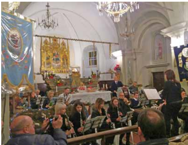
Concerto 2018 a Borsigliana