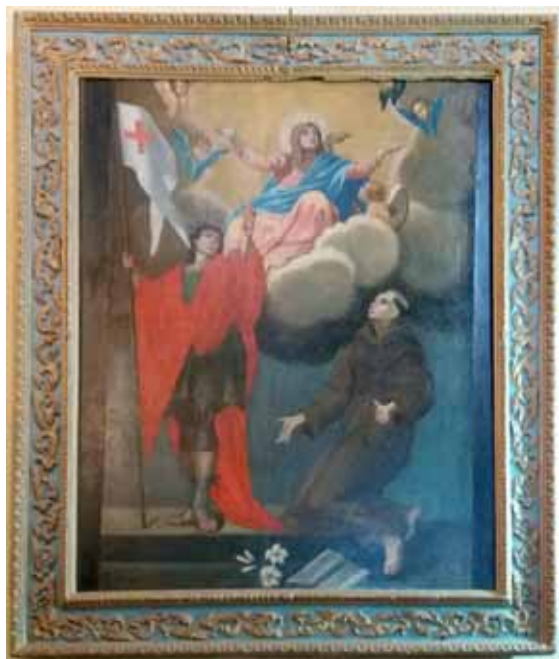
Il quadro restaurato nella chiesa di Campori

Tel. 0585 93218 - Cell. 347 5226337 begmarmi@libero.it