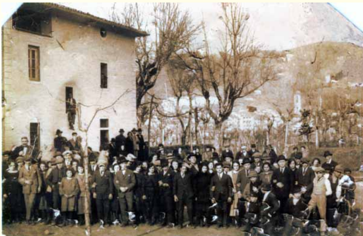
Castelnuovo di Garfagnana, località Carbonaia 1925.