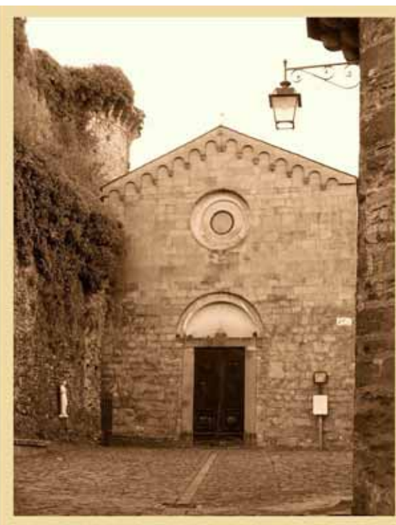
Le due chiese antagoniste

scritto la difficile situazione del momento, ma si era anche premurato di stimolare l'intervento del Deputato, ungendo come si suol dire le ruote, con un piccolo ma prelibato dono.