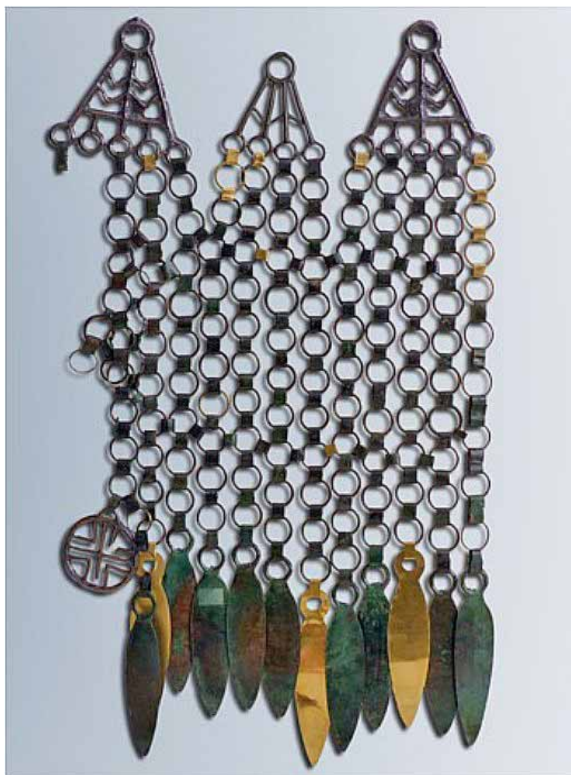
Paramento dell'età del Bronzo, pezzo unico in Europa, rinvenuto nei pressi della Pania di Corfino (vedi pag. 13 del libro "Il paramento di Cima La Foce")

PIEVE FOSCIANA (LU) - loc. Pantaline Tel. 0583.65678