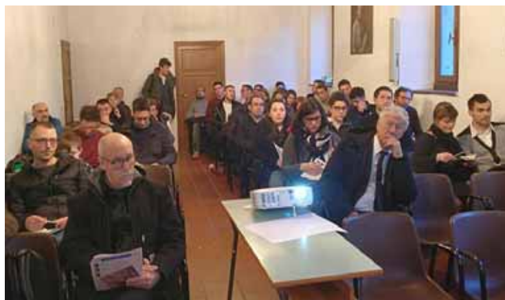
I partecipanti al Convento dei Cappuccini

Un progetto su come migliorare la qualità della vita in Garfagnana. È stato il tema di un convegno nazionale svoltosi a Castelnuovo nel salone del Convento di San Giuseppe, meglio conosciuto come quello dei Cappuccini. L'evento era rivolto agli operatori turistici, ai produttori locali ed in generale agli abitanti della Garfagnana intenzionati ad aprire un dialogo su queste tematiche ambientali e di sviluppo sostenibile. Numerosi erano i giovani tra i partecipanti al convegno con la consapevolezza di conseguire opportunità