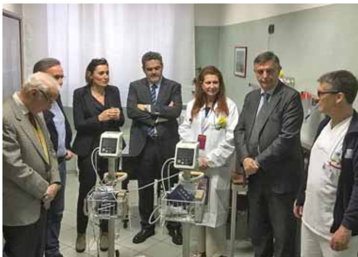
Il momento della consegna al Pronto Soccorso di Castelnuovo

Il Rotary Club di Lucca ha consegnato due nuovi importanti strumenti diagnostici per il Pronto soccorso dell'ospedale "Santa Croce" di Castelnuovo. Alla cerimonia di consegna era presente