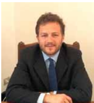
Il Presidente Nicola Poli

Il Piano Strutturale Intercomunale è innanzitutto un piano di area vasta, un piano cioè che affronta i problemi comuni a tutta la Garfagnana: il calo demografico, il rischio di abbandono delle aree interne, la mobilità e quindi la possibilità di accedere rapidamente ai servizi, ai luoghi di studio e di lavoro, le prospettive economiche, la salvaguardia dell'integrità del territorio dal rischio sismico, idraulico e geologico. E' un obiettivo ambizioso ed impegnativo, per il quale il Piano definisce un'articolata strategia di interventi fondata sulla creazione di reti sociali, economiche, di servizi e di infrastrutture a livello sovra comunale per rafforzare l'identità e per elevare l'attrattività di questo territorio. I principali settori di intervento sono: la realizzazione di una rete di trasporti funzionale alle esigenze dei cittadini e dell'economia; l'innovazione, anche imprenditoriale, nel settore agricolo; la promozione del turismo, vero volano dello sviluppo; il sostegno alle manifatture più avanzate