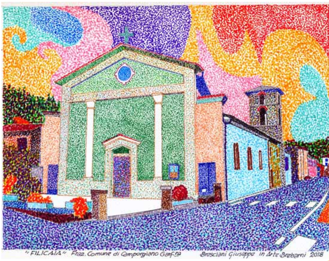
La chiesa di Filicaia, comune di Camporgiano.