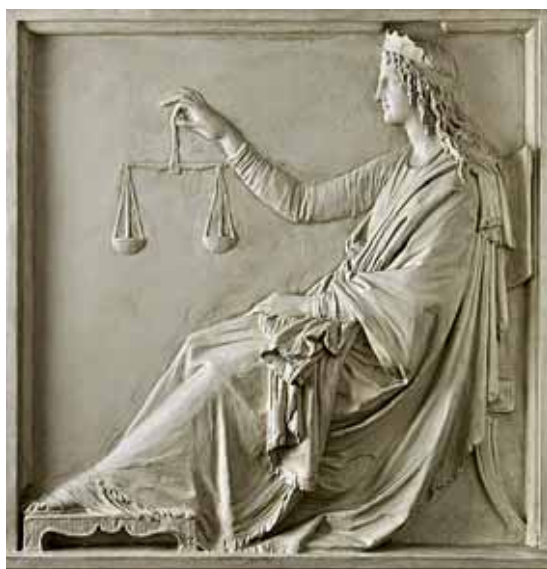
La Dea della Giustizia

Negli ultimi numeri del Corriere, in concomitanza con l'appuntamento elettorale, mi sono occupato di temi politici, senza sbavare entusiasmi, ma, anzi, lasciandomi spesso andare ad ampie critiche per quello che ritengo un evidente ed irreversibile scadimento di tutte quelle che sono le attività connesse all'esercizio di funzioni pubbliche svolte nell'interesse della cittadinanza. Non starò a ripetere le mie convinzioni critiche che tutti i