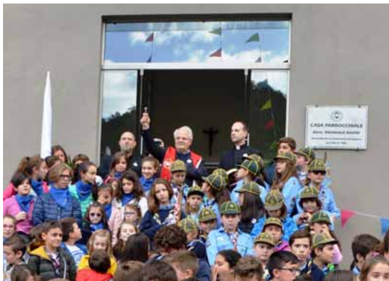
Foto di gruppo per l'inaugurazione del nuovo Oratorio