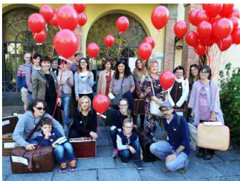
I partecipanti davanti alla Biblioteca Civica "Domenico Pacchi"