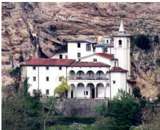
L'Eremo di Calomini

Gazzetta Universale n. 6 del 18 gennaio 1791. Renzo Giorgetti