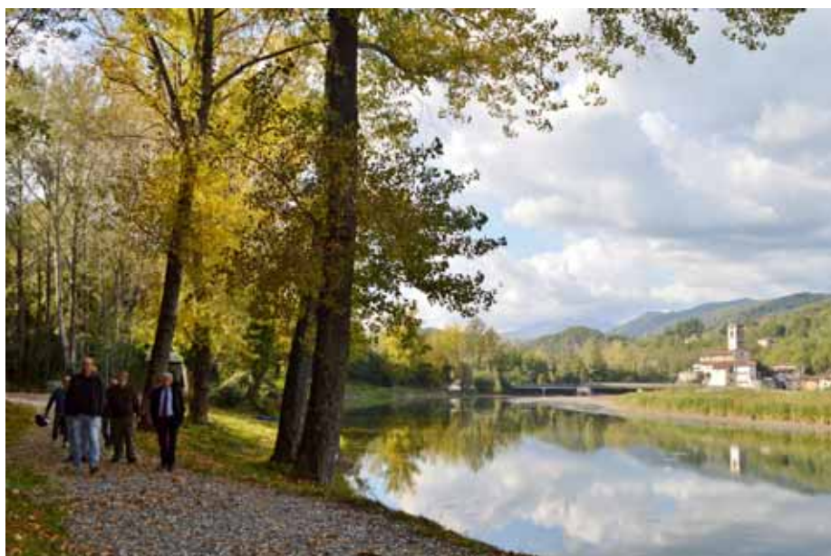
Le autorità percorrono il sentiero che giunge all'Oasi

Al teatro Alfieri di Castelnuovo, la Compagnia InOltre ha portato in scena "Assenza-nuova essenza", uno spettacolo di danza, musica (soprano, flauto, violino, pianoforte) e teatro dove la disabilità diventa invisibile e a parlare è solo