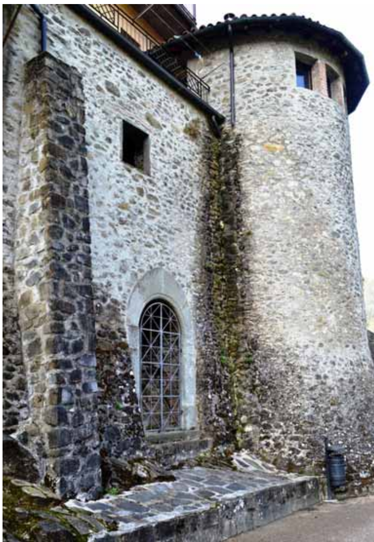
Particolare delle mura castellane dopo l'ultima ristrutturazione del 2006, con la cosiddetta Porta Petrenea

Un'accurata perizia, eseguita dall'ingegnere comunale di allora, ci mostra infatti delle mura piuttosto cadenti, che per evitare strutturali cedimenti necessitavano di un immediato e diffuso