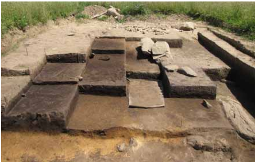
Muraccio di Pieve Fosciana, scavo archeologico di una concavità colmata in antico

nelle depressioni dove si sono conservati mentre è andato disperso dalle lavorazioni agricole quanto di questi antichi insediamenti si ritrovava all'intorno.