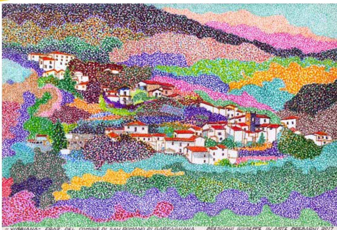
Veduta del paese di Viibiana (comune di San Romano in Garfagnana)