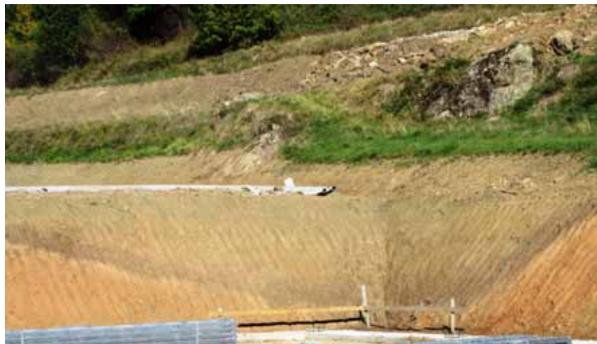
La concavità colmata della Groppeaia di San Romano

Il primo caso si riferisce ad uno scavo fatto in località Groppeaia, che si trova fra San Romano e il Serchio. Le opere edili in corso hanno quasi sezionato un'ampia concavità, profonda alcuni metri, dissimmetrica avendo il lato a monte assai più ripido di quello a valle, fasciata da terreno di colore nero ricollegabile alle piante palustri decomposte che ne colonizzavano le sponde. A questa fase di 'bagoscio' – così localmente sono denominate le conche palustri – è seguito un rapido interrimento denotato dal cambiamento del colore e della composizione del terreno ormai di natura colluviale, privo di una componente organica. Alcuni frammenti di pareti di vasi di terracotta, recuperati dalle pareti dello scavo, attestano un iniziale riempimento della depressione morfologica con frustoli ceramici di non facile classificazione, ma sulla base di quanto rinvenuto in anni addietro nel vicino 'campo del Nero' e nell'altro 'campo del Nando', sono probabilmente riferibili all'Età del Bronzo antico se non all'Età del Rame per la presenza di selci scheggiate disperse nell'area. Più sicura è la presenza dei Liguri, per frammenti ceramici in miglior stato di conservazione e i caratteristici impasti, vacuolari e con inclusi microclastici, della ceramica. I dati raccolti in più anni di indagini in questi campi ci consen-