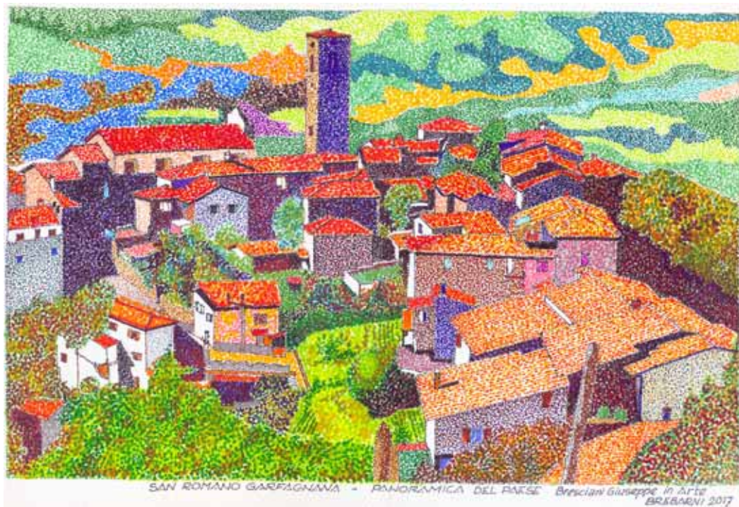
Veduta di San Romano in Garfagnana.