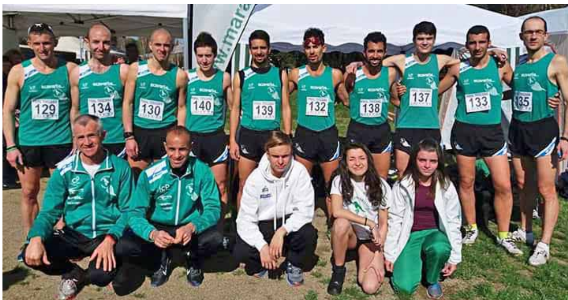
Gli atleti del Parco Campione Toscano di campestre