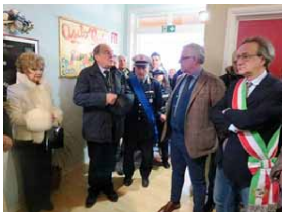
Un momento della cerimonia