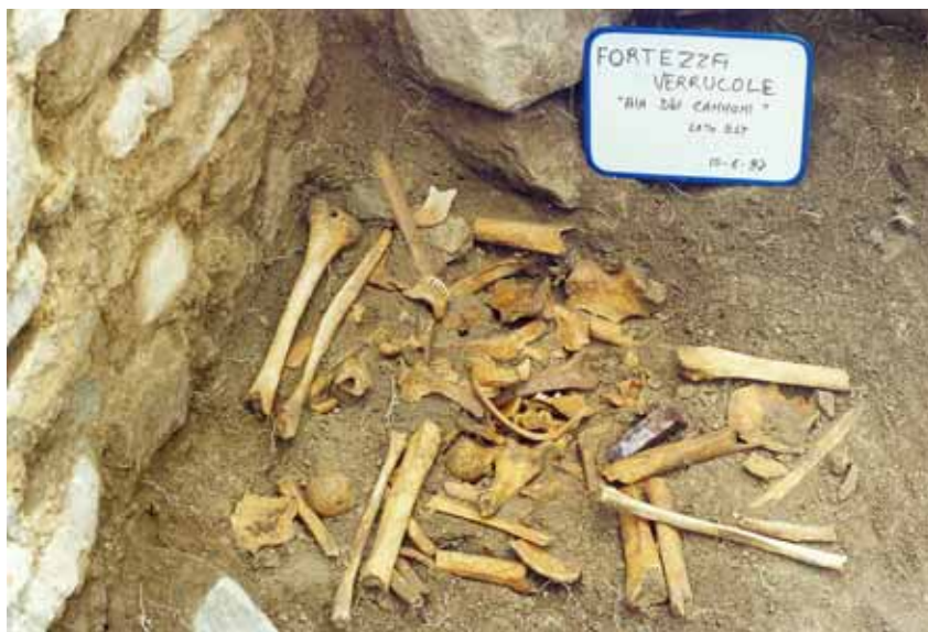
Accumulo di ossa umane riportate in luce durante gli scavi archeologici condotti nella Fortezza delle Verrucole.

Il fortilizio delle Verrucole è un puzzle di corpi murari di varia età, erede mutuato e stravolto del castello dei Gherardinghi, signori del luogo ( domini loci ) nella piena epoca medievale. Castello fra l'altro non solo di Verrucole, ma anche