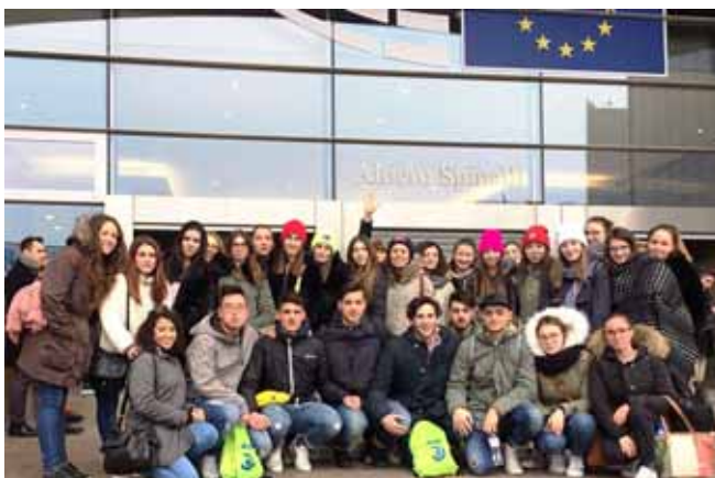
Studenti della Garfagnana all'Europarlamento a Bruxelles