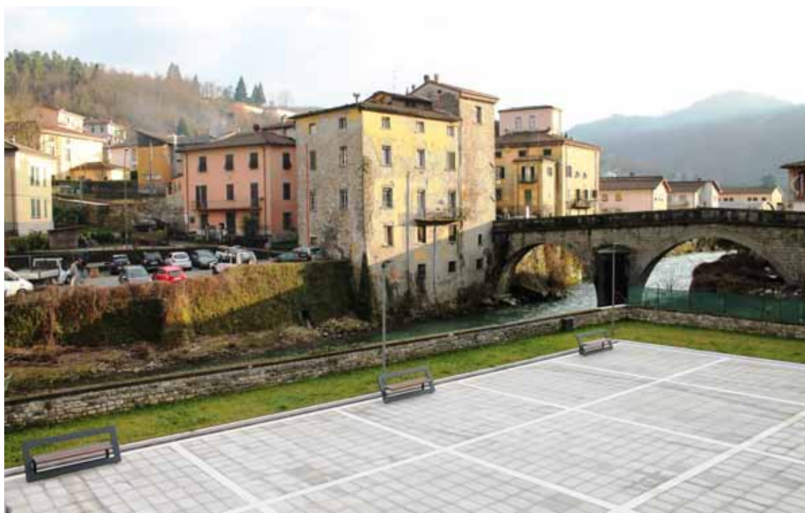
Castelnuovo: i lavori alla pista di pattinaggio

Che succede oggi nella nostra placida e sonnacchiosa Garfagnana? Se non osserviamo male, ci sembra di poter cogliere segnali abbastanza divaricati: da una parte, specie dal mondo del lavoro, pare di poter osservare qualche elemento di positività, almeno parziale, derivante dalla evoluzione delle situazioni Terra, Uomini, Ambiente di Castelnuovo e Corgi di Pieve Fosciana. Nel primo caso, si è concretato un assorbimento della T.U.A. da parte di una grossa cooperativa di Pietrasanta che conta oltre 1.000 dipendenti: circa una metà dei lavoratori è stata licenziata o