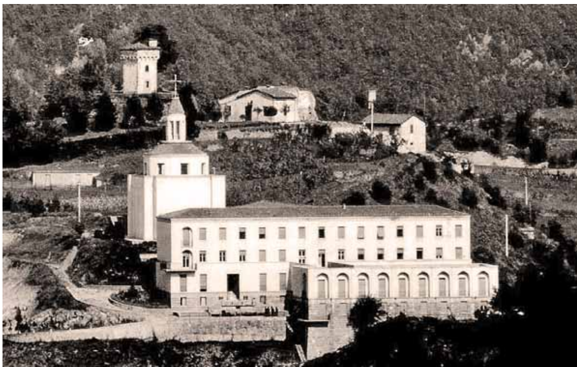
Vecchia immagine del Seminario Vescovile, dove era la sede di «Carfaniana Antiqua»

Così pian piano l'Alpestre Accademia divenne, anche a detta dello storico locale Migliorini, una convecicola di uomini colti, che si riunivano solo per cavillare con se stessi o per comporre madrigali e sonetti. E non appena anche questo poetico stimolo si affievolì, la morte di questa ormai languente Società fu lenta ma inesorabile. Oggi dell'Accademia degli Alpestri rimane sol-