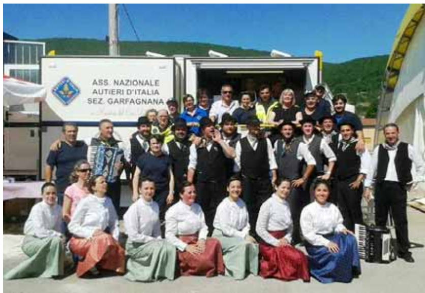
Autieri e La Muffrina nelle zone terremotate