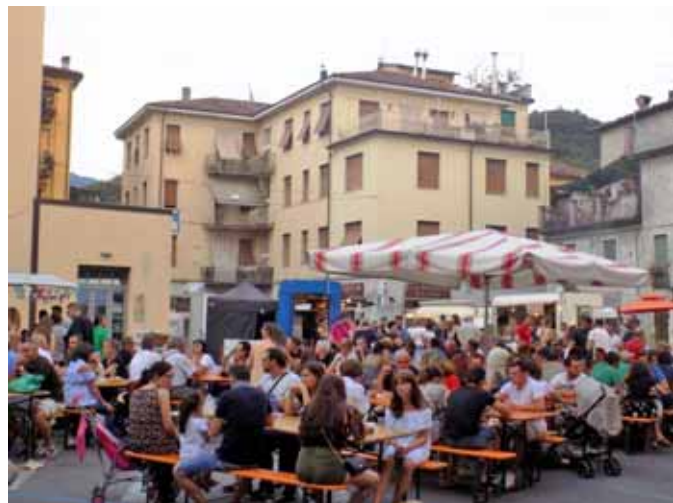
La piazza delle Erbe gremita

Tante persone alla seconda edizione di Street Love Festival che si è tenuta anche quest'anno a Castelnuovo da venerdì 7 a domenica 9 luglio. Il bis non è stato da meno della prima edizione e si è svolto in un clima molto conviviale e