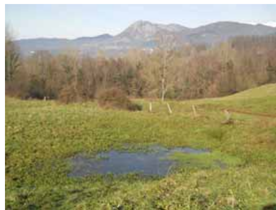
Bagoscio, durante le piogge primaverili.

dei contadini: 'non passare di là che vi è un bagoscio'; oppure 'tieni lontane le vacche dai bagosciai', vale a dire dal campo acquitrinoso con bagosci, ma in questo caso sono più leggere insellature diffuse del terreno che concavità di una certa profondità.