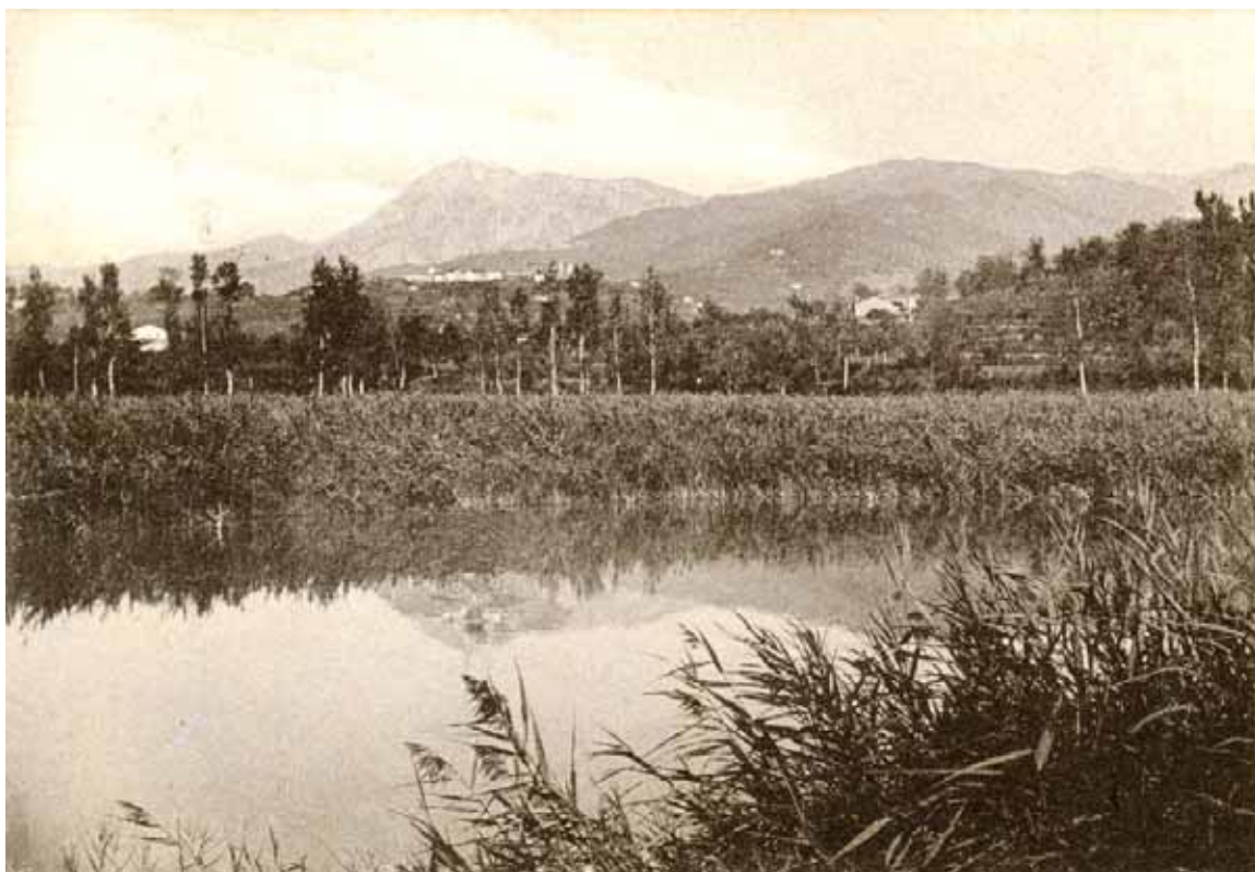
Il Bagno della Pieve nei primi anni del secolo scorso.

Ma gli studi che più lo appassionarono e lo fecero apprezzare anche in ambito nazionale furono quelli sulle ammoniti della Pania di Corfino e sulle acque termali di Pieve Fosciana, come si evince anche dalla seguente lettera che egli scrisse ad un suo collega dell'Università di Modena il 3 novembre 1843: «Caro amico, all'occasione del ritorno in Modena dei giovani Garfagnini studenti in cotesta Università mi procuro la soddisfazione di scriverle e darle le mie nuove, le quali di presente sono buone, quantunque nella scorsa estate abbia di molto sofferto per l'afflizione, in che mi trovavo vedendo mia moglie oppressa da grave malattia, la quale fu poi susseguita dal parto immaturo e dalla perdita della nata bambina che esisté solo otto giorni. [...] Ella avrà forse saputo, che le Ammoniti, e le Ortocere trovate nella nostra Calcarea, che forma la porzione più bassa e superficiale della Pania di Corfino, le quali presentai alla Sezione di Geologia sono state reputate di una grandissima importanza; e lo stesso celebre Omalius le giudicò tali da poter