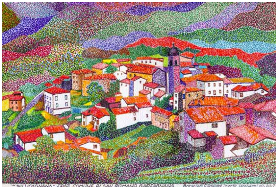
Panorama di Sillicagnana (Comune di San Romano in Garfagnana)