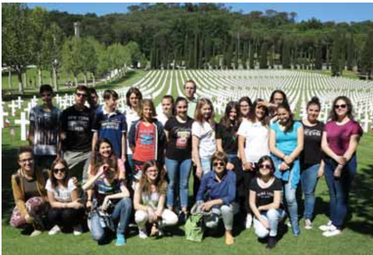
La classe III A al cimitero militare americano