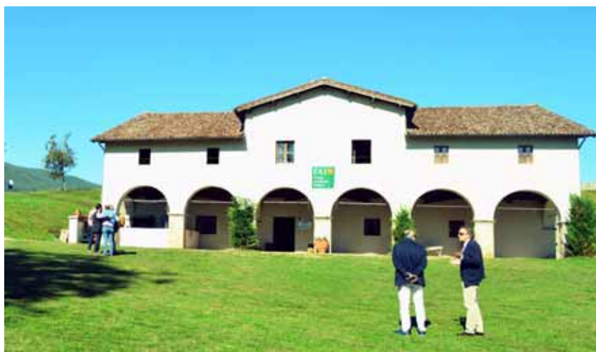
La Fortezza di Montalfonso