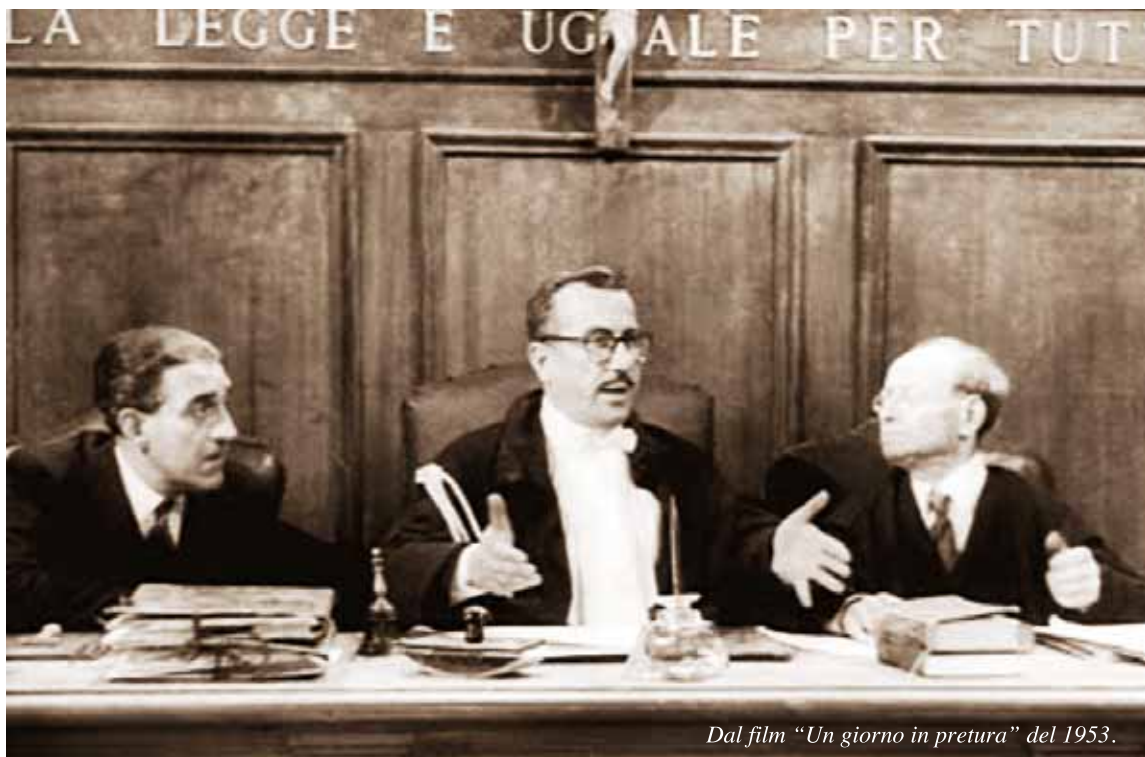
Dal film "Un giorno in pretura" del 1953.

Ricorderete, tutti, che, fino a qualche mese fa, avevamo dato per irrimediabilmente perso l'Ufficio del Giudice di Pace di Castelnuovo di Garfagnana. Infatti, esso era stato smantellato, con trasferimento di mobili, pratiche e personale nella sede centrale di Lucca. La nostra negativa previsione si basava, oltre che sulle convinzioni che affioravano negli ambienti giudiziari, soprattutto sulla osservazione che la nostra società marciava, in tutti i settori, verso il mito della riduzione e della centralizzazione dei servizi, nella falsa (a nostro modo di vedere) convinzione