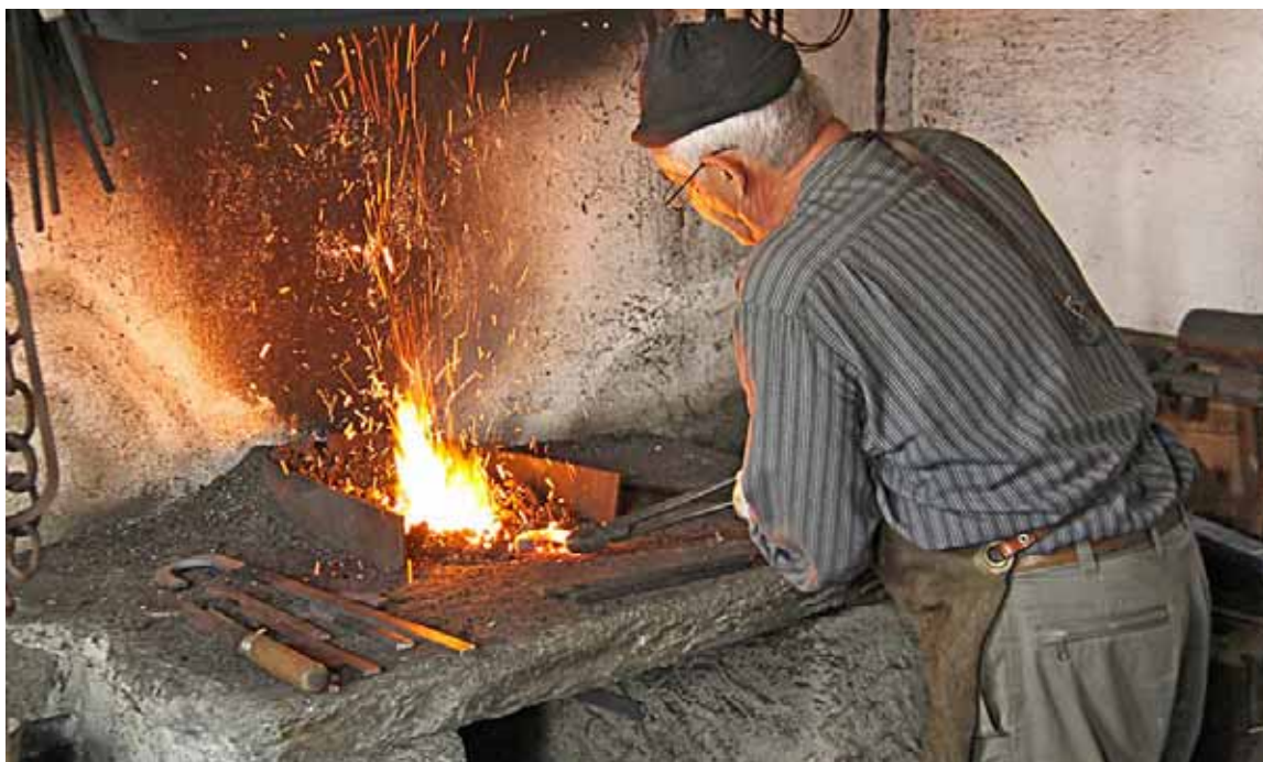
Il ferro era considerato bene di prima necessità perché serviva per produrre attrezzi agricoli.

Sfortunatamente di questi provvidenziali interventi, forse a causa delle distruzioni avvenute nell'ultima guerra, l'archivio comunale di Castelnuovo conserva soltanto poche testimonianze riferibili al 1852, anno in cui la comunità di