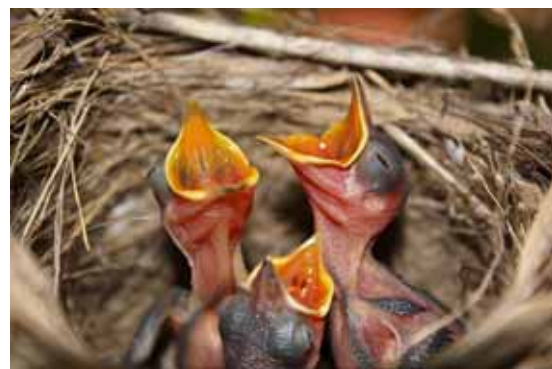
Piccoli "maconi" nel nido

era parola usata per i maiali di giovane età perché, a suo dire ma anche a mio parere, la carne era tenera come il 'buro'. Dunque butiro non poteva che essere il nome dato agli uccelli (il butero di Camporgiano) come ai maialini ad indicarne, in senso traslato, la consistenza della carne relativo ad un primo stadio di crescita. Il toponimo Butiro di Riocavo poteva quindi essere derivato sia dal soprannome del proprietario della terra (campo o selva del Butiro), come dall'attività che in tempi antichi in quel luogo poteva svolgersi, cioè la produzione del burro.