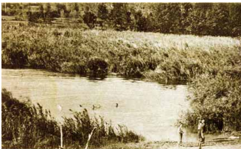
Il laghetto di Pra' di Lama negli anni '20 (cartolina di Silvio Fioravanti).

«Innanzitutto questi cedimenti del terreno vengono denominati da ISPRA con il termine generico di sinkhole», ci spiega Locchi. Il vocabolo, significa, letteralmente, «buco sprofondato», e sta ad indicare, una cavità di forma sub-circolare dovuta al cedimento o alla diminuzione di volume del terreno sottostante per cause diverse. «Molto frequentemente queste depressioni si riempiono di acqua formando laghetti e possiedono un proprio dinamismo, per cui possono subire cambiamenti, anche improvvisi (come del resto è improvvisa anche la loro apparizione).