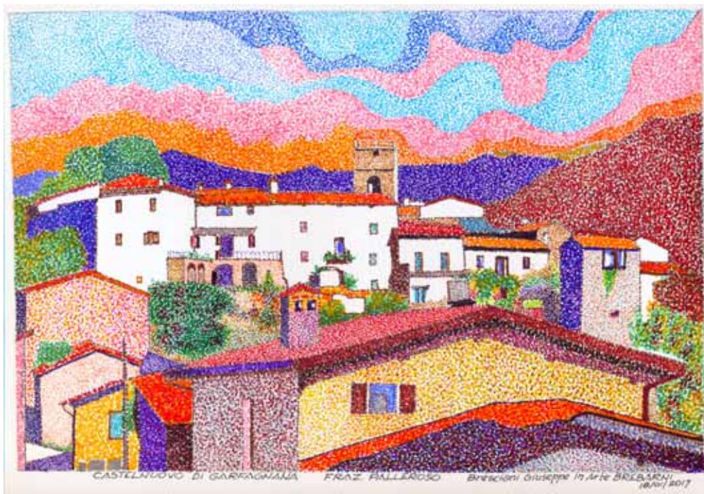
Veduta di Palleroso (Comune di Castelnuovo di Garfagnana)