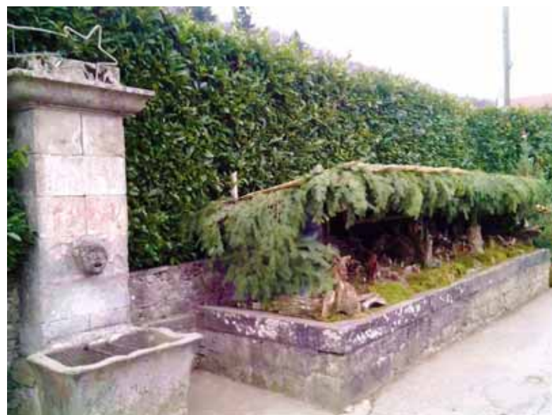
Il caratteristico presepio di Livignano

Il Presepio della Chiesa parrocchiale di Santa Maria Assunta di Borsigliana si è classificato al quarto posto, con 458 voti, nella classifica finale del concorso provinciale "Vota il presepe più bello", promosso da La Nazione. Da parte di