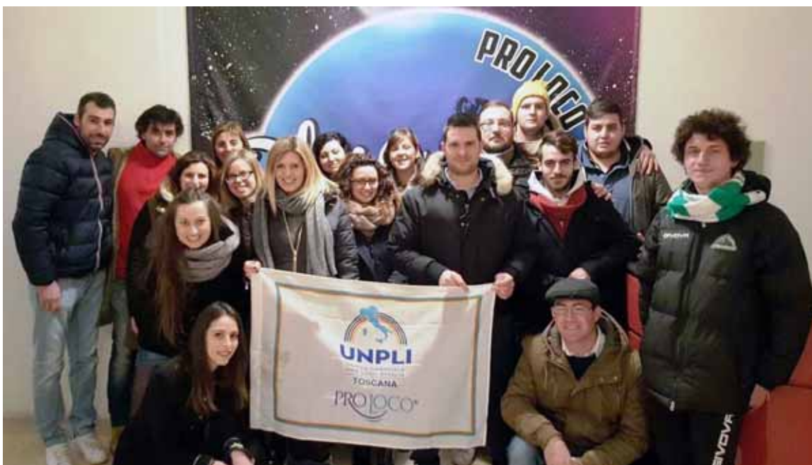
I componenti della Pro Loco di Piazza al Serchio