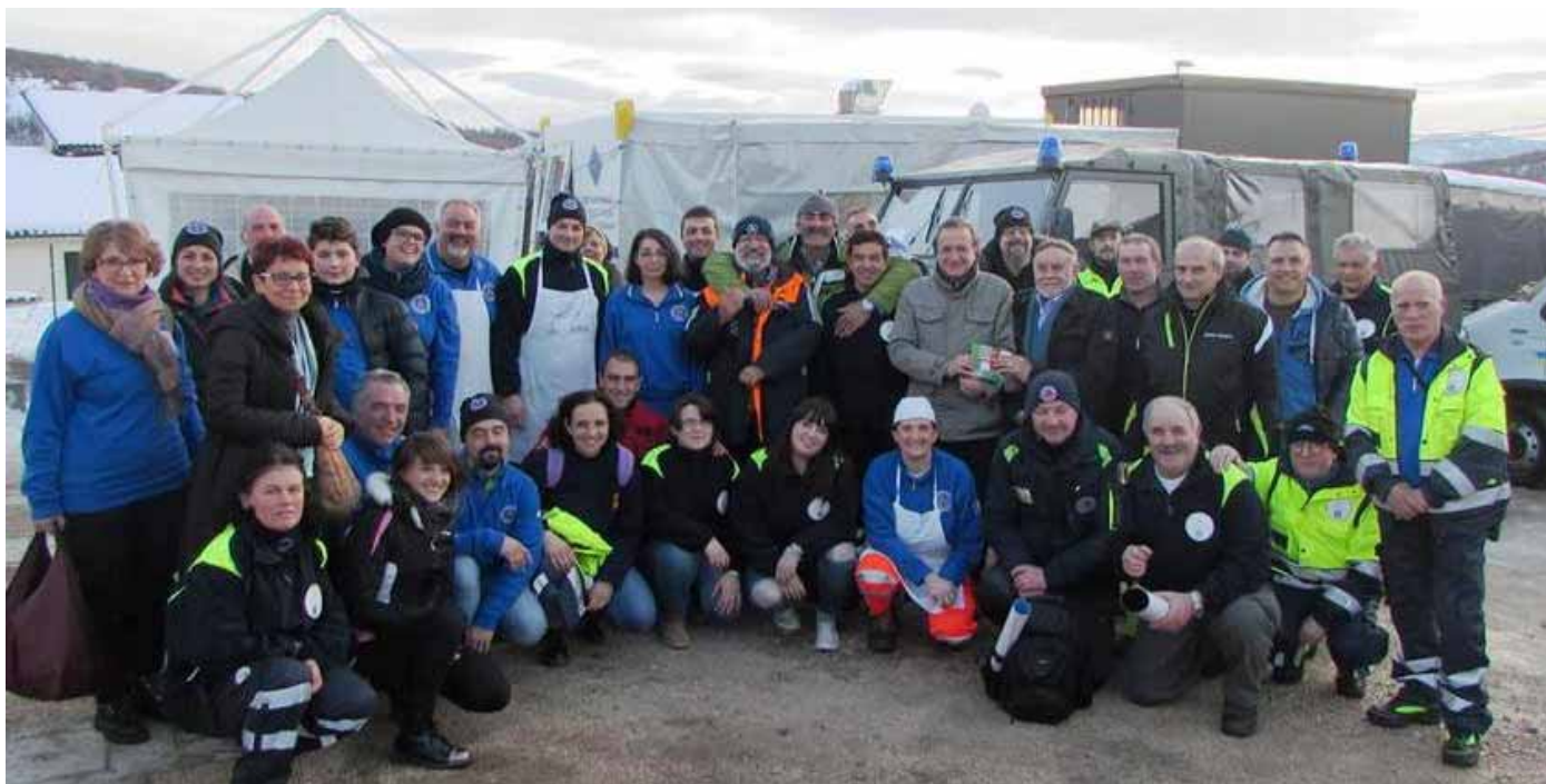
Il gruppo degli Autieri