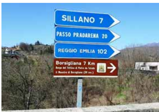
Il nuovo cartello turistico-artistico per Borsigliana

Dopo oltre trenta anni a Borsigliana in comune di Piazza al Serchio è stata celebrata in modo solenne la ricorrenza di San Giuseppe, patrono del paese. È stata l'occasione anche per