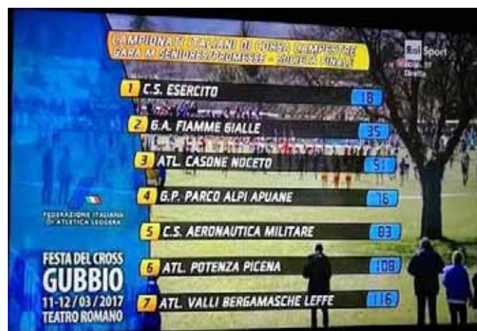
Il prestigioso ordine di arrivo del Parco Apuane a Gubbio

pionati italiani di cross a squadre sul bellissimo percorso ricavato nei prati adiacenti al Teatro Romano a Gubbio. La società garfagnina ha migliorato così il 5° posto ottenuto lo scorso anno sempre a Gubbio e il 6° posto del 2014 a Marostica. Il titolo tricolore è stato vinto dalla formazione dell'Esercito con 18 punti (dato dalla somma dei piazzamenti dei singoli atleti), davanti alle Fiamme Gialle 35, Casone Noceto Parma 51. Poi ai piedi del podio il Parco Apuane con 76, Aeronautica 83, Potenza Picena 108, Valli Bergamasche Leffe 116. "La fotografia con l'ordine di arrivo della nostra squadra - com-