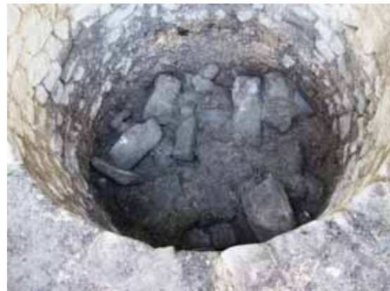
La Torricella in fase di scavo

quindi, nell'occasione fornita dai lavori in corso, è stata svuotata per riportarla all'origine ed esplorarla archeologicamente. La sua posizione nel punto più alto del colle su cui è cresciuto il paese, inglobata fra i muri che gli si appoggiano e quindi segnalano la loro posteriorità rispetto alla torre, suscitava una certa curiosità circa la sua importanza strategica e il sicuro rapporto, non solo visivo, con quella parte del castello circondata da alte mura, oggi proprietà privata, denominato Rocca. Dall'esame dei muri in vista la torre sembra aver subito più di un rimaneggiamento, ossia uno o più rifacimenti, per le diverse tecniche murarie osservabili e la mancanza di feritoie e buche pontate. Ma non è certo questa la sede idonea per disquisire su aspetti rilevati in fase di scavo, che in ogni modo saranno trattati nell'approfondire questa semplice segnalazione di un lavoro fatto. In quanto alla rimozione del riempimento della torre, le difficoltà sono nate dalla presenza di acqua al suo interno – per una specie di sigillatura acquisita nel tempo