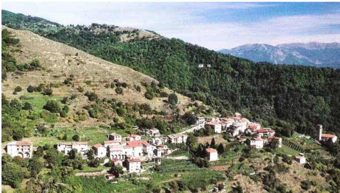
Panorama di Rontano

Ad illuminarci ancor più sulla carenza dei pascoli