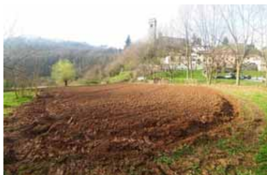
Orti sociali a Gallicano

di 50 mq ad un massimo di 400mq. L'acqua per l'irrigazione è gratuita potendo fruttare l'adiacente canale irrigatorio che attraversa gran parte del paese da maggio a settembre. Sperando che questa iniziativa riscontri lo stesso successo che ha avuto in altre città, mi sento di sottolineare l'importanza che può assumere per la Garfagnana il propagarsi di situazioni di questo genere. Infatti, da un lato vedremo un territorio più curato e, quindi, più apprezzato da chiunque decida di trascorrervi le proprie vacanze, incrementando i guadagni di tutte quelle attività turistiche che pullulano nella nostra zona. Dall'altro riscopriremo prodotti genuini che ci saranno venduti a prezzi competitivi.