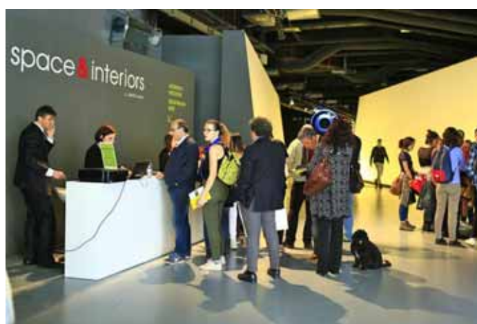
L'esposizione di Milano

Diverse realizzazioni in marmo della Garfagnana sono state in esposizione presso lo spazio "The Mall" di Porta Nuova a Milano all'interno di Space & Interiors - area espositiva ideata e gestita dagli organizzatori di Made Expo. Garfagnana Innovazione di Gramolazzo in partnership con Cutting Service S.r.l. ha presentato il