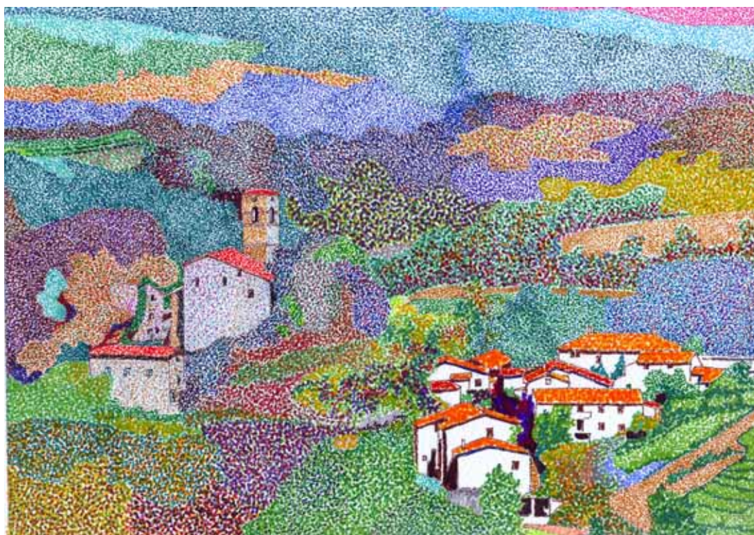
Sambuca (comune di San Romano in Garfagnana)