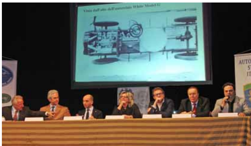
La conferenza al Teatro Alfieri

PIAZZA AL SERCHIO (Lu) - Tel. 0583.696058