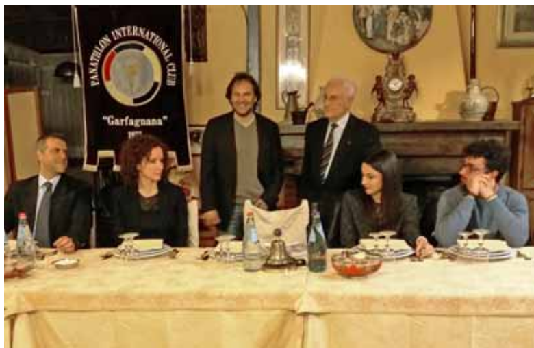
Un momento della serata al Panathlon

pionato. Andreucci ha ricordato a Chiara come nella pratica del rally ci voglia tanta passione e grande dedizione. Si è poi complimentato con la giovane compaesana per la bravura dimostrata, augurandole una carriera ricca di soddisfazioni. Il presidente Bianchini, a proposito di Paolo Andreucci, grande campione, ma anche uomo ricco di umanità ed altruismo, ha ricordato una