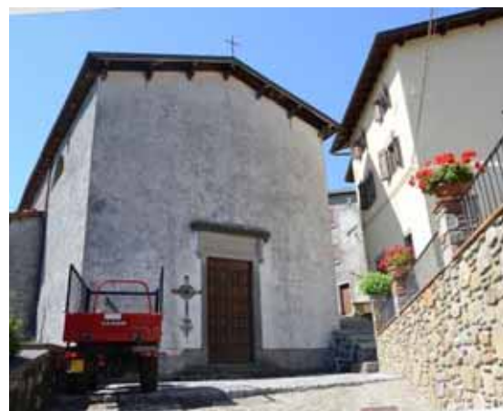
Oratorio di Maria SS. Addolorata

Contributo sicuramente interessante e stimolante, che si concentra su di una informazione di asso-