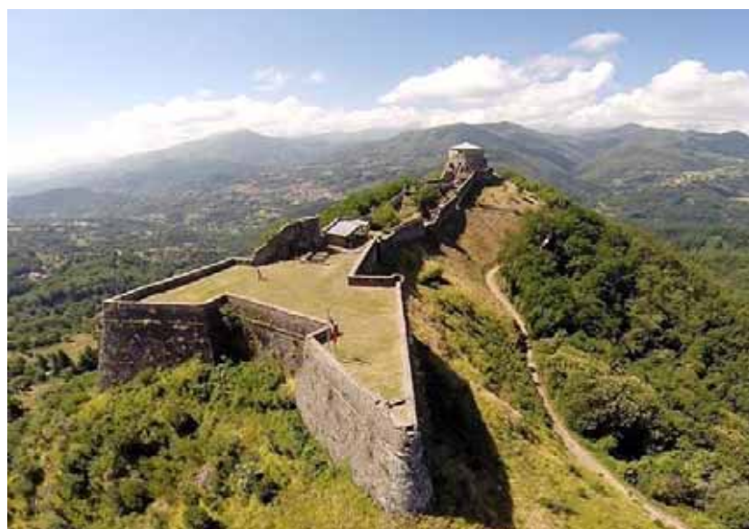
Fortezza delle Verrucole dall'alto