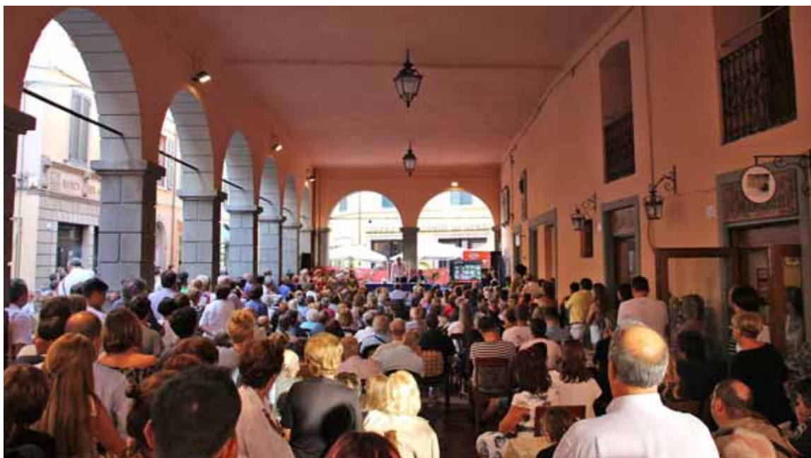
Numeroso pubblico alla conversazione di Vittorio Sgarbi sull'Orlando Furioso nell'arte