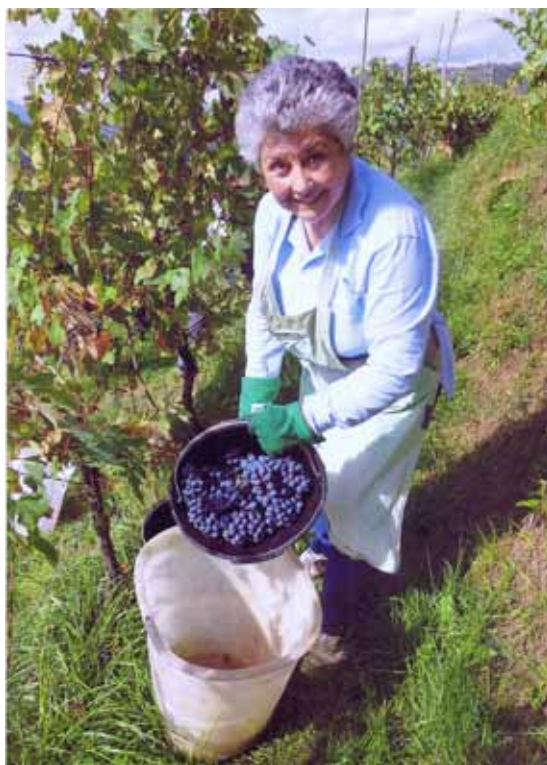
Vendemmia a Fosciandora

A differenza di oggi, il vino nuovo era infatti molto apprezzato dai consumatori del tempo. La bassa gradazione alcolica di quasi tutti i vini prodotti allora in Garfagnana e le rudimentali tecniche di vinificazione sicuramente non favorivano la conservazione ed era abbastanza facile