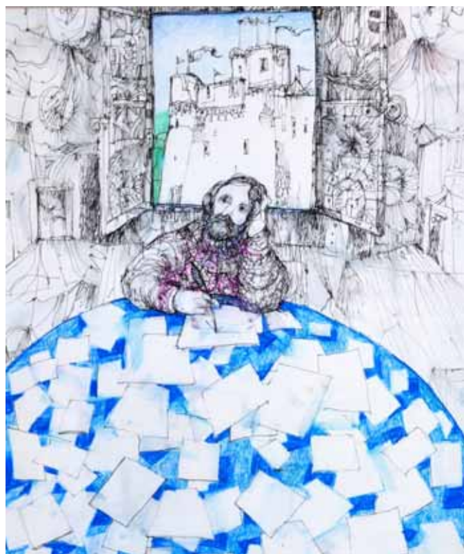
Malinconia di Ludovico Ariosto

Il poema si articola in vari filoni narrativi: sullo sfondo si svolge la guerra tra Cristiani e Saraceni, iniziata con l'assedio di Parigi; in questa cornice, si incastonano i folli amori per Angelica, che condurranno Orlando alla follia, le imprese di Rinaldo ed Astolfo, il rapporto tra Ruggiero e Bradamante, indicati come gli antenati della casa d'Este. Le storie sono animate da una serie di luoghi e di animali fantastici: l'isola di Alcina è piena di rocce e piante parlanti; il palazzo di Atlante presenta specchi magici; l'ippogrifo serve da cavalcatura per Astolfo che viaggia dall'Etiopia al Paradiso terrestre e sulla luna, per recuperare il senno perduto da Orlando.