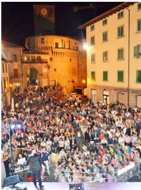
Il pubblico di MagiX in Piazza Umberto.