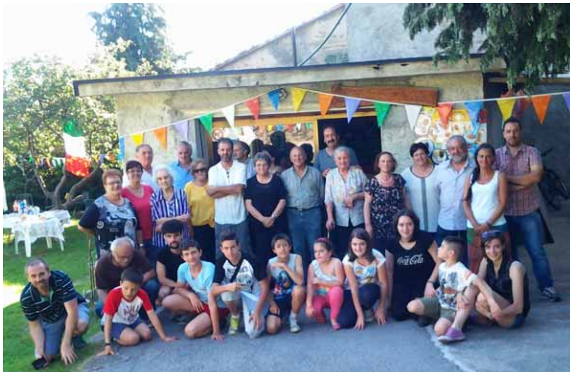
Gli abitanti di Livignano in posa davanti al proprio Circolo