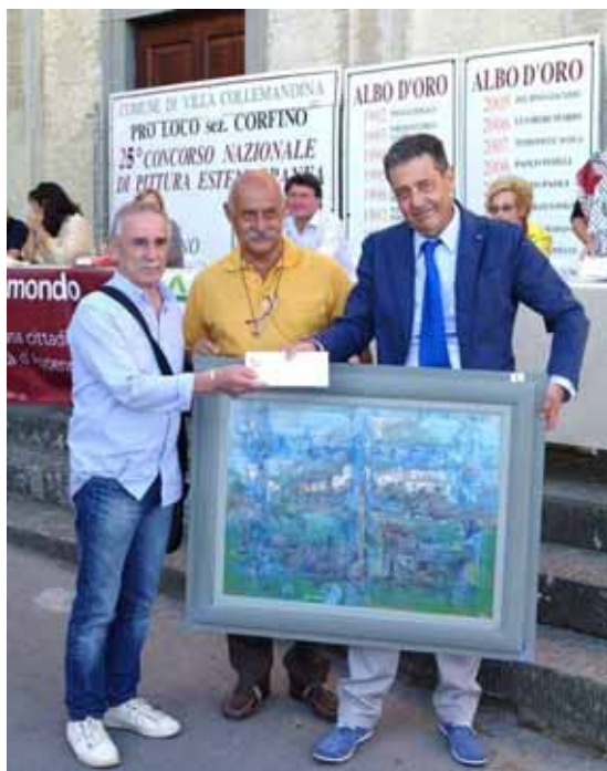
Premiazione del pittore vincitore

Via F. Azzi, 7/D - 55032 CASTELNUOVO DI GARF. (Lu) Tel. +39 0583.62169 - Cell: +39 328 9834311 - E-mail: orsettibrunello@tin.it www.ilparcoimmobiliare.it www.houseingarfagnana.com