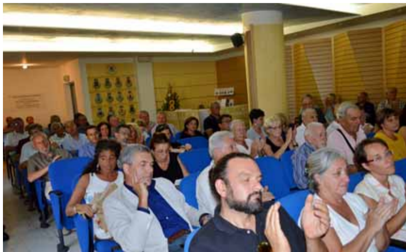
Il numeroso pubblico alla presentazione del volume

Via Pettinella, 30 - Castelnuovo di Garfagnana (Lu) Tel. e Fax 0583 62943 - Email: fllisuffredini@libero.it