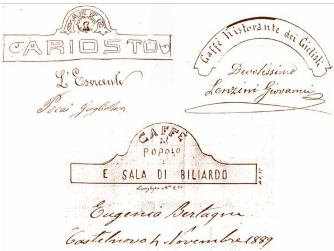
Alcuni disegni approvati dalla Commissione Edilizia.

Nella seconda metà dell'800 a Castelnuovo ci fu un significativo rinnovamento dei vecchi negozi e nel contempo anche l'affermarsi dell'imperante moda dei caffè-biliardo. Molto