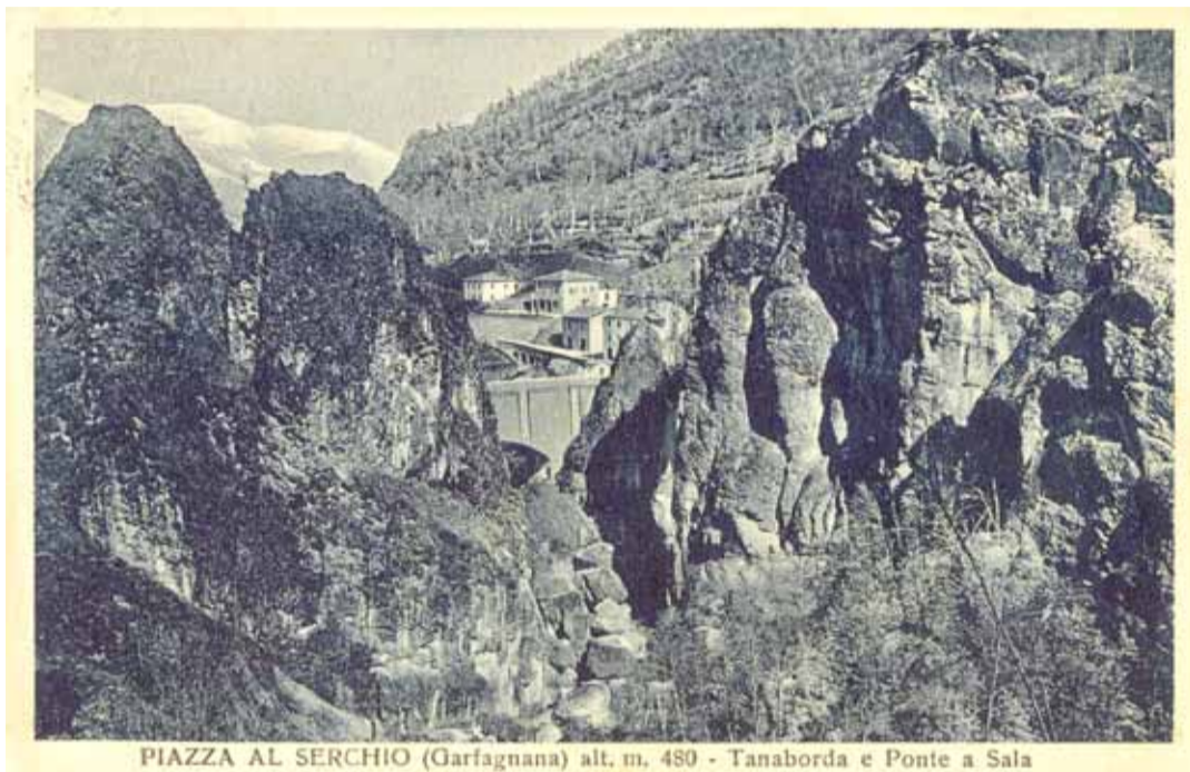
PIAZZA AL SERCHIO (Garfagnana) alt. m. 480 - Tanaborda e Ponte a Sala

le premesse non poteva andar diversamente per quelle di Sala. Ma a parte ciò Tanaborda è un nome relegato ai margini dell'abitato di Sala, quasi che il secondo toponimo (Sala) abbia avuto miglior esito o meglio abbia messo in sottordine il primo, di cui ormai si va perdendo il ricordo. In questa perdita di conoscenza del passato si potrebbe far rientrare anche l'interpretazione che di Tanaborda vien data, come tana sul bordo dell'area piana su cui Sala. Gli anfratti dei Pitoni di Sala potrebbero giustificare la voce tana, ma bordo, poi accordato a tana, mi pare poco appropriato, caso mai Bordo della tana, come Fosso della tana e Selva della tana. Tana della volpe, Tana del tasso, oggi pure Tana dell'istrice, oppure Tana grande per una caverna della Pania di Corfino, fanno pensare che la lettura popolare del toponimo sia fondata su voci della lingua conosciuta, ma riguardo alla sua origine, invece, vi potrebbe essere una diversa spiegazione. La struttura composita del toponimo mi spinge a vedervi un nome formatosi dall'unione di «tana» e «borda», così come in Maritonda – toponimo nei pressi della Sambuca – in cui riconobbi un nome proprio longobardo (da «mari» + «tonda»). È sostenibile per Tanaborda una