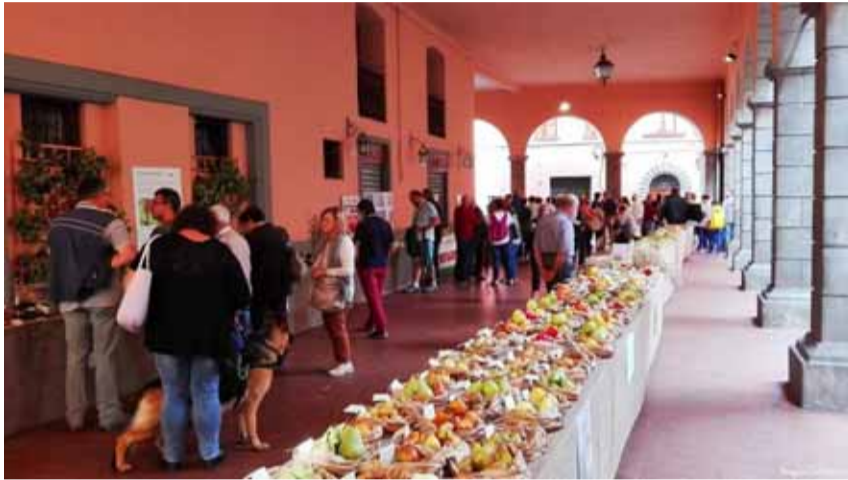
La festa dei frutti antichi sotto il Loggiato Porta

della manifestazione. Importante anche la presenza degli autieri, che nei due giorni hanno rievocato la realizzazione del frutto di mele, proprio come si faceva una volta, dando il via alle degustazioni dei presenti.