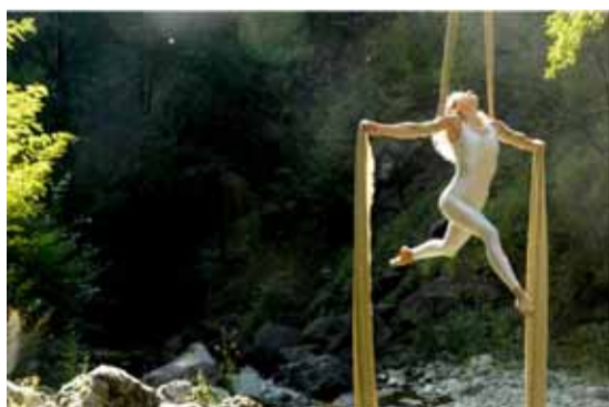
Una suggestiva immagine del viaggio filosofico