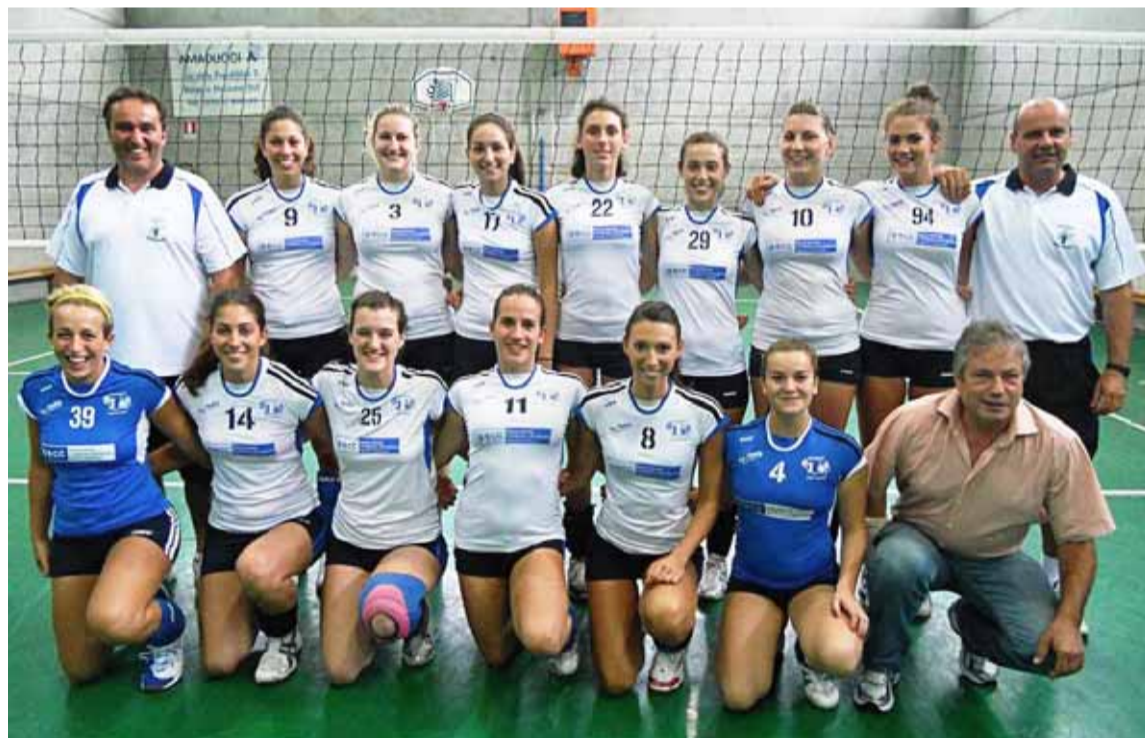
La squadra della Pallavolo Garfagnana