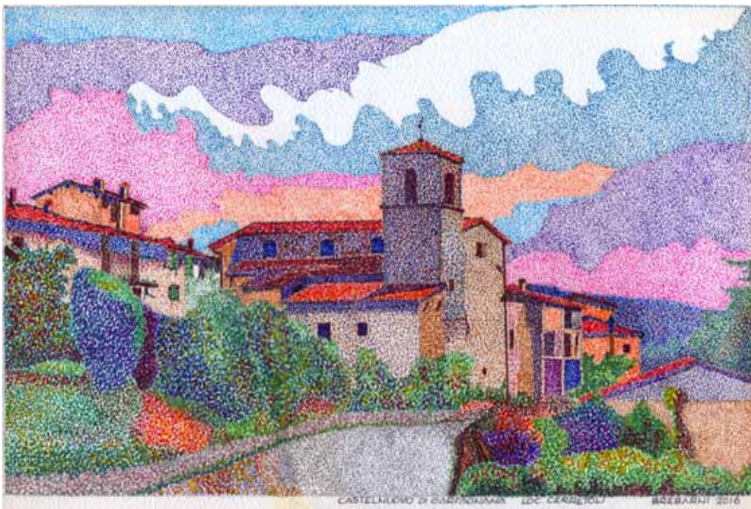
Cerretoli (Castelnuovo di Garfagnana)