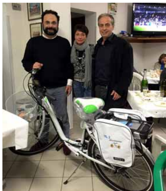
Il momento della consegna