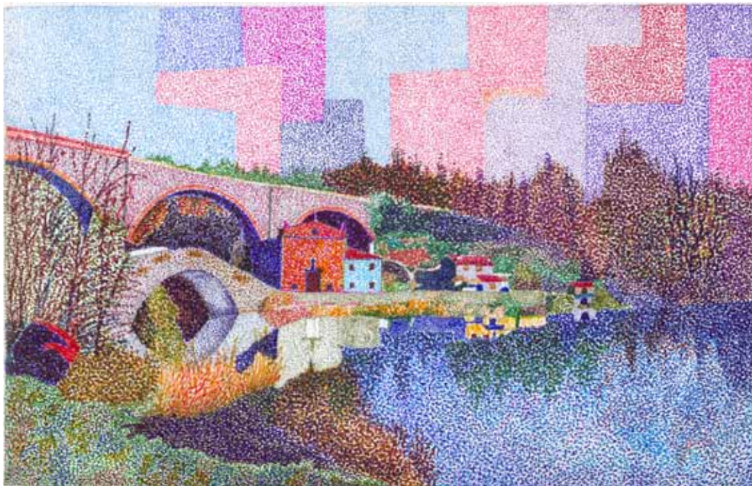
Pontecosi - Località La Madonna

'conformato' ad una più facile comprensione da parte della gente del luogo. Potrei parlare del toponimo Calabricchia di Camporgiano, che per opera di qualche erudito è stato trasformato in Colle Aprico, devo dire però con scarso successo. Ma più pertinente all'area è il nome di un livellario longobardo, Cunimundo, della Sala di San Michele (anno 883), oppure di altri Cunimundighi che quivi avevano interessi economici. Nel 1278 troviamo un Collimundus , e pure in quegli anni si consolida il toponimo Collemundinga , che darà poi Villa Collemandina. Di certo 'colle mundo' era più conforme alle parole in uso in piena età basso medievale che non il «cuni», con il significato di stirpe, più il «mund», con il significato di difensore. Insomma il 'difensore della stirpe' è divenuto il colle mundo (mondo/pulito), per questo può anche darsi che i Grotti di Sassone siano divenuti le Grotte Sassine, a causa di un lungo processo di trasformazione del nome che si è compiuto nei secoli. La lettura data del toponimo, quindi, non deve apparire insensata, ha un suo filo logico.