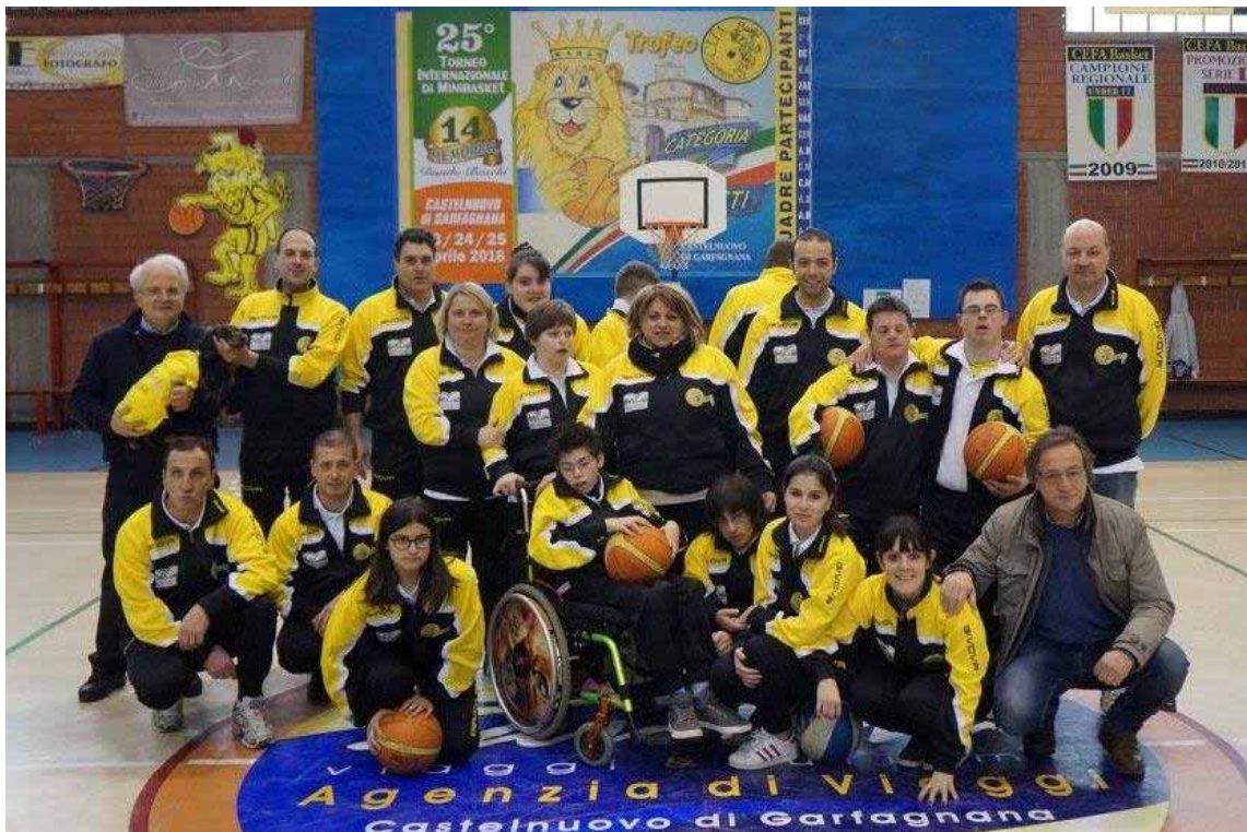
I ragazzi del Baskin con dirigenti, genitori e autorità

È stato presentato ufficialmente al Palazzetto di Castelnuovo la squadra del Cefa Baskin nell'ambito della prima edizione del Torneo di Baskin Castelnuovo. Una giornata importante per Castelnuovo e per il Cefa Basket e la concretizzazione di un sogno che nemmeno un anno fa sembrava un miraggio. Ospiti le società del Galaxy Porcari e del Gasp Slam Capannori. Nel pomeriggio prima del secondo incontro tra il CEFA Baskin ed il Galaxy Porcari il presidente