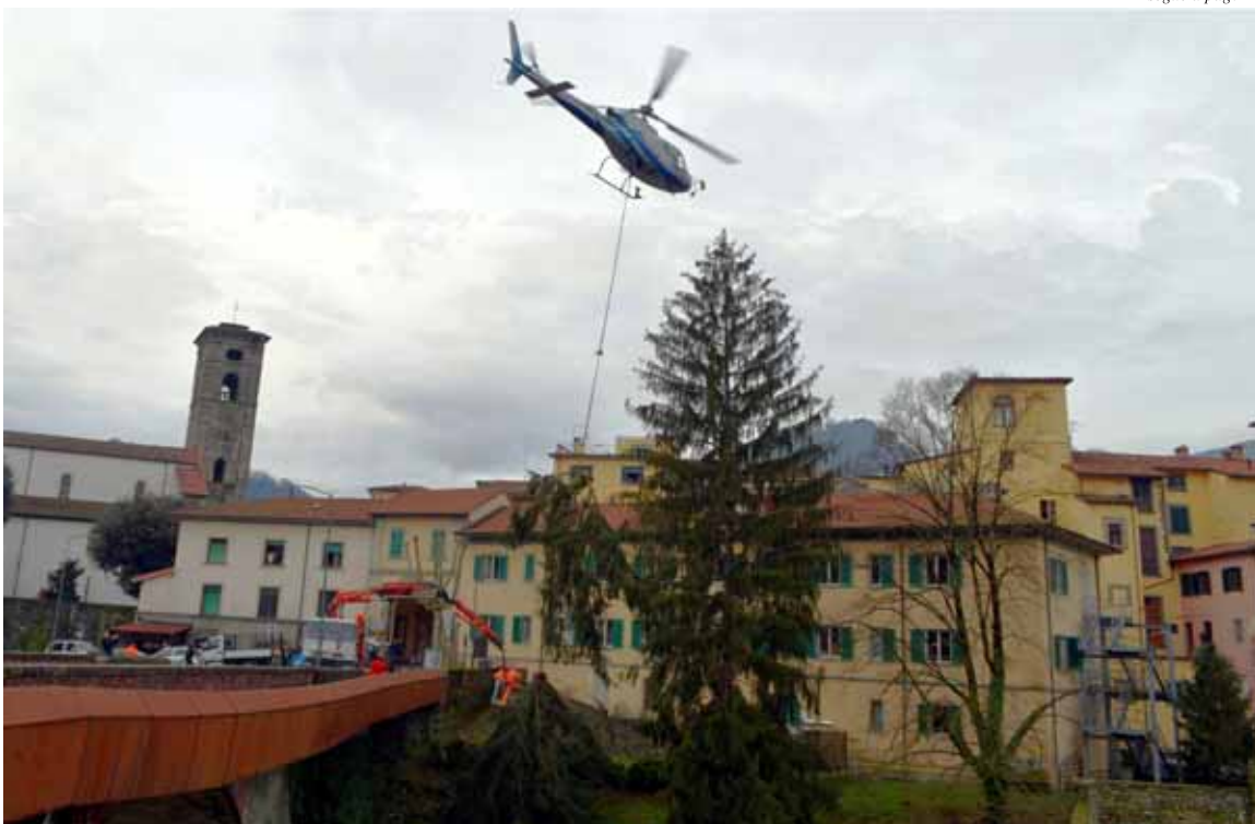
Una fase dell'intervento