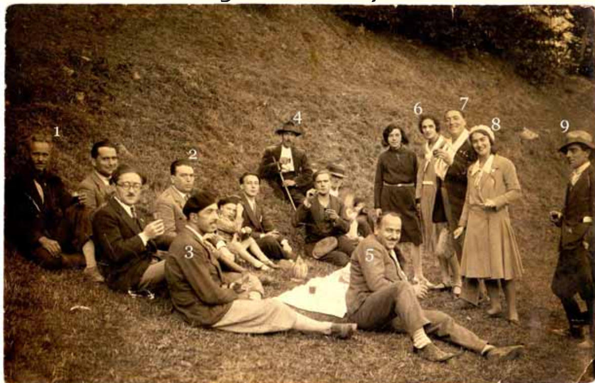
Scampagnata domenicale nei dintorni di Castelnuovo. Primi anni 1930.

Personaggi riconosciuti con l'aiuto di amici e collaboratori: