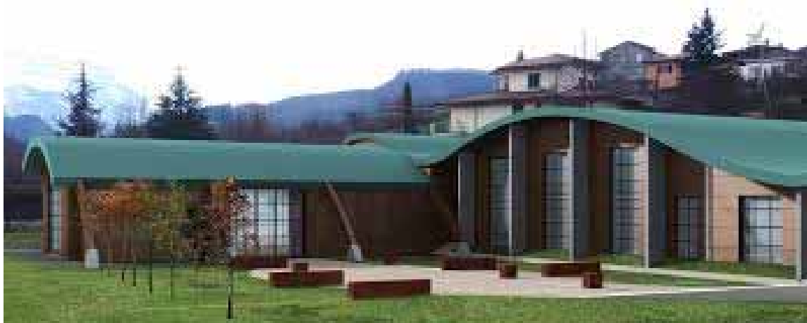
Come sarà l'edificio della Scuola Media di Piazza al Serchio