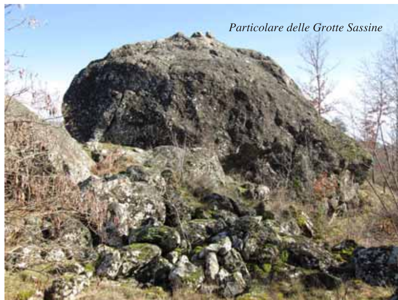
Particolare delle Grotte Sassine

PIAZZA AL SERCHIO (Lu) - Tel. 0583.696058