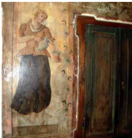
Uno degli affreschi del Palazzo Cilla a Giuncugnano

PIEVE FOSCIANA (LU) - loc. Pantaline Tel. 0583.65678