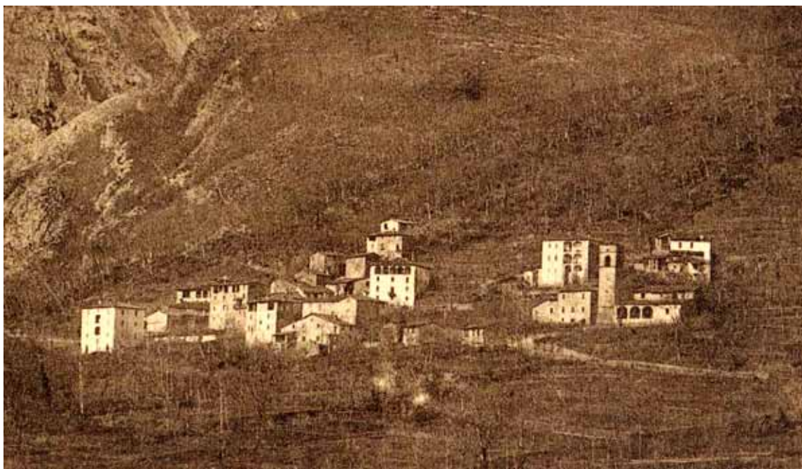
Magnano nei primissimi anni del secolo scorso