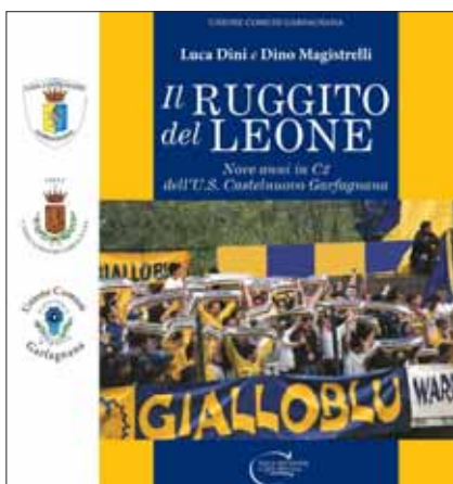
La copertina del libro con l'entusiasmo dei tifosi