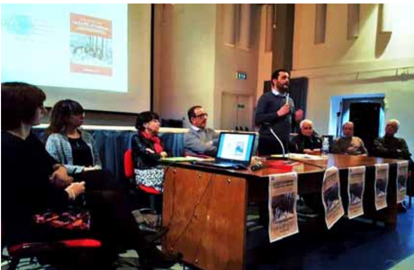
Un momento della presentazione