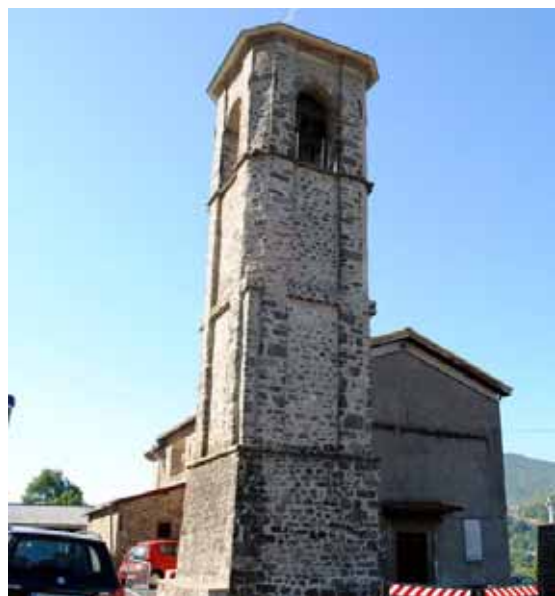
Chiesa di San Donnino

Sono iniziati in Comune di Piazza al Serchio i lavori di ristrutturazione e messa in sicurezza delle chiese parrocchiali di San Donnino e di Gragnana, le quali furono dichiarate inagibili dopo il terremoto del giugno 2013. Oggi, grazie all'impegno dei parrochiani, della Fondazione Cassa di Risparmio di Lucca e della Regione Toscana, con il supporto della Sovrintendenza ai Beni Culturali per la Provincia di Lucca e Massa Carrara ed il coordinamento del Comune di Piazza al Serchio, queste due strutture verranno recuperate e riaperte al pubblico. Sempre in comune di Piazza al Serchio, in precedenza erano state riaperte la Pieve di San Pietro e la parrocchiale di Cogna. Rimangono inagibili, sempre a causa del sisma del 2013, le chiese di Nicciano, per la quale comunque è stato reperito un finanziamento, di Petrognano e Sant'Anastasio.