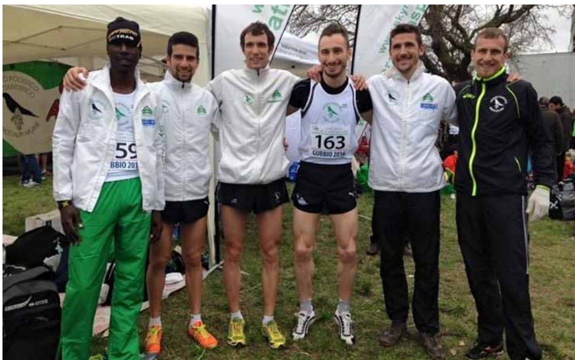
La squadra del Parco che ha corso a Gubbio.

Questa novità, ad avviso di chi scrive è decisamente in antitesi con l'evoluzione in corso a livello europeo dove si è cercato di uniformarsi al modello americano adottando un unico numero per tutti i tipi di emergenza. Da noi, invece, prima di comporre i numeri, gli utenti debbono fare una prima analisi cercando di comprendere la gravità del proprio malessere. In concomitanza con l'adozione di questa nuova numerazione, è