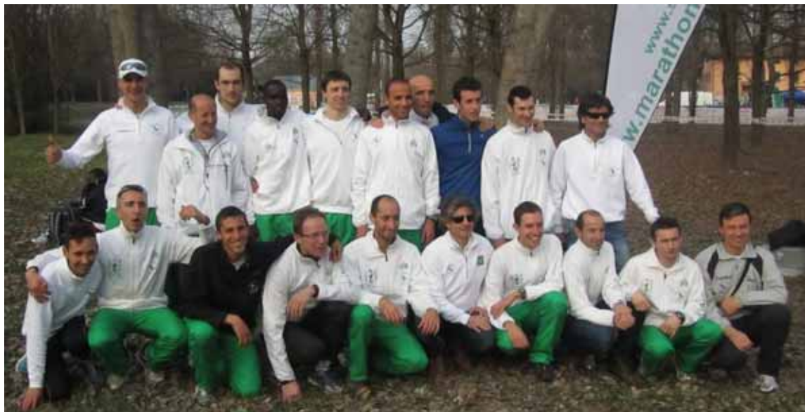
La squadra del GP Parco Alpi Apuane - Marathon Sport

Via Pettinella, 30 - Castelnuovo di Garfagnana (Lu) Tel. e Fax 0583 62943 - Email: flisuffredini@libero.it