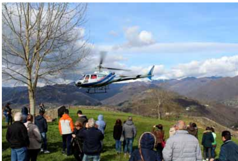
Si alza l'elicottero

a cui hanno dato collaborazione il Gruppo Autieri Garfagnana, il Gruppo di Protezione Civile e l'Associazione Compriamo a Castelnuovo. Il programma ha previsto l'apertura straordinaria delle attività commerciali, un apposito menù per i pranzi/merende nei ristoranti e l'arrivo di un treno speciale per i turisti della festa lungo la tratta Viareggio - Lucca - Castelnuovo, ed ha avuto due fulcri centrali: il centro storico e la