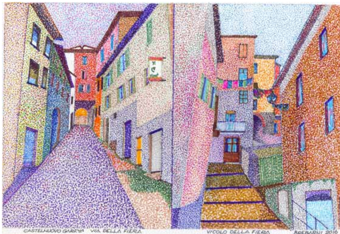
Castelnuovo di Garfagnana - Via della Fiera e Vicolo della Fiera