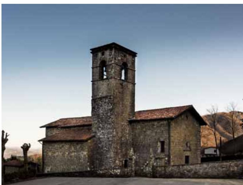
Chiesa di Vitoio

del muro a bozze ben riquadrate pertinenti all'originario impianto della chiesa, che sappiamo poi essere stata "allungata" nella parte occidentale, sottofondata per l'ampliamento dello spazio antistante l'ingresso e privata dell'abside a pianta semicircolare per fare posto ad una nuova struttura rettangolare per il coro, l'attuale scarsella. A lavori terminati, quindi, una parte ben conservata del paramento murario settentrionale della chiesa romanica è ben visibile nelle sue caratteristiche tecniche, per una migliore comprensione dell'evoluzione nel tempo del sacro edificio che le due comunità, di Vitoio e Casatico, vollero e seppero conservare e arricchire di notevoli opere d'arte. L'esecuzione dei lavori è avvenuta grazie al contributo della Regione Toscana, Dipartimento di Protezione Civile, della Fondazione Cassa di Risparmio di Lucca, per interessamento del dottor Alessandro Bianchini, e della Fondazione Banca del Monte di Lucca, preve autorizzazioni della Soprintendenza dei beni culturali e della Curia arcivescovile.