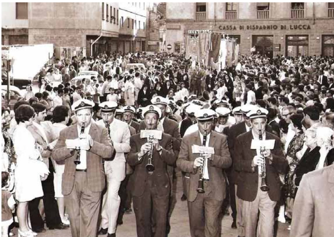
Manifestazione religiosa in Piazza Umberto I.

Tutte le manifestazioni religiose più importanti,