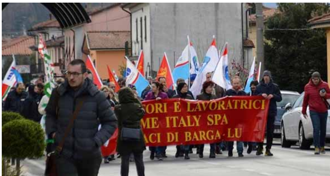
La manifestazione per la KME