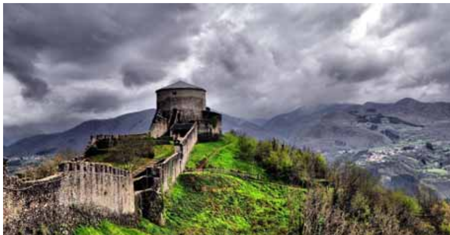
La Fortezza di Verrucole di San Romano in Garfagnana

Da qualche giorno è attiva su Facebook la pagina "Garfagnana, l'altra Toscana" e subito sono stati molti i click degli iscritti che si sono dimostrati molto interessati alla novità. Sulla pagina ven-