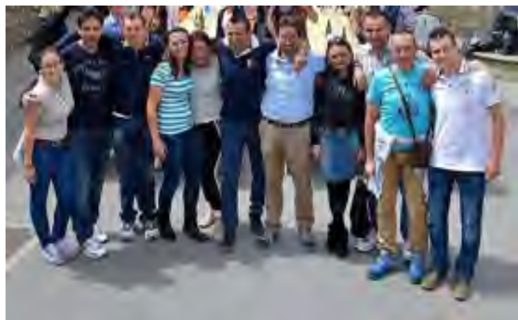
Il Sindaco con i Consiglieri

volta nel comune di Careggine con il 76,2% dei voti, i consensi, la percentuale più alta registrata in un comune dove si è avuta competizione con una lista avversaria, ha voluto celebrare l'avvenimento con un pranzo nel via principale del paese da lui offerto ai concittadini. 500 persone sedute a tavola per festeggiarlo, anche cittadini che non gli hanno espresso il loro consenso, venuti dalle frazioni, che si sono ritrovati uniti per solidarizzare dopo la competizione.