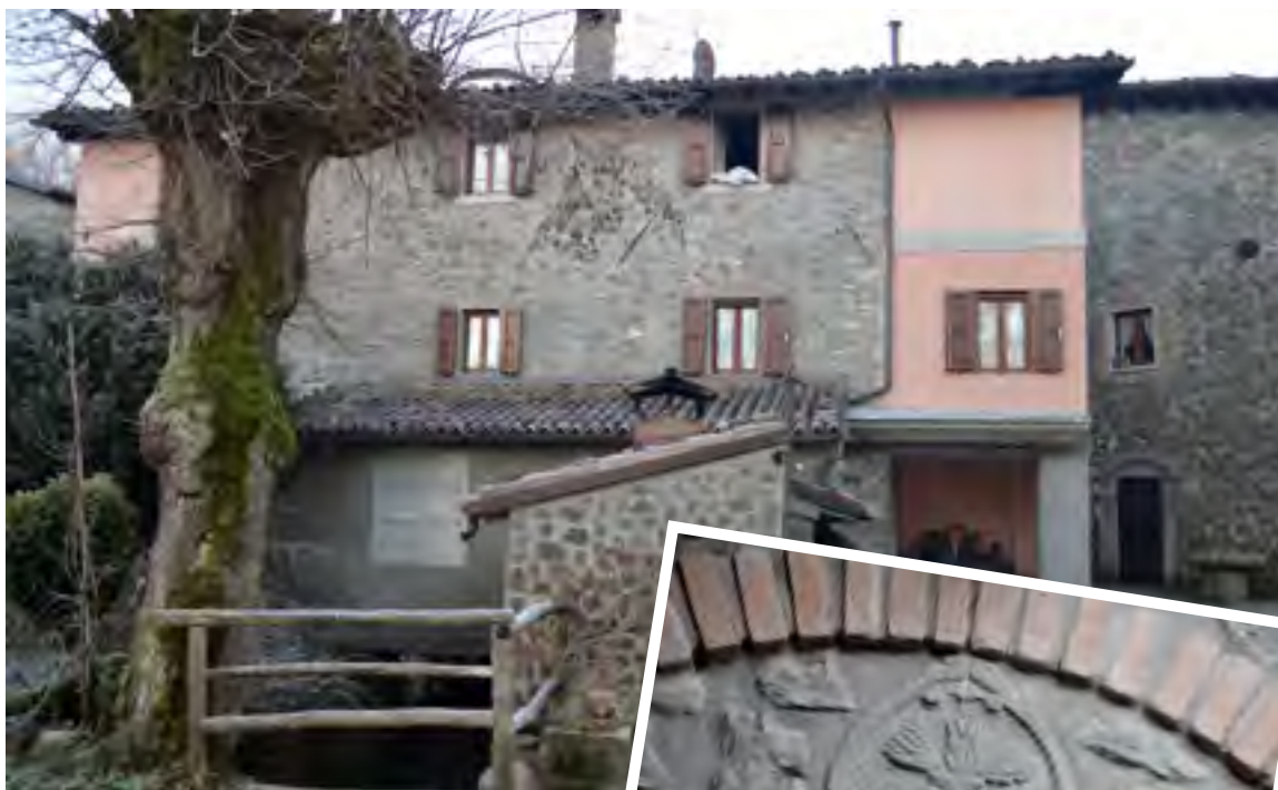
Il mulino comunale di Pieve Fosciana allo stato attuale e l'antico stemma inserito sulla porta d'ingresso

Con questo non vogliamo dire che i castiglionesi fossero litigiosi per natura. Pensiamo invece che, memori della loro gloriosa storia altomedievale e vicariale, essi mal sopportassero le limitazioni che venivano loro imposte da convenzioni politiche, non sempre imparziali e ragionevoli. Tra i numerosi atti pubblici, che ambedue le parti nel tempo sottoscrissero, uno che sicuramente i castiglionesi non riuscirono mai a digerire, e conseguentemente non ritennero di rispettare, fu il diritto di deviazione che Pieve Fosciana