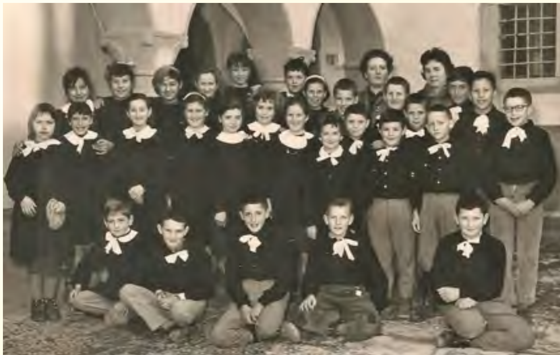
Anno scolastico 1958-1959. Fotografia degli alunni della scuola elementare di Borsigliana (Piazza al Serchio).