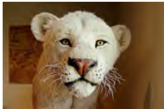
Un particolare del Leone delle caverne vissuto sulle Alpi Apuane fino a 11 mila anni fa.