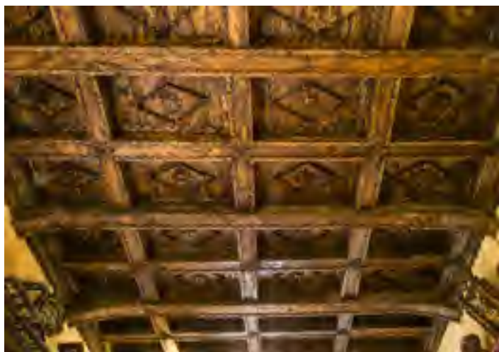
Nella foto di Raffaello Ferrari il soffitto a cassettoni della chiesa di Vitoio

PIAZZA AL SERCHIO (Lu) - Tel. 0583.696058