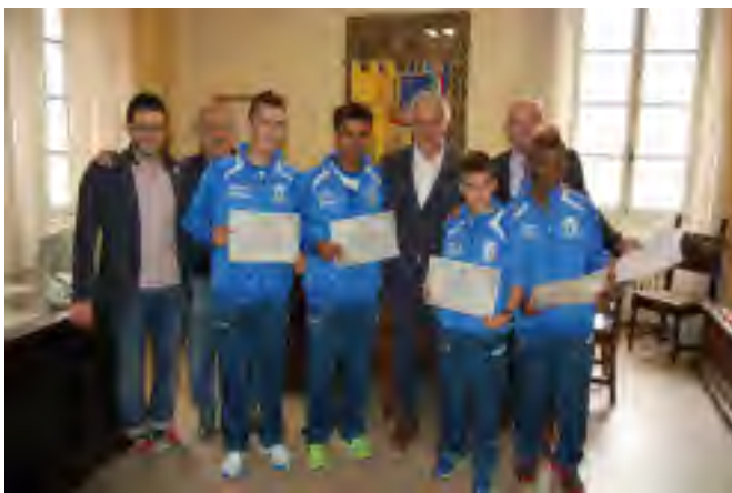
Nella foto la premiazione degli atleti in Comune

titolo nazionale conseguito dopo un'avvincente gara, per un totale di 3 mila, davanti al Gp Valchiavenna ed all' Atletica Trento. E' la prima