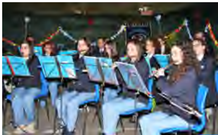
Nella foto di Roberto Bechelli la filarmonica "I ragazzi del Giglio"

Quest'anno l'annuale rassegna itinerante delle bande, nel Comune di Fosciandora si è svolta il 31 di maggio nel paese di Riana. Oltre alla filarmonica di casa "I ragazzi del giglio" è