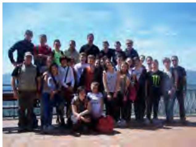
Nella foto: gli alunni a Sommocolonia

Gli alunni hanno seguito con attenzione e coinvolgimento le spiegazioni dei loro insegnanti e di Pietro Bonucci, completando poi la preparazione al ritorno in classe con lo studio di diverse pubblicazioni sull'argomento, tra cui "Linea gotica 1944: operazione Temporale d'inverno" di Davide Del Giudice, che contiene un'ampia testimonianza di Vittorio Lino Biondi.