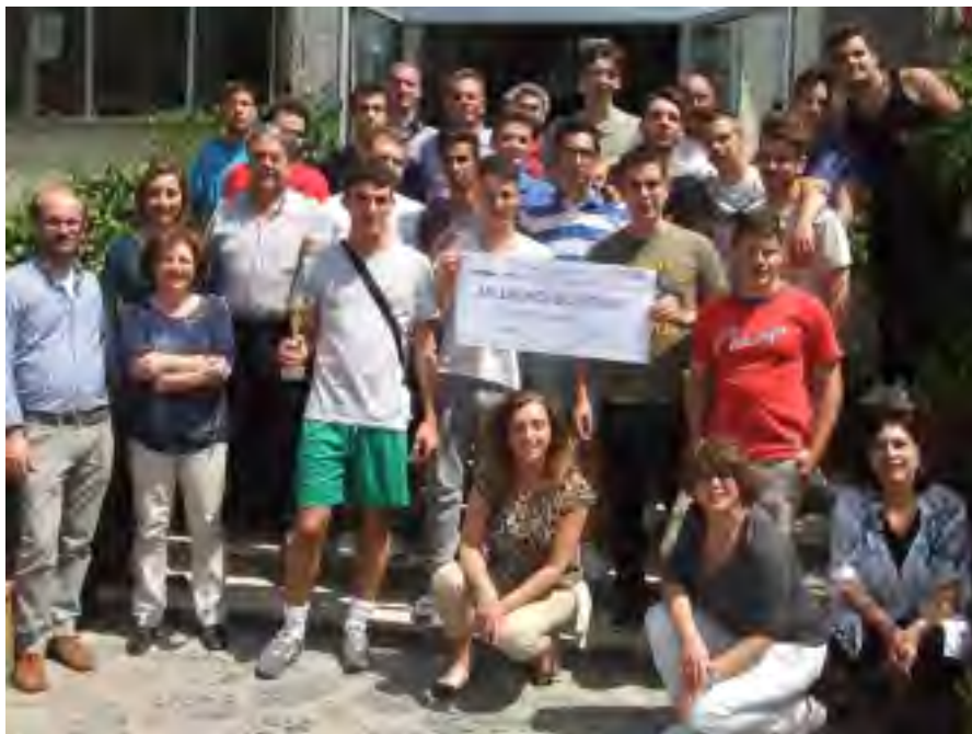
Nella foto gli studi vincitori con il preside e gli insegnanti

nel settore dell'Automazione. In ogni caso il 30 maggio eravamo lì, alla premiazione, e la nostra presenza per la Garfagnana e per l'IPSIA S.Simoni voleva dire molto. All'evento erano presenti (in prima fila) oltre ai più importanti dirigenti Siemens, anche numerosi rappresentanti del Ministero dell'Istruzione, dell'Università di Milano, degli Ordini professionali, dei giovani imprenditori e della Confindustria. Il progetto riguardava lo studio e le modifiche ai sistemi automatici di una piccola centrale idroelettrica della Garfagnana, presente nelle vicinanze della nostra scuola in località Cerri; questa centrale sfrutta le acque del torrente Turrite dando vita ad una centrale ad acqua fluente utilizzando due turbine di tipo Kaplan. Per realizzare questo, sono state adoperate apparecchiature di ultima generazione prodotte da Siemens. La presentazione del progetto da parte dei nostri studenti è stata perfetta, l'emozione fortissima, ma loro sono riusciti ad arrivare in fondo senza sbagliare. Bravi ragazzi! Arriva finalmente il momento della premiazione. Il gruppo garfagnino viene premiato davanti alla platea del Siemens Forum di Milano. Dal palco è intervenuto l'ing. Roberto Guidi della Siemens comunicandoci che ci siamo classificati al 9° posto su 68 progetti partecipanti da tutta Italia, i progetti sono tutti di altissimo livello, tra questi una mano artificiale automatizzata, un sistema completamente automatico in grado di realizzare e cuocere una pizza par-