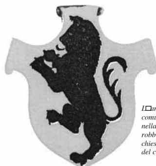
Antico stemma della comunità Castelnuovese nella predella della pala robbiana, presente nella chiesa dei SS. Pietro e Paolo del capoluogo.

In recenti ricerche territoriali condotte sulla base dei ricordi tramandati dagli abitanti di alcuni paesi della Garfagnana (Roggio, Casatico e San Romano) ho potuto