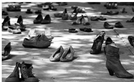
Scarpe rosse contro la Violenza sulle Donne. Più di cento le vittime in un solo anno, una violenza in continuo aumento